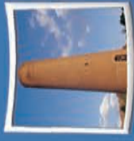
۲- منار آجری