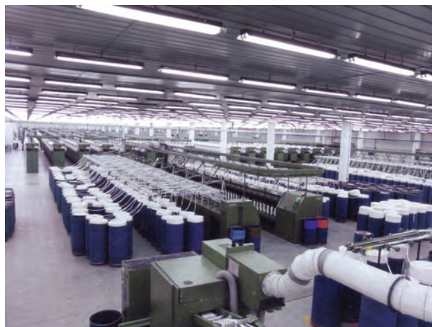
شکل ۴-۱۴- کارخانه نساجی بروجرد