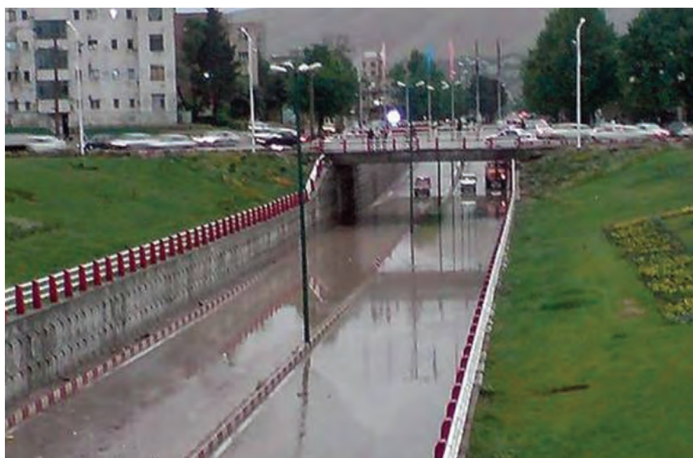
شکل ۱۰-۱۴- یکی از زیرگذرهای شهر خرم‌آباد

۳- حمل و نقل: استان لرستان به دلیل واقع شدن در مسیر راه‌های اصلی کشور و هم‌جواری با استان‌های مرزی و صنعتی به عنوان پل ارتباطی، میان شمال و جنوب کشور از موقعیت خاصی برخوردار است. از مهم‌ترین طرح‌های عمرانی در سال ۱۳۸۹ می‌توان به افتتاح آزاد راه خرم‌آباد - پل زال و چهارخطه کردن محورهای اصلی استان اشاره کرد. همچنین، آغاز عملیات پروژه‌های مهم آزاد راه خرم‌آباد - اراک، احداث خطوط ریلی دورود - بروجرد - غرب کشور و شبکه ریلی دورود - خرم‌آباد - اندیمشک و