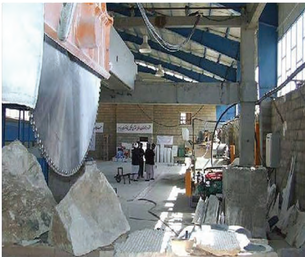
شکل ۷-۱۴- کارخانه سنگبری