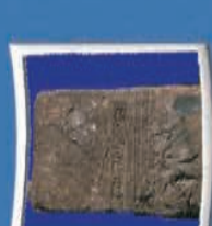
۸- سنگ نوزشه