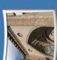
۷- مسجد جامع بروجرده