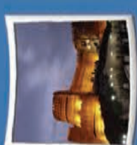
۵- فلک الاقلاک