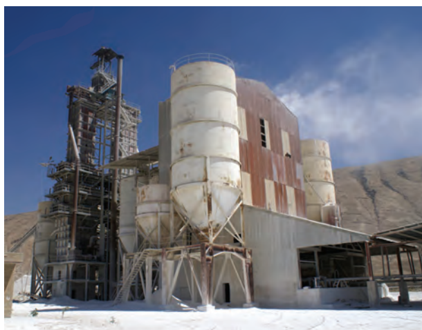
شکل ۳-۱۴- کارخانه آهک هیدراته پلدختر