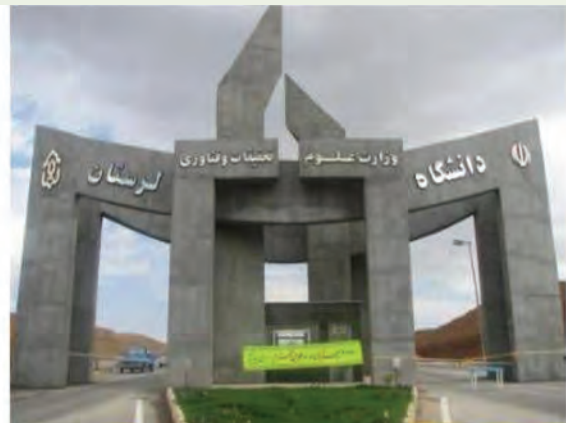
شکل ۱۶-۱۴ مراکز آموزشی استان

همان‌طور که انقلاب اسلامی در زمینه‌های مختلف در جهت توسعه و رونق استان لرستان دستاوردهای مهم و چشمگیری داشته است، در زمینه علمی – آموزشی نیز اقدامات زیادی انجام شده است که می‌توان به افزایش سطح پوشش تحصیلی در کلیه دوره‌های ابتدایی تا پایان دوره متوسطه، توسعه دانشگاه‌ها و مراکز آموزش عالی، گسترش رشته‌های مختلف برای ادامه تحصیل در سطوح مختلف دانشگاهی از کاردانی تا دکتری اشاره کرد.