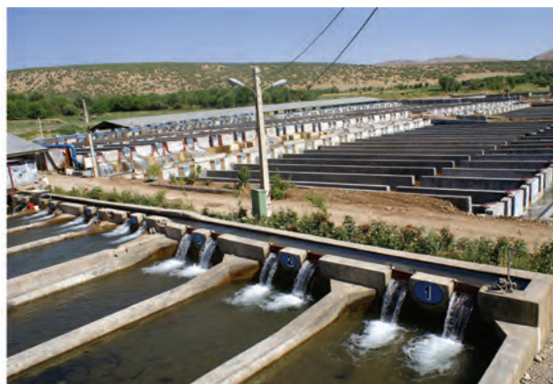
شکل ۲-۱۵- نمایشی از فعالیت‌های اقتصادی در استان