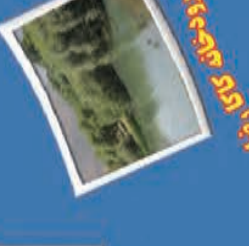
۱۶- رودخانه کور