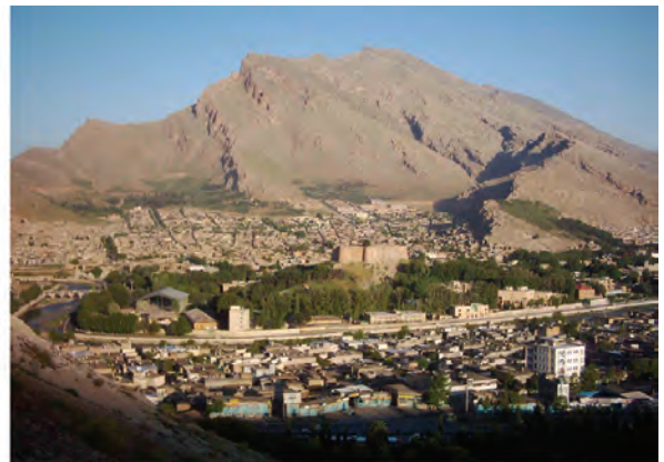
شکل ۱-۱۵- نمایی از چشم‌اندازهای شهرهای استان