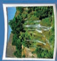
۹- آبشار میشه