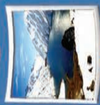
۱۱- دریاچه کهر