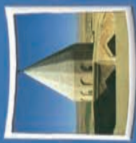
۳- امام زاده قاسم