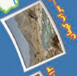
۱۵- دریاچه کهر