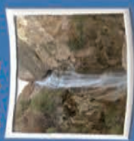
۱۲- آبشار نوزیان