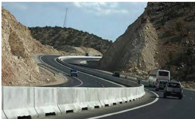
شکل ۲۱-۱۴ - آزادراه