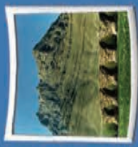
۱- بل شکسته