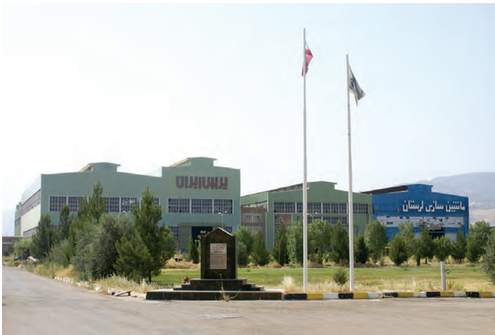
شکل ۱-۱۴- کارخانه پارس لرستان

استان لرستان از زمینه‌های مناسب توسعه صنعتی به‌ویژه در صنایع معدنی، کانی غیرفلزی، صنایع غذایی و نساجی برخوردار است. با وجود این مزایا، سهم استان از صنایع مادر تخصصی و پیشرفته ناچیز است. استان ما توسعه صنعتی را با اولویت به حفظ صنایع موجود و سرمایه‌گذاری در صنایع تبدیلی کشاورزی، کانی غیرفلزی، صنایع پایین دست پتروشیمی و دارویی انتخاب کرده است. پس از انقلاب شکوهمند اسلامی ۱۵۱۱ پروانه بهره‌برداری در بخش صنعت و معدن صادر شد که در این جهت، چهارده شهرک صنعتی، هفت شهرک فعال، چهار ناحیه صنعتی فعال و تعدادی شکل صنعتی و صنفی تشکیل شده است.