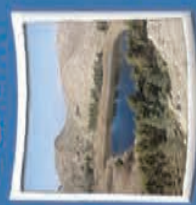
۱۰- کوری بلنک