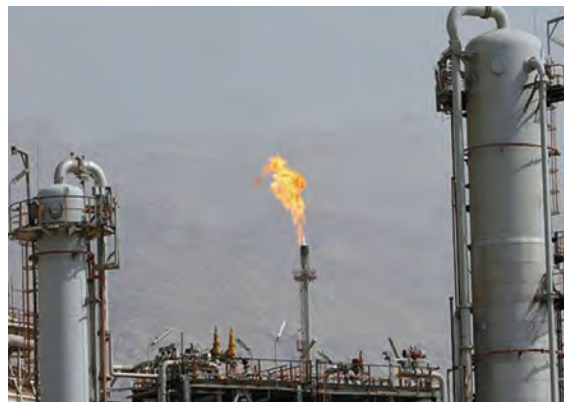
شکل ۲۰-۱۴ - نمایی از صنایع استان