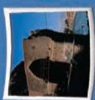
۴- بل دختر