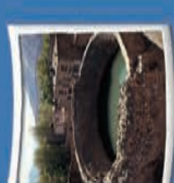
۶- کرداب سنگی