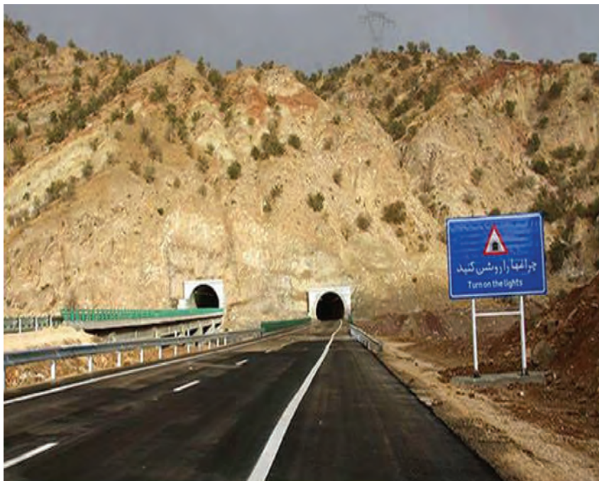
شکل ۱۲-۱۴- آزادراه خرم‌آباد - پل زال