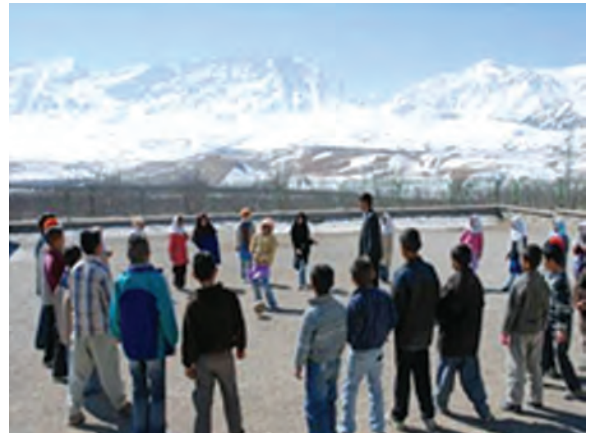
شکل ۲-۵- بازی‌های دسته‌جمعی