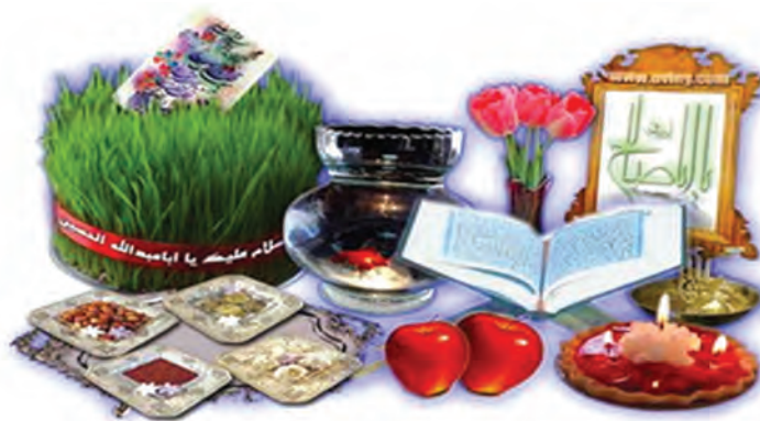
شکل ۹-۵- سفره هفت‌سین

ث) مراسم از عید نوروز تا سیزده نوروز: با پایان فصل سرما و آغاز بهار، مردم ما در تمام نقاط، جشن می‌گیرند. قبل از تحویل سال جدید، مراسم به اشکال و آداب مختلف انجام می‌گیرد؛ از آن جمله است: چهارشنبه‌سوری، قاشق‌زنی، خانه‌تکانی و سبزه سبزه کردن. هنگام تحویل سال، اکثر مردم به زیارت امامزادگان و اهل قبور می‌روند و مشغول خواندن دعا می‌شوند و بعد، همراه اعضای خانواده و بزرگ‌ترها درکنار سفره هفت‌سین که خود آداب خاصی دارد، می‌نشینند. بعد از آن مردم جهت انجام دید و بازدید به خانه روحانی، سید محله یا روستا و بزرگ‌ترهای فامیل می‌روند. در این ایام، مردم با شیرینی و آجیل از هم پذیرایی کرده، به یکدیگر هدیه می‌دهند و سال خوبی را برای هم آرزو می‌کنند.