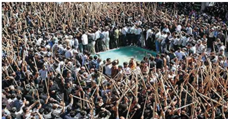
شکل ۱۱-۵- مراسم قالی‌شویی - مشهد اردهال

ج) مراسم قالی‌شویی «مشهد اردهال»: اردهال به علت شهادت حضرت سلطان علی، فرزند امام محمدباقر(ع)، در این محل به «مشهد اردهال» معروف شده است؛ به سبب حرمت تخته‌ای قالی که پیکر امامزاده علی را ابتدا روی آن قرار دادند و بعد به جای پیکر او غسل دادند، اصطلاح «مشهد قالی‌شویان» نیز مشهور است. در سیزدهم پاییز هر سال، نمایش آیینی قالی‌شویان که بیانگر اعتقاد خالصانه مردم منطقه به خاندان اهل بیت است، با شور و هیجان وصف‌ناشدنی انجام می‌گیرد.