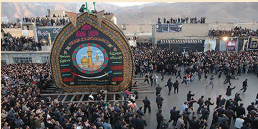
شکل ۸-۵- مراسم نخل‌گردانی

در این قسمت به برخی از مراسم مذهبی - ملی در سطح استان اشاره می‌شود. الف) مراسم نخل‌بندان (نخل‌گردانی) ۱ : مردم در تمام استان اصفهان برای مراسم مذهبی به ویژه «عاشورا» اهمیت ویژه‌ای قائل‌اند و از اول محرم، یکپارچه سیاهپوش می‌شوند. مراسم عزاداری به صورت هیئت‌های زنجیرزنی، سینه‌زنی و روضه خوانی برپا می‌شود و در روز «عاشورا» به اوج خود می‌رسد. نخل همراه با دسته‌های زنجیرزن، در شهر و روستا و در مکان‌های متبرک و امامزاده‌ها به گردش درمی‌آید؛ برای مثال در «خور و توابع آن» در روز ششم محرم، دو عَلم زینت داده می‌شود که با پارچه‌های رنگی و دستمال ابریشمی سیاه یزدی آراسته می‌شود و روزهای بعد نیز در مواردی، پوشش عَلم‌ها را تغییر می‌دهند.