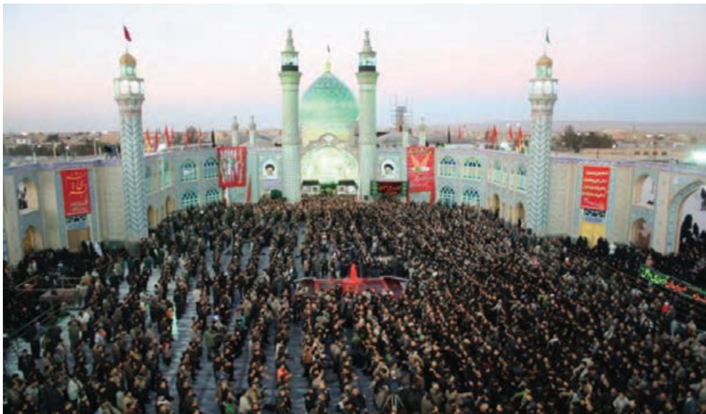
شکل ۳-۵- مراسم سوگواری حضرت امام حسین (ع) - آران و بیدگل

الف) تعزیه و روضه‌خوانی: از مهم‌ترین انواع ارتباطات سنتی و هنرهای نمایشی است که در آن، ترکیبی از هنرها، آداب و عناصر مختلف به کار گرفته می‌شود. تعزیه در لغت به معنای «سوگواری و یاد بود عزیزان در گذشته» است و در اصطلاح، به نوعی نمایش مذهبی و آداب و رسوم خاص اطلاق می‌شود که متناسب با شرایط خاص تاریخی، یادآور ظلم و جور حکام وقت، یادآور ستمکاری‌ها به امام حسین (ع) و یاران اوست. مضمون تعزیه، رویارویی دو نیروی خوب و بد، نور و ظلمت است. در تمام روستاها و شهرهای استان اصفهان، تعزیه به مناسبت‌های مختلف انجام می‌گیرد. در همه جای استان اصفهان به ویژه دههٔ محرم، این مراسم با شور و علاقهٔ وافری اجرا می‌شود؛ برای نمونه می‌توان از مراسم نخل‌گردانی و تعزیهٔ روستای ایبانه، و انواع دیگر نمایش‌های شهر نیاسر، بادرود، خوانسار، خمینی‌شهر و خوراسگان نام برد.