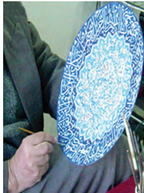
شکل ۱۴-۵- صنایع دستی و فرهنگ