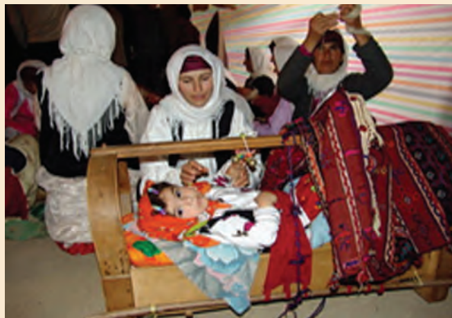
شکل ۱-۵- لالایی و انتقال فرهنگ

لالایی ها : لالایی ها، بخشی از ادبیات شفاهی سرزمین ماست که در کنار افسانه ها و قصه ها در گذشته کاربرد بسیار داشته است. لالایی، آوازی است که مادران برای خواباندن کودک شیرخواره می خوانند. لالایی نخستین ارتباط کلامی و رابطه همسخنی مادر با کودک است که برای هردو، این موسیقی آهنگین، موجب آرامش جسم و روح مادر و کودک می شود. در مناطق مختلف استان اصفهان، لالایی و دوبیتی های محلی، به طور خودجوش توسط زنان و مردان با ذوق در وزن های ساده سروده شده است.