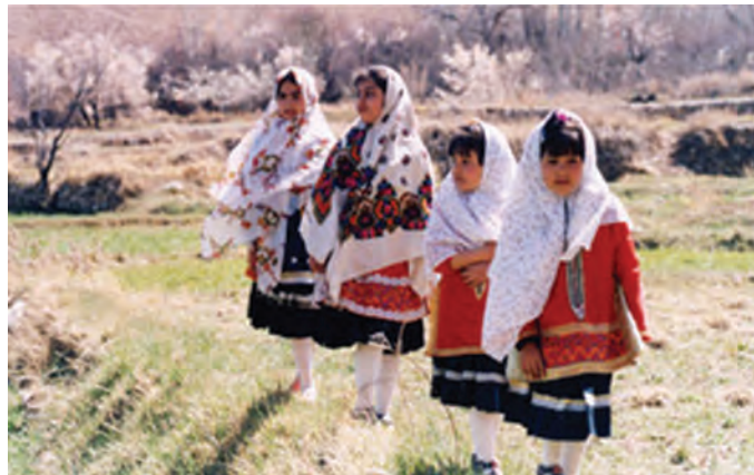
شکل ۵-۶- لباس سنتی مردم ایبانه

لباس سنتی مردم ایبانه ۱ : این نوع لباس بیانگر ویژگی‌های جغرافیایی، باورها، اعتقادات و ویژگی‌های فرهنگی مردم این قسمت از استان است که ریشه در اعماق تاریخ ایرانیان دارد و نشانگر سنت‌های زیبای ایران باستان است.