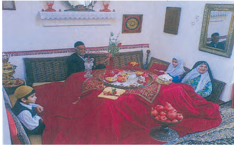
شکل ۱۳-۵- خانواده