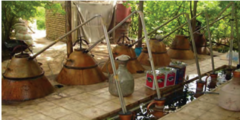
شکل ۱۰-۵- گلاب‌گیری (قمصر کاشان)

روز سیزده فروردین نیز مردم سبزه سفره هفت‌سین را از خانه بیرون می‌برند. این روز، روز بزرگداشت و احترام به طبیعت است و تا پایان روز، افراد خانواده و فامیل در کنار هم در دشت و سبزه‌زار ساعتی را می‌گذرانند. ج) مراسم گلاب‌گیری: گلاب‌گیری در قمصر، برزک، نیاسر، جوشقان و کاشان از قدمتی دیرینه برخوردار است که این، خود از رواج کاشت گل محمدی در این منطقه خیر می‌دهد و نسل به نسل از گذشتگان به فرزندان انتقال یافته است.