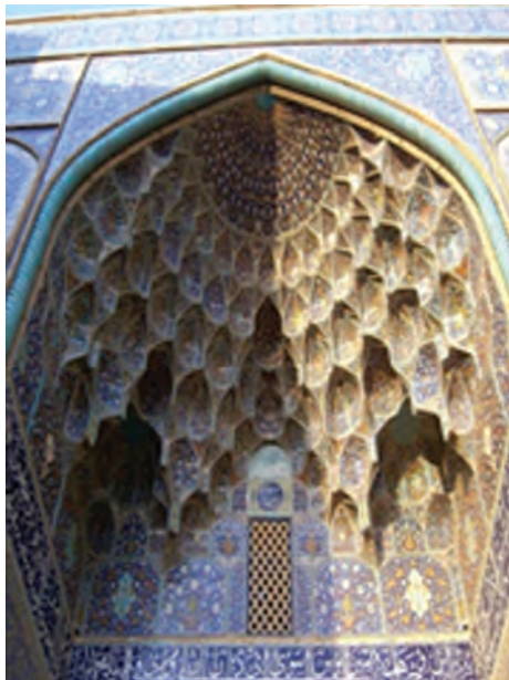
شکل ۱۵-۵- معماری و فرهنگ

فرهنگ استان اصفهان هرچند بخشی از فرهنگ جامعه ایرانی است ولی دارای ویژگی‌های خاص خود نیز است. فرهنگ غنی اصفهان از گذشته تاکنون، آثار هنری قابل توجهی را در زمینه‌های متعدد به خود اختصاص داده است؛ از جمله: سبک معماری، موسیقی و ساخت آلات موسیقی (اتاق موسیقی در عمارت عالی قاپو)، بافت فرش دستباف، گلیم و عبا (نائین، نجف‌آباد و کاشان) و پارچه‌های نخی (خور و ورزنه)، تهیه انواع سفال و کاشی (شهرضا) و سایر صنایع دستی و سوغات منحصر به فرد. روستاها و شهرهای استان ما، همه بیانگر جلوه‌های بیرونی فرهنگ استان‌اند.