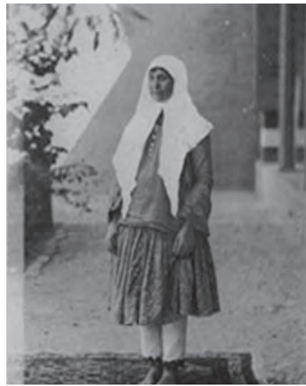
شکل ۵-۵- لباس زنان و مردان اصفهانی (۱۵۰ سال قبل)

از مهم‌ترین ویژگی‌های پوشش سنتی مردم، می‌توان با توجه به رعایت پوشش بدن، تولید محلی تن‌پوش‌ها، سادگی، زیبایی، رنگارنگی، رعایت پاکیزگی، تناسب با ویژگی‌های آب و هوایی منطقه، اشتغال تعداد زیادی از افراد به امر تهیه و تولید پوشش و تن‌پوش‌ها، تنوع آنها و ... اشاره کرد. در استان ما، پوشش و لباس از اهمیت زیادی برخوردار است ولی با گذشت زمان، پوشش سنتی کمتر به کار می‌رود.