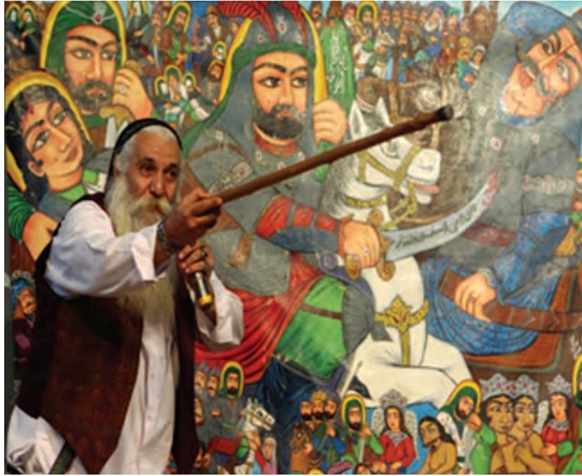
شکل ۴-۵- برده‌خوانی

پهلوانی و حماسی»، «نقالی مذهبی» و «نقالی تفریحی» می‌توان تقسیم کرد. از مهم‌ترین آن‌ها، نقالی پهلوانی و حماسی، شاهنامه‌خوانی و قصه‌خوانی است که در آن داستان‌های منظوم شاهنامه فردوسی با صدای رسا و گرم، همراه با حالات و حرکات مختلف چهره و دست برای تماشاگران نقل می‌شود.