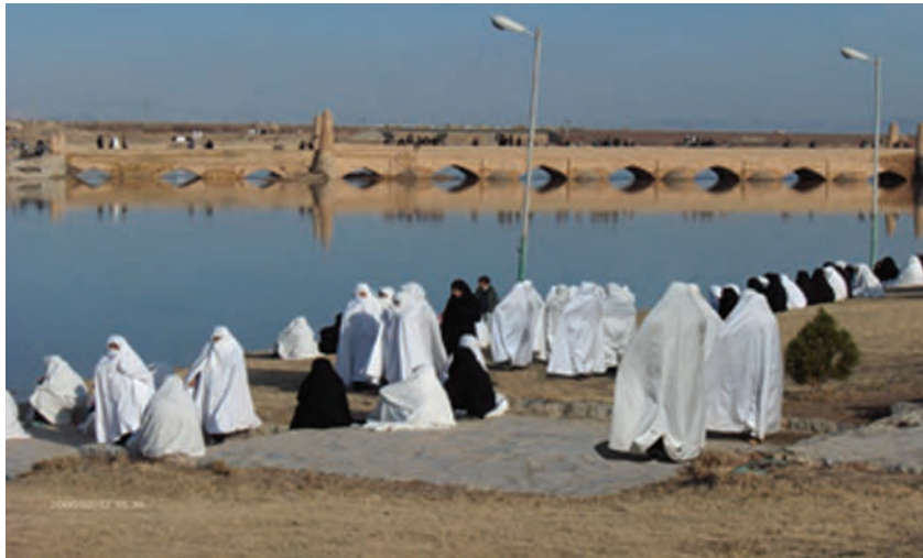
شکل ۷-۵- پوشش زنان و رزنه

چادر سفید و رزنه: پوشیدن چادر سفید، مشخصه منحصربه‌فرد شهر و رزنه است. گفته می‌شود که پوشیدن چادر و لباس سفید در این منطقه، دلایل تاریخی و جغرافیایی دارد: اغلب زنان و دختران این شهر به شیوه نیاکان خود، از چادر سفید استفاده می‌کنند. شرایط آب و هوایی منطقه، شغل کرباس‌بافی، کشت و کار پنبه و در دسترس نبودن پارچه‌های شهری در گذشته، از عوامل مؤثر در وجود این سنت است.