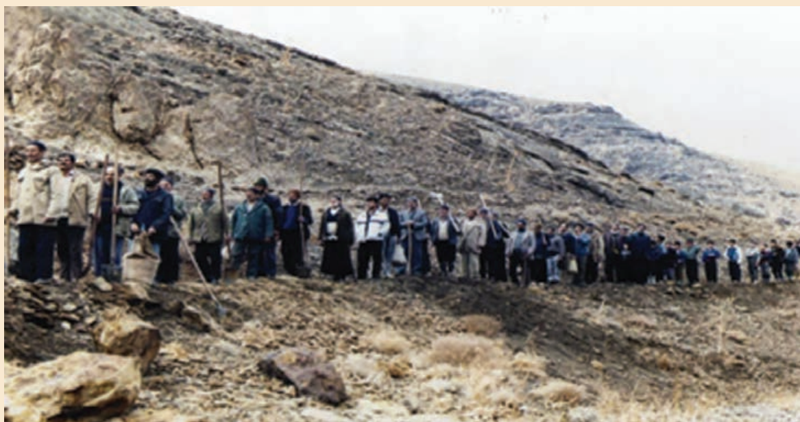
شکل ۱۲-۵- لایروبی جوی‌های آب نمونه‌ای از همکاری اهالی با یکدیگر - سمیرم

هرچند با مکانیزه شدن کشاورزی و صنعتی‌تر شدن جامعه، این مراسم کمرنگ شده ولی همیاری و تعاون همچنان در فرهنگ ایرانی - اسلامی ما از اهمیت خاصی برخوردار است.