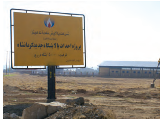
شکل ۶-۶- پالایشگاه نفت آنارها کرمانشاه