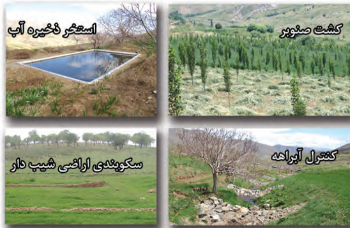
شکل ۵-۶- مهم ترین دستاوردهای بخش منابع طبیعی