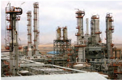
شکل ۲-۶- مجتمع پتروشیمی کرمانشاه