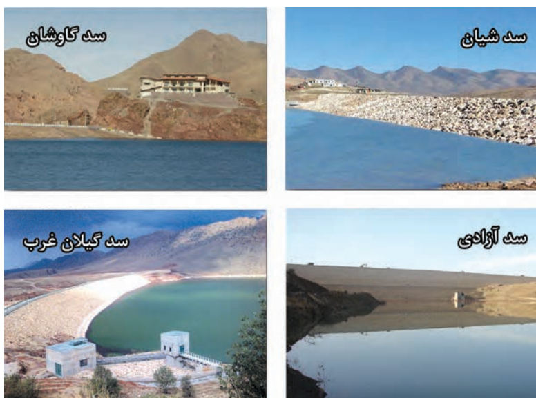
شکل ۳-۶- نمایی از برخی از سد های استان کرمانشاه