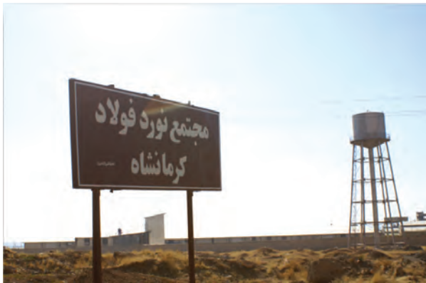
شکل ۷-۶- مجتمع نورد فولاد کرمانشاه