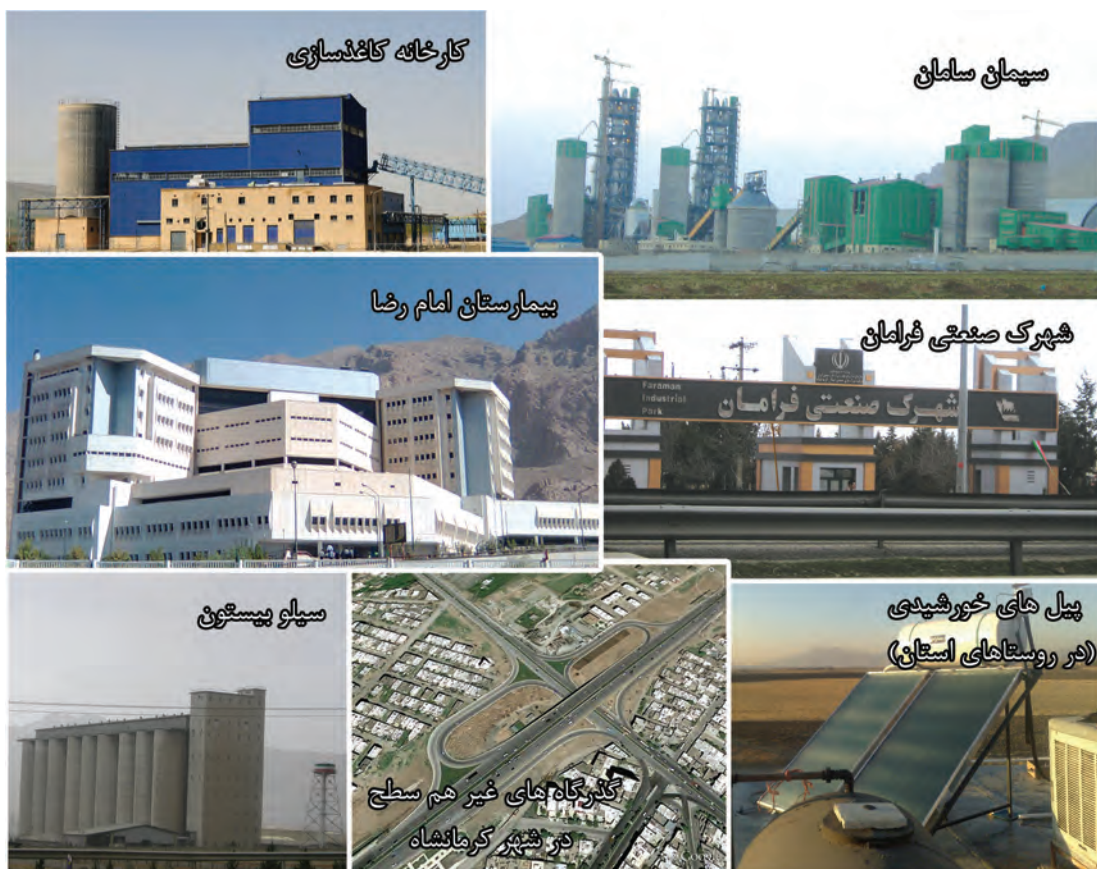
شکل ۴-۶- تصاویری از دستاوردهای استان کرمانشاه