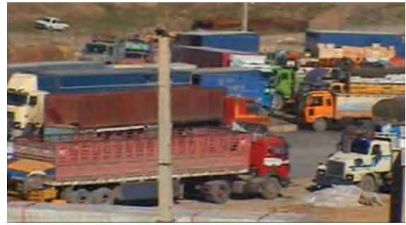
شکل ۱-۶- بازارچه مرزی پرویزخان

در دهه اول پس از انقلاب اسلامی، سرعت توسعه در بخش‌های زیربنایی و عمرانی استان کرمانشاه مانند دیگر استان‌های واقع در غرب کشورمان، به دلیل موقعیت مرزی و تأثیر مستقیم از جنگ تحمیلی، روند کندی داشت. اما در دهه‌های بعدی روند حرکت سرعت بیشتری یافته است. نمود این تحولات در استان را می‌توان در بخش‌های مختلف اقتصادی و زیربنایی مشاهده کرد. در این درس به‌طور گذرا مهم‌ترین این دستاوردها در بخش‌های مختلف بررسی می‌شود: