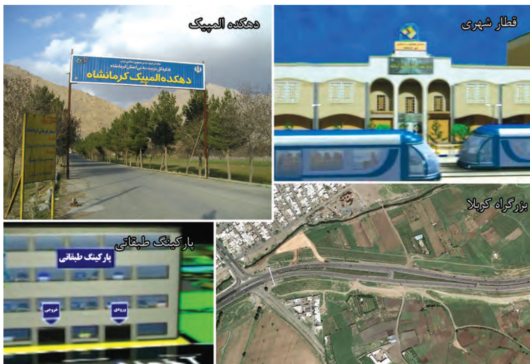
شکل ۸-۶- بخشی از چشم انداز استان کرمانشاه در بخش خدمات