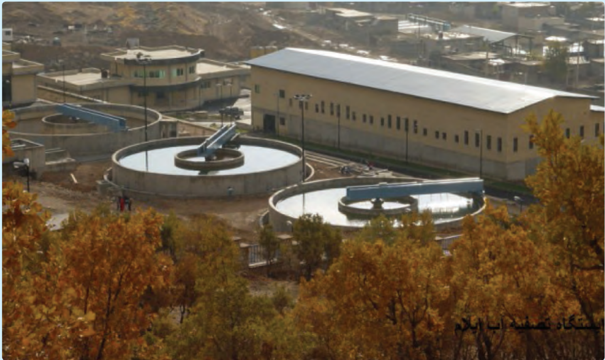
استگاه تصفیه آب ایلام