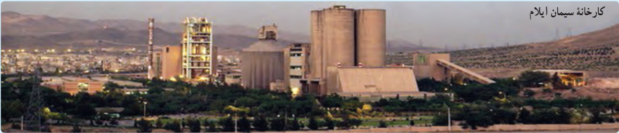
کارخانه سیمان ایلام