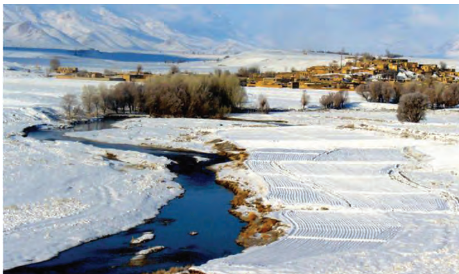
شکل ۱-۲- روستایی در فریدن

گفتنی است که وجود ۲۸ روستا به عنوان هدف گردشگری، تصویب ۶۰ منطقه نمونه گردشگری در توسعه گردشگری در استان اصفهان مؤثر بوده است. علاوه بر این، تعریف ۲۸ محور گردشگری، تولید نقشه ایران با محورهای گردشگری، حفظ و احیای رشته های صنایع دستی و ارائه سامانه اطلاعات مکانی آثار تاریخی و فرهنگی استان و طرح ملی تور الکترونیکی سبب افزایش گردشگران داخلی و خارجی در اصفهان شده است.