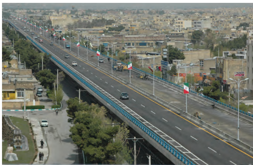
شکل ۳-۷- پل روگذر غیر مسطح امام خمینی (ره)

— حمل و نقل درون شهری : تا پایان شش ماهه اول سال ۱۳۸۷ سهم حمل و نقل عمومی در کلان‌شهر اصفهان ۶۸ درصد بوده است. طی ۳۰ سال (۸۵-۱۳۵۸) جمعیت شهری استان حدود ۲/۱۵ برابر شده؛ در حالی که تعداد وسایل حمل و نقل عمومی به بیش از ۵۹ برابر رسیده است.