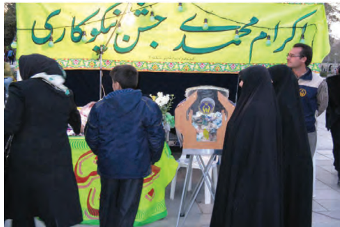
شکل ۲-۷- جشن نیکوکاری

عام‌المنفعه، خدمات خود را در جهت سه محور امور حمایتی از محرومان، امور توانمندسازی محرومان و امور اعتمادسازی و جلب مشارکت‌های مردمی دنبال می‌کند.