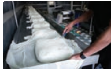
شکل ۴-۳- آب‌گیری از لخته