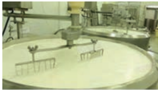
شکل ۴-۴- آب‌گیری و برش لخته

د) نمک‌زنی: هدف از نمک‌زنی بهبود طعم و مزه، تنظیم رطوبت، ممانعت از رشد میکروب‌های بیماری‌زا، بهبود ویژگی‌های بافتی و افزایش قابلیت نگهداری پنیر است.