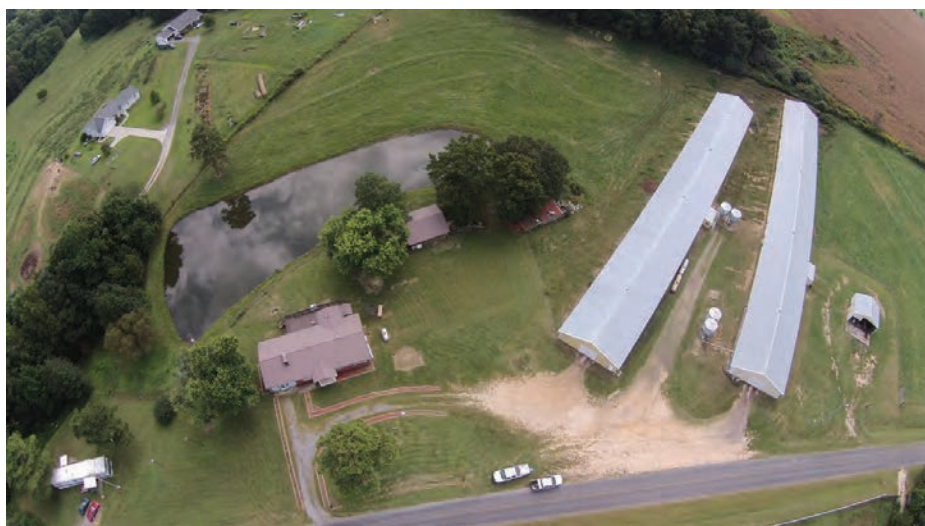
شکل ۱۱- تصویر مرغداری در کنار جاده اصلی

مرغداری‌ها باید از کنار جاده فاصله داشته باشند تا در اثر تردد کامیون‌هایی که مرغ زنده و یا کود حمل می‌کنند در معرض آلودگی قرار نگیرند. در عکس زیر یک مرغداری با فاصله بسیار کم از جاده ترانزیت دیده می‌شود. جاده‌های ترانزیت ریسک بسیار بالایی برای انتقال آلودگی دارند چون ممکن است در اثر تردد کامیون‌ها آلودگی را از یک کشور به کشور دیگر منتقل سازند.