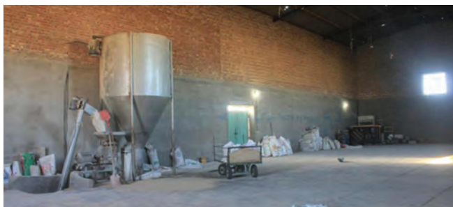
شکل ۷- سالن انبار مواد اولیه خوراک و محل تهیه دان

قسمتی برای احداث انبار مواد اولیه و همچنین محل ساخت دان در نظر گرفته شود. ظرفیت این قسمت باید طوری محاسبه شود که گنجایش مصرف ۴ ماه طیور را داشته باشد.