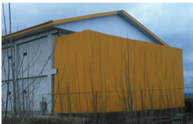
شکل ۸- انبار لوازم، پوشال و کلش

یک انبار برای سایر لوازم و یا پوشال و کلش در نظر گرفته شود.