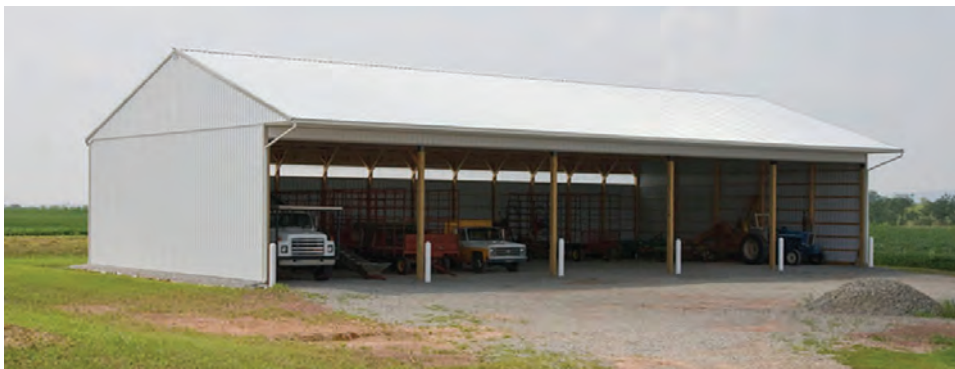
شکل ۶- پارکینگ وسایل نقلیه

قسمتی جهت پارک وسایل نقلیه و سرویس آنها و نیز بخشی به عنوان دفتر فنی برای انجام تعمیرات در نظر گرفته شود.