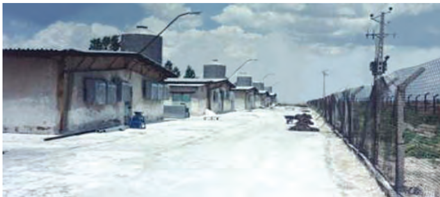
شکل ۱- حصارکشی اطراف سالن‌های مرغداری