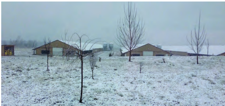
شکل ۲- نمونه سالن در مناطق سرد

موقعیت مزرعه باید طوری باشد که مواد اولیه خوراک طیور با طی مسافت کم و کمترین هزینه به مزرعه برسند. همچنین به منظور رساندن تولیدات به بازار، مزرعه باید به ایستگاه قطار و یا فرودگاه نزدیک باشد.