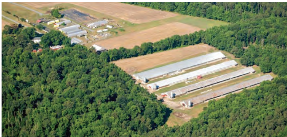
شکل ۱۰- نمونه احداث بادشکن در اطراف سالن‌های مرغداری

احداث بادشکن برای اطراف سالن‌ها بسیار ضروری است. درخت‌کاری در اطراف سالن‌ها در صورتی که فصل مناسب است قبل از زمان شروع عملیات ساختمانی توصیه می‌شود. وجود درختان علاوه بر پاکیزگی و تعدیل هوا و نقش بادشکن، نقش مهمی در قرنطینه کردن محوطه مرغداری دارد.