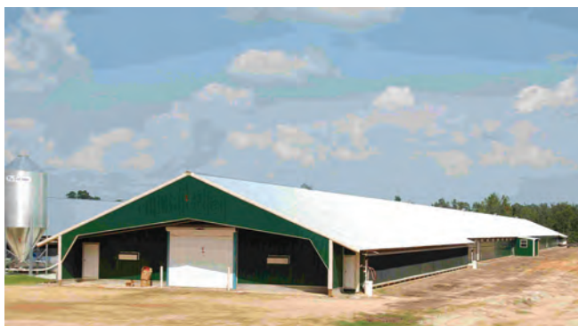
شکل ۹- منظره مرغداری قبل از محوطه سازی

در صورتی که مزرعه تولید تخم مرغ دارد محلی برای درجه بندی، دود دادن و انبار تخم مرغ در نظر گرفته شود. قسمتی را جهت کالبدگشایی طیور تلف شده و دفع ضایعات (کوره لاشه سوز) در نظر بگیرید.