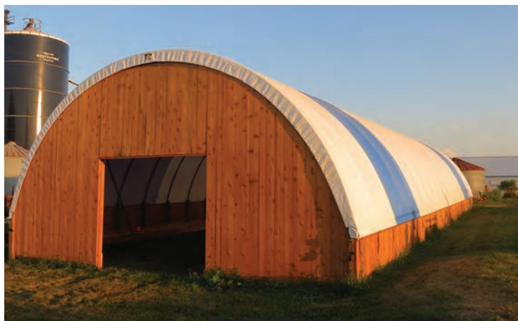
شکل ۱۲- نمای بیرونی سالن‌های برزنتی (کشور فرانسه)