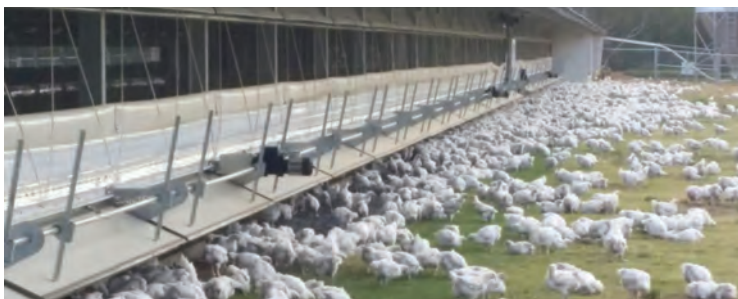
شکل ۳- نمونه سالن در مناطق گرم و مرطوب (شرجی)