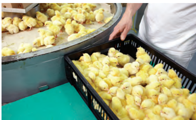
۱. انتقال جوجه‌ها به کارتن‌ها به صورت دستی