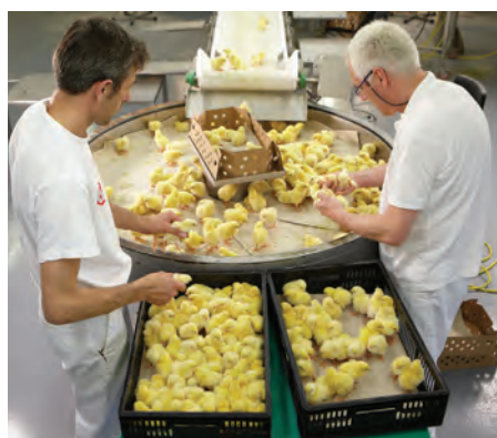
۲. انتقال جوجه‌ها به کارتن‌ها با استفاده از نوار نقاله

در فصول گرم سال در صورتی که درجه حرارت بالای ۲۱ درجه سانتی‌گراد باشد در کارتن‌ها ۸۰ قطعه جوجه و در صورتی که حرارت از ۲۱ درجه سانتی‌گراد پایین‌تر باشد ۱۰۰ قطعه جوجه را در