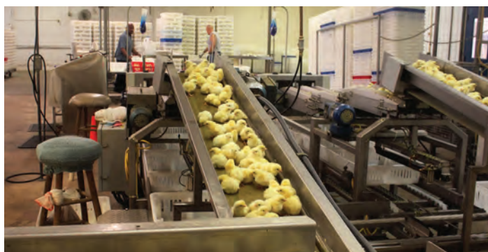
انتقال جوجه‌ها برای درجه‌بندی