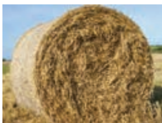
کاه و کلش حاصل از غلات

پسماندهای صنعتی - کشاورزی: بقایا و محصولات فرعی حاصل از بخش کشاورزی و صنعت هستند که با توجه به کمبود منابع آب و خوراک دام در ایران و کشورهای خشک از آنها در تغذیه دام استفاده می‌شود. این پسماندها ارزان قیمت هستند که ارزش غذایی متنوع و گاهی خوب دارند و می‌توانند کمک زیادی به تأمین خوراک دام نمایند که از آن میان می‌توان به موارد زیر اشاره کرد: کاه غلات، سرشاخه‌های نیشکر، کود مرغی فراوری و میکروزدایی شده، پوسته بیرونی پسته، پوسته بیرونی بادام، تفاله پرتقال، تفاله زیتون، تفاله سیب، تفاله انگور، پوست و تفاله انار و مانند آن.