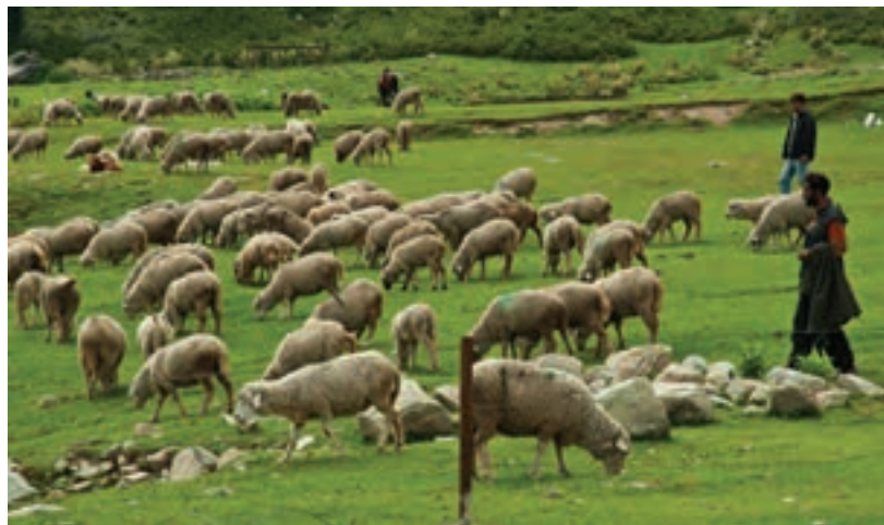
چرای گوسفند در مرتع

توزیع دام در چراگاه با توجه به پراکنش مناسب جایگاه‌های استراحت دام، محل قرارگرفتن آبشخورها و مانند آن قابل اجراست، زیرا حضور دام در اطراف آبشخور بسیار زیاد است و باعث نابودی مرتع اطراف آن می‌شود؛ لذا لازم است فواصل بین سایه‌بان‌های محل استراحت دام و آبشخور حداقل باشد تا دام برای رسیدن به آبشخور یک مسیر طولانی را طی نکند و باعث آسیب و فشار در بخش‌های دیگر مرتع نشود.