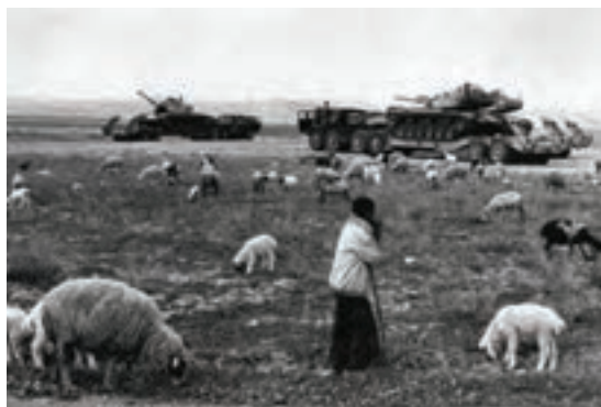
چرای گوسفند و بز در زمان دفاع مقدس

حرکت دسته‌جمعی گله گوسفند و بز در مناطق خاکی یا جاده‌های خاکی باعث ایجاد گرد و غبار و سرفه شدید دام می‌شود. بنابراین دام‌ها را از مناطقی حرکت دهید که فاقد گرد و غبار باشد یا آنها را در دسته‌های کوچک هدایت کنید، زیرا تنفس گرد و غبار سبب بیماری‌های تنفسی در انسان و دام می‌شود.