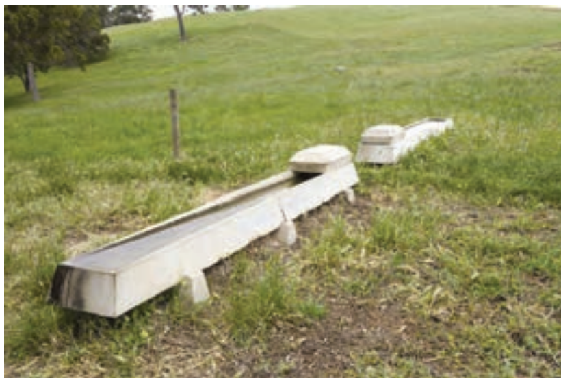
توزیع آبشخور در چراگاه