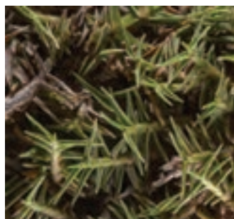
گیاه آلروپوس لیثورالیس

چند نمونه از گیاهان خوش خوراک مورد چرای بز