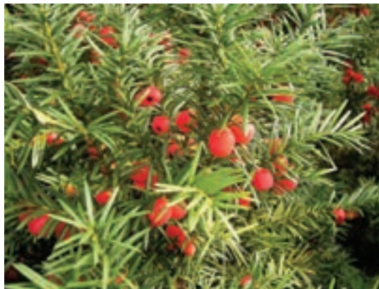
گیاه سرخدار: کشنده ترین گیاه سمی برای گوسفند است.

علوفه مراتع در محدوده مراکز صنعتی و به ویژه کارخانه های پالایش مواد شیمیایی ممکن است آلوده به فاضلاب مواد سمی باشد و موجب مسمومیت در گوسفند و بز شود.