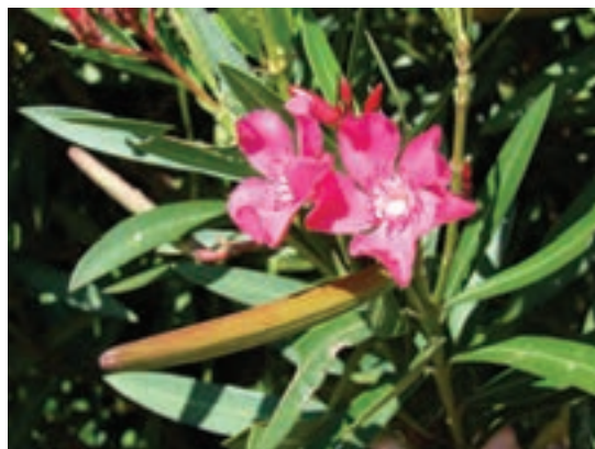
گیاه خرزهره: تمامی قسمت های آن ریشه تا گلبرگ برای انسان، گوسفند و بز بسیار سمی و کشنده است.

۴ چنانچه مقداری پودر استخوان به خوراک گوسفند و بز اضافه شود. تلفات ناشی از مسمومیت گیاهان سمی کاهش قابل توجه ای خواهد یافت.