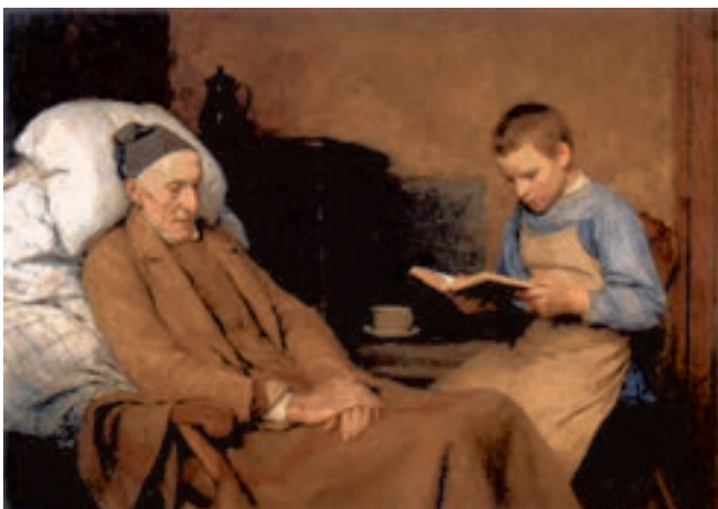
شکل ۲-۵- آلبرت آنکر، پیرمرد بیمار، ۱۸۹۳ م.، رنگ روغنی روی بوم، (۹۲ × ۶۳ سانتی متر)؛ ایجاد عمق فضایی با استفاده از تغییر درجه خلوص و تیرگی رنگ

۲- تغییر رنگ و تیرگی: در این روش برای نمایش دوری و نزدیکی اشکال و اشیا از تغییر رنگ آن‌ها در فاصله دور نسبت به رنگ همان اشیا در فاصله‌ی نزدیک و تغییر تیرگی - روشنی استفاده می‌شود. به این ترتیب که شدت و درجه‌ی خلوص رنگ در فاصله‌ی دور کاهش یافته و به خاکستری می‌گراید. به همین نسبت شدت تیرگی شکل‌ها و رنگ‌ها در فاصله‌های دور کاهش می‌یابد (شکل ۲-۵).