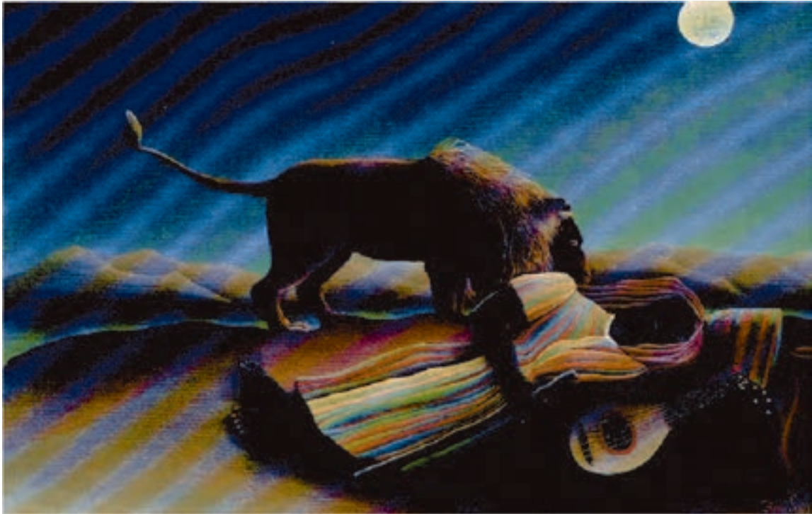
شکل ۱۳-۵- هانری روسو، کولی خفته، ۱۸۹۷م. رنگ روغنی روی بوم، (۲۰۰/۷ × ۱۲۹/۵ سانتی‌متر)؛ در آثار هانری روسو نیز عموماً فضای وهمی بر اساس روابط نامأنوس میان عناصر جهان واقعیت شکل می‌گیرد.