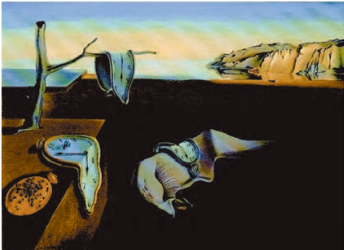
شکل ۱۴-۵- سالوادور دالی- پایداری حافظه، ۱۹۳۱م. رنگ روغنی روی بوم، (۲۴/۱ × ۳۳ سانتی‌متر)؛ در آثار نقاشان سوررئالیست ایجاد فضای وهمی بر اساس خواب‌ها و تصورات ضمیر ناخودآگاه صورت می‌گیرد.