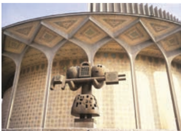
▲ شکل ۹-۱۴ هـ- تئاتر شهر، تهران، علی سردار افخمی