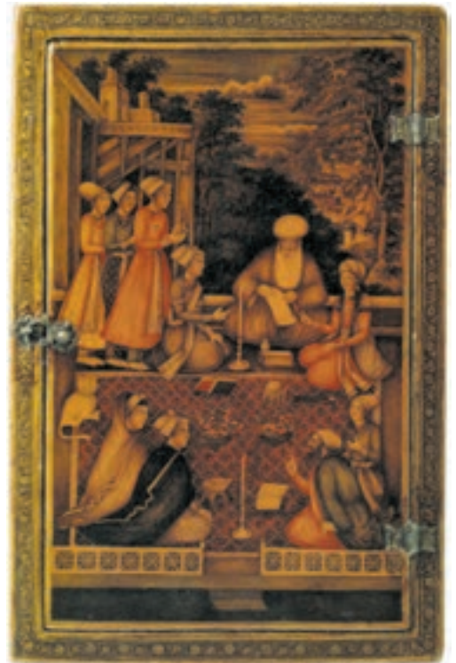
▶ شکل ۵-۱۳- قاب آینه، نقاشی لاک‌ی روغنی