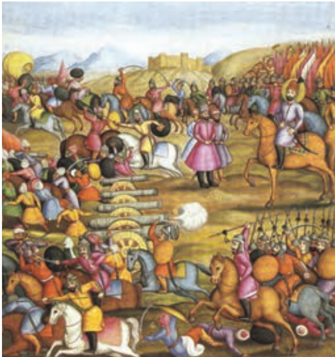
▲ شکل ۱-۱۳-ب - تصویری از کتاب تاریخ جهانگشای نادری (جنگ نادر با اشرف افغان)، ۱۱۷۱ هـ