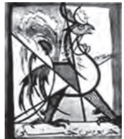
▲ شکل ۷-۱۴- نشانه انجمن خروس جنگی

تحول سنت‌گرایی در این دوره و نوعی توجه به ارزش‌های سنتی ایرانی باعث شد تا زمینه‌های فعالیت بیشتری در عرصه‌های هنری ایجاد شود. این تمایل باعث ایجاد نوعی فعالیت