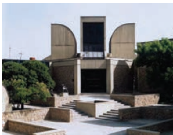
▲ شکل ۹-۱۴ د- موزه هنرهای معاصر، تهران، کامران دیبا