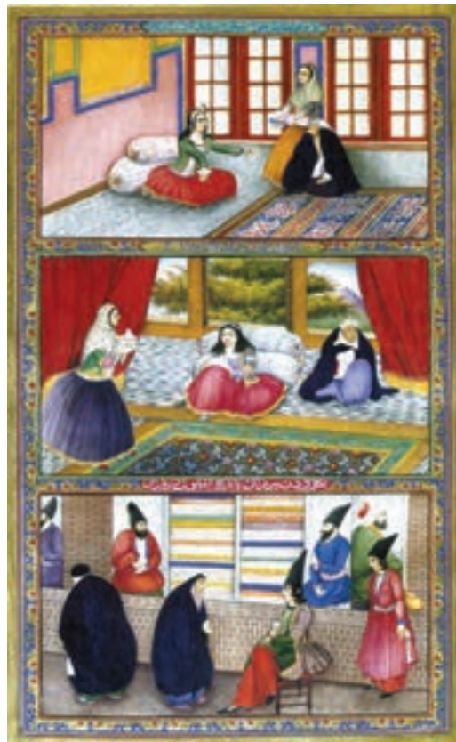
شکل ۱۲-۱۳- الف- برگی از کتاب هزار و یک شب، صنیع الملک، دوره قاجاریه