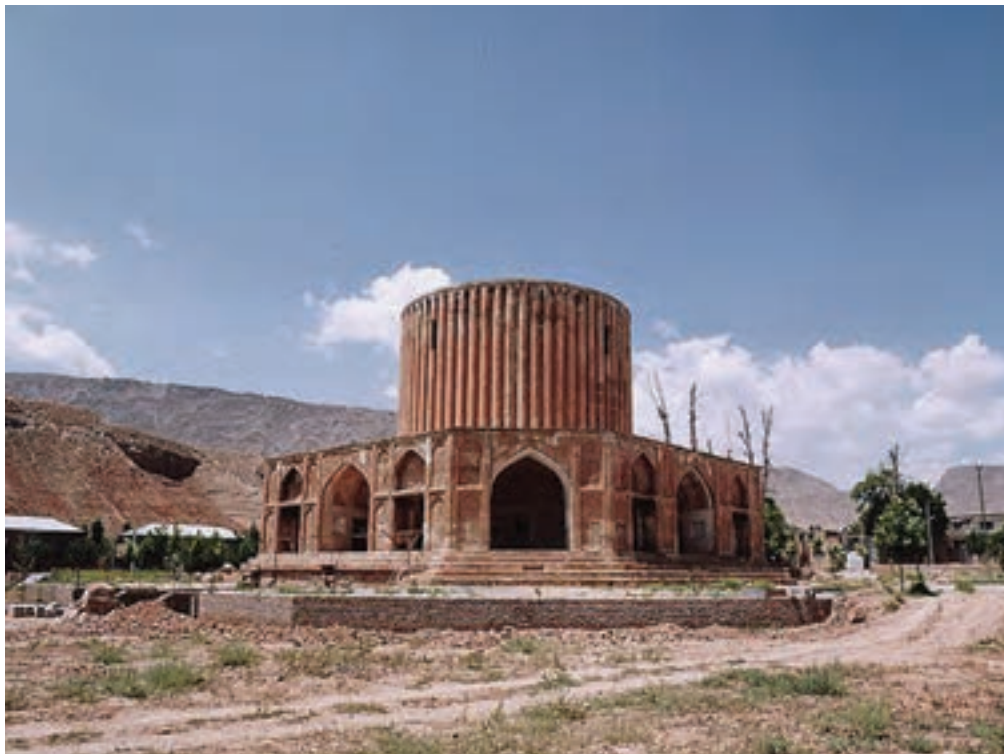
▲ شکل ۲-۱۳-کلات نادری، دوره افشاریه، خراسان