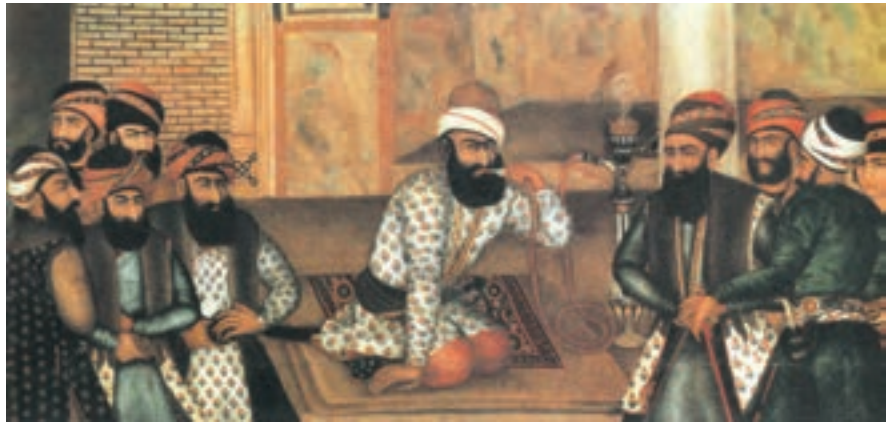
▶ شکل ۴-۱۳- نقاشی رنگ و روغن از چهره کریمخان زند

نقاشی‌های دوره زندیه که به «مکتب گل» شهرت یافته در بردارنده جنبه‌های مختلف با موضوعات متنوع و همچنین در بردارنده نقاشی‌های رنگ و روغنی با ابعاد بزرگ، نقاشی‌های لاک‌ی و روغنی و گل و مرغ می‌باشد (شکل ۴-۱۳). تحول اساسی در این دوره را بیشتر می‌توان در شیوه‌های جدید هنری به ویژه نقاشی بر اشیاء مختلف از جمله قاب آینه، صندوقچه‌های جواهر و ... دید (شکل ۵-۱۳).