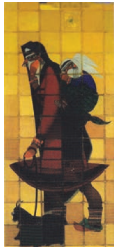
▲ شکل ۸-۱۴- زن قوچانی، جلیل ضیاءپور، رنگ و روغن روی بوم