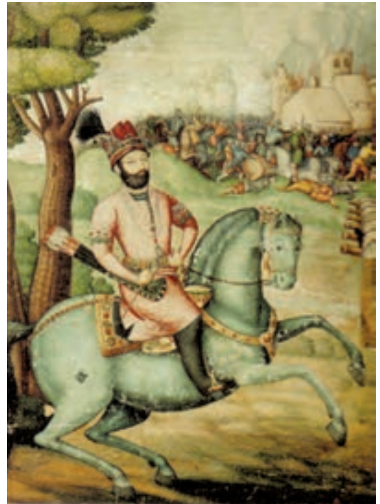
▲ شکل ۱-۱۳-الف - نادرشاه افشار، اثر علی بن عبدالبیگ علی قلی جبه دار