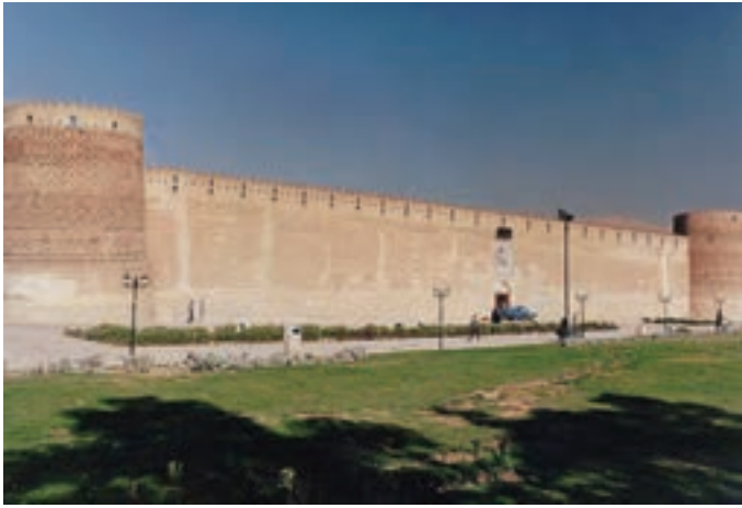
▲ شکل ۳-۱۳- ارگ کریمخان، شیراز

بنابراین زندیه با حفظ میراث هنری دوره صفویه با وجود اندک زمان حضور این سلسله توانست ویژگی‌های منحصر به فرد و خاصی را در هنر پدید آورد که در زمینه نقاشی، معماری و دیگر هنرها، شاخص باشد (شکل ۳-۱۳).