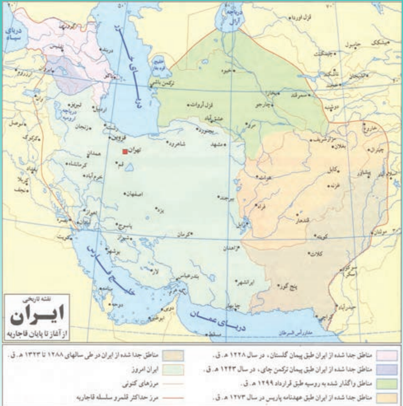
▲ نقشه ایران، دوره قاجاریه تا معاصر