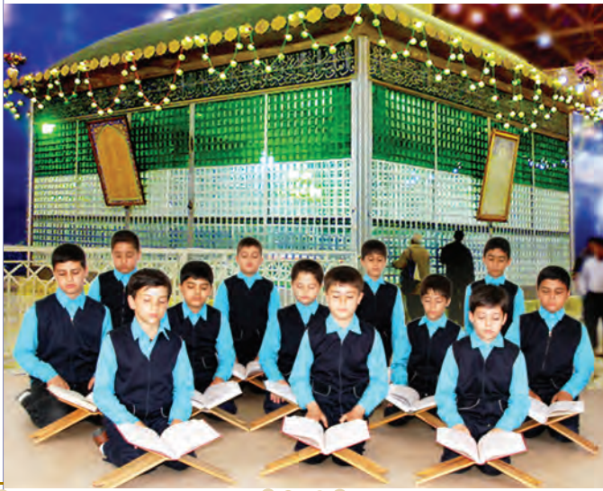
انس با قرآن کریم (استان تهران، شهری، حرم امام خمینی)

از نمازخانه یا دفتر مدرسه به تعداد کافی، قرآن به کلاس بیاورید؛ هر میز حداقل یک قرآن داشته باشد. با راهنمایی آموزگار به صورت تصادفی قرآن را باز کنید. سپس دانش آموزان هر میز، آیات آن دو صفحه را برای یکدیگر می خوانند. آن گاه هر دانش آموز حدود یک سطر را با صدای بلند می خواند.