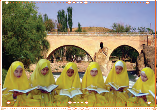
انسان با قرآن کریم در استان چهارمحال و بختیاری