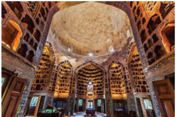
تالار چینی خانه، اردبیل