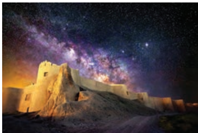
ارگ تاریخی بلقیس، خراسان شمالی