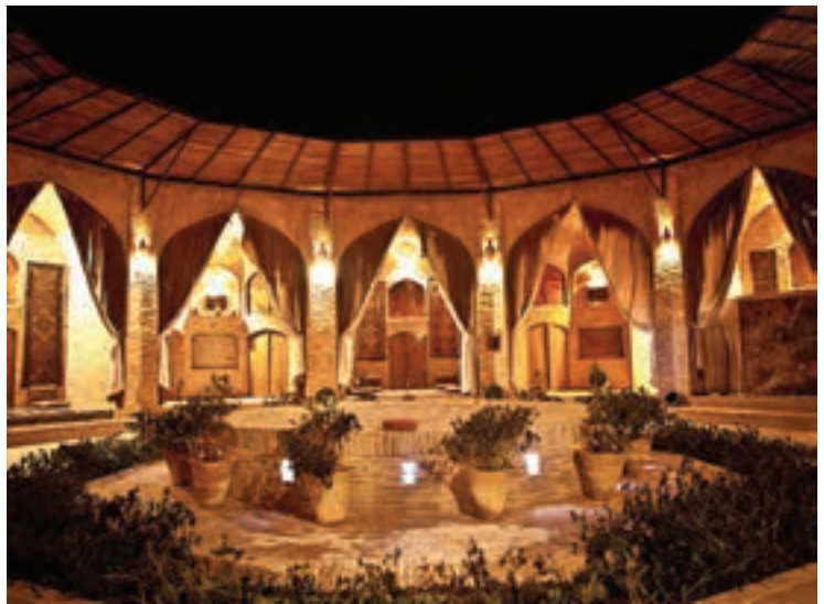
کاروان سرای زین الدین (نمای درونی، شب)، یزد