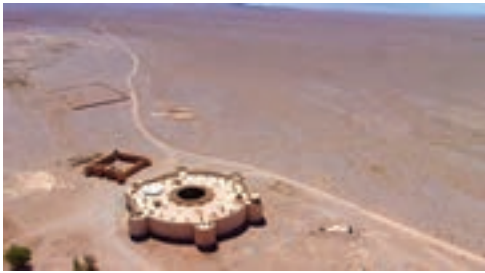
کاروان سرای زین الدین (نمای بیرونی)