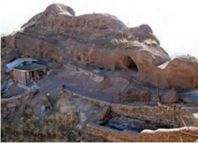
قلعه الموت، قزوین