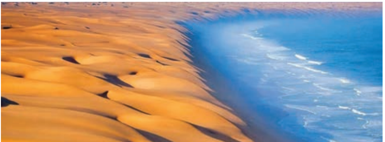
به هم رسیدن دریا و کویر، روستای درک، سیستان و بلوچستان