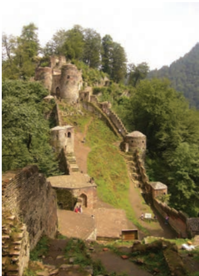
قلعه رودخان، استان گیلان