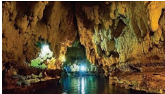
غار علیصدر، همدان