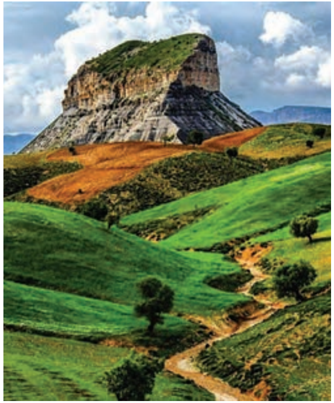
کوه قلاقیران، ایلام