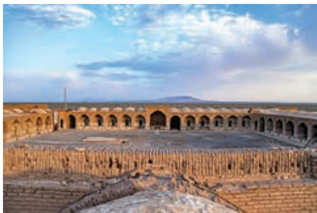
کاروانسرای دیر گجین، قم