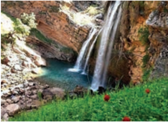
آبشار شوی، خوزستان