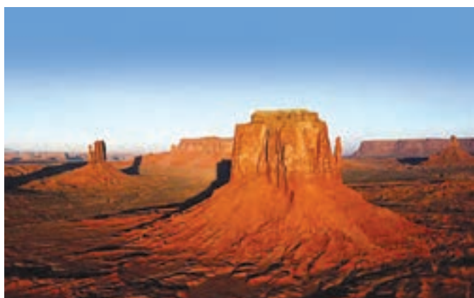
کلوت شهداد، از قطب‌های گرمایی زمین، کرمان