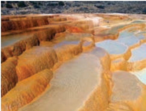
چشمه های پلکانی باداب سورت، مازندران