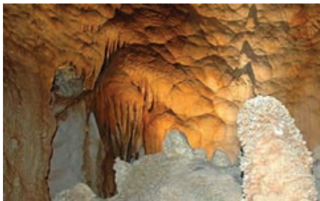
غار چال نخجیر، مرکزی