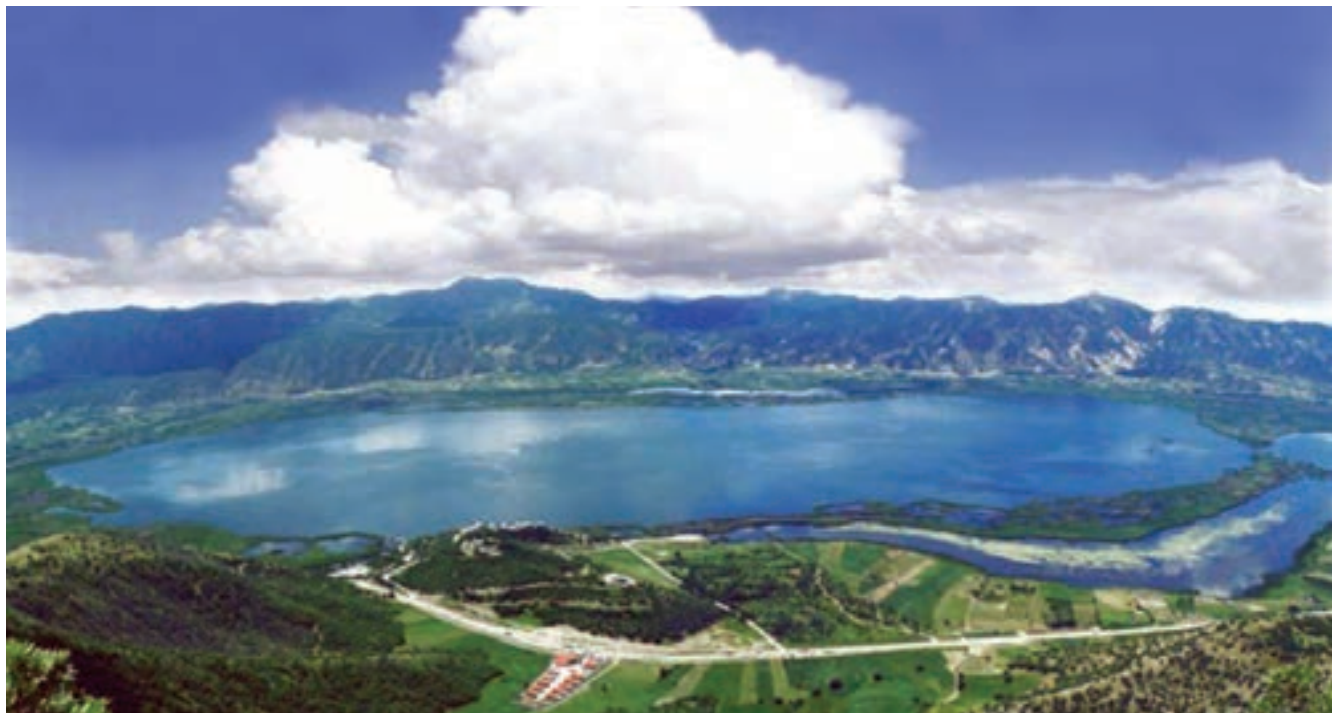
دریاچه زریبار، کردستان