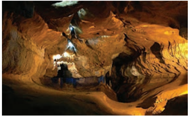
غار پر آو، کرمانشاه