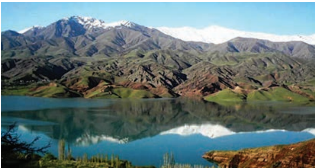
منطقه بیلاقی طالقان، البرز