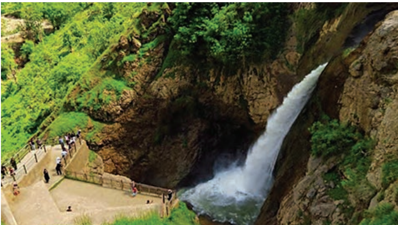
آبشار شلمانش، سردشت، آذربایجان غربی