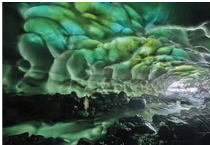
غار یخی چما، چهارمحال و بختیاری