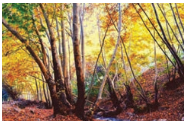
تنگ گنجه‌ای، کهگیلویه و بویراحمد