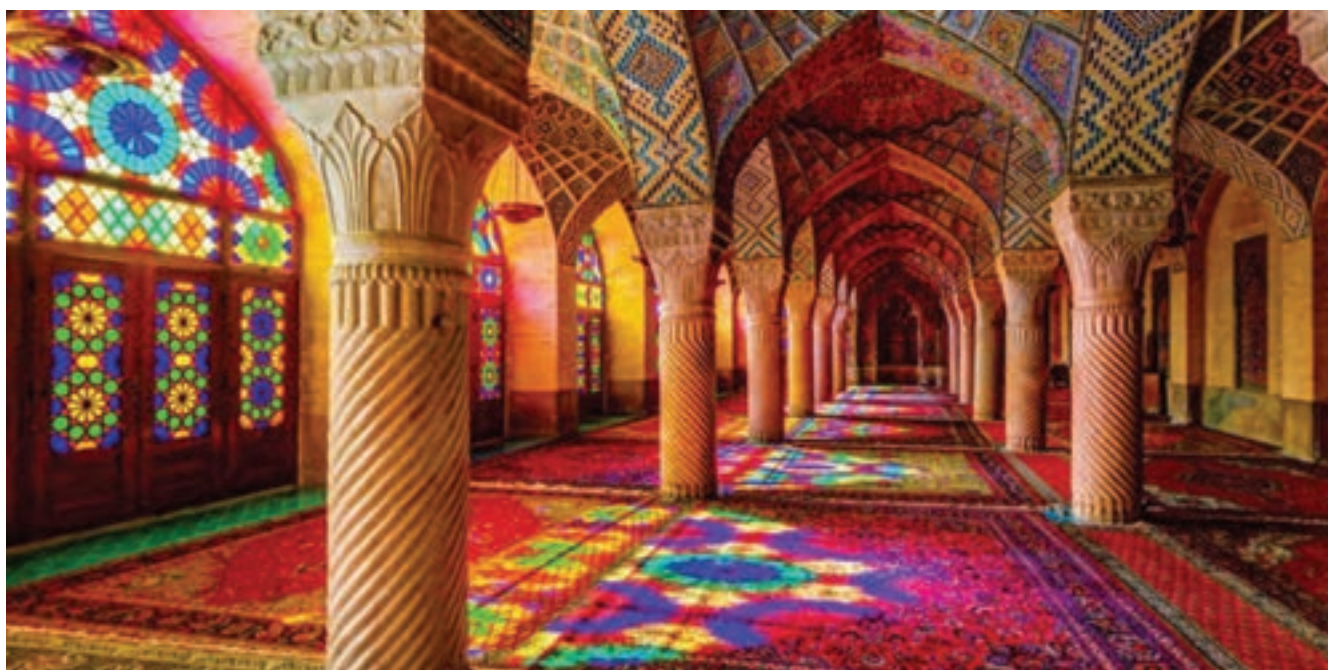
مسجد نصیرالملک، فارس