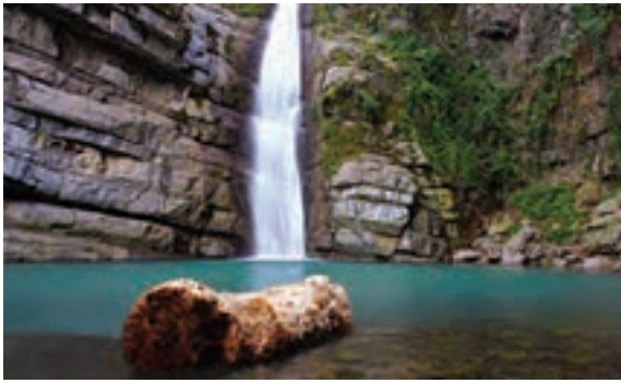
آبشار شیرآباد، گلستان