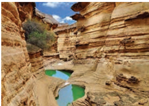
تنگه کریان، هرمزگان