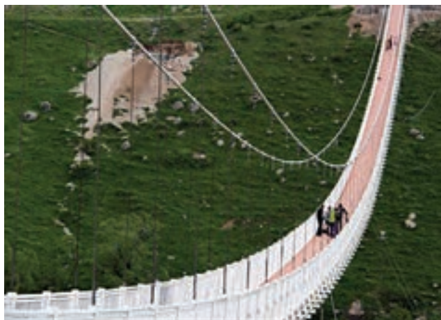
طولانی‌ترین پل معلق غرب آسیا، اردبیل