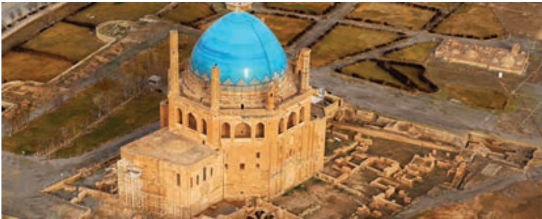
گنبد سلطانیه، زنجان