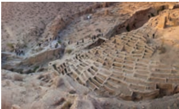
حوضچه‌های آب باران، بوشهر