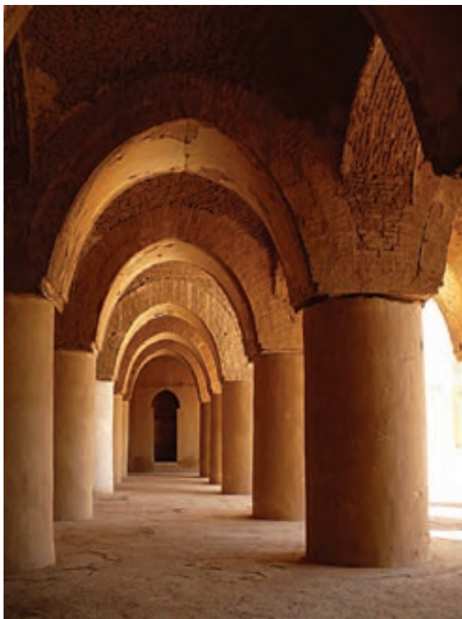
مسجد تاریخانه (ساخت بنای اولیه در ساسانیان)، سمنان