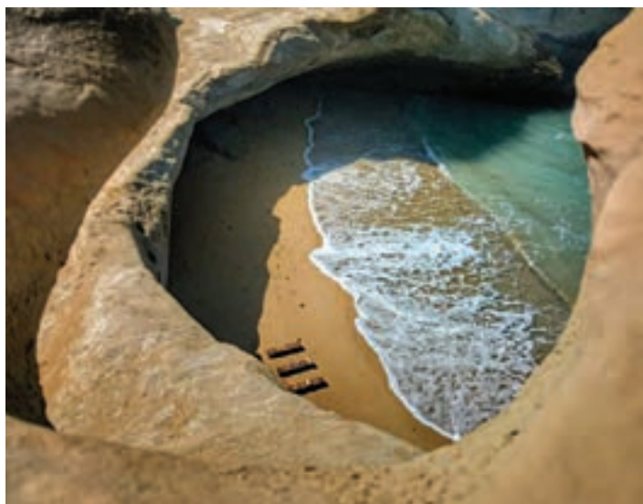
خلیج نای بند، بوشهر