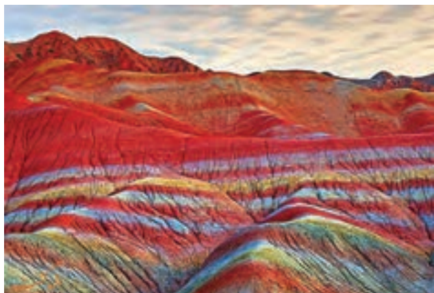
کوه‌ها و تپه‌های رنگی «آلداغ‌لار»، زنجان