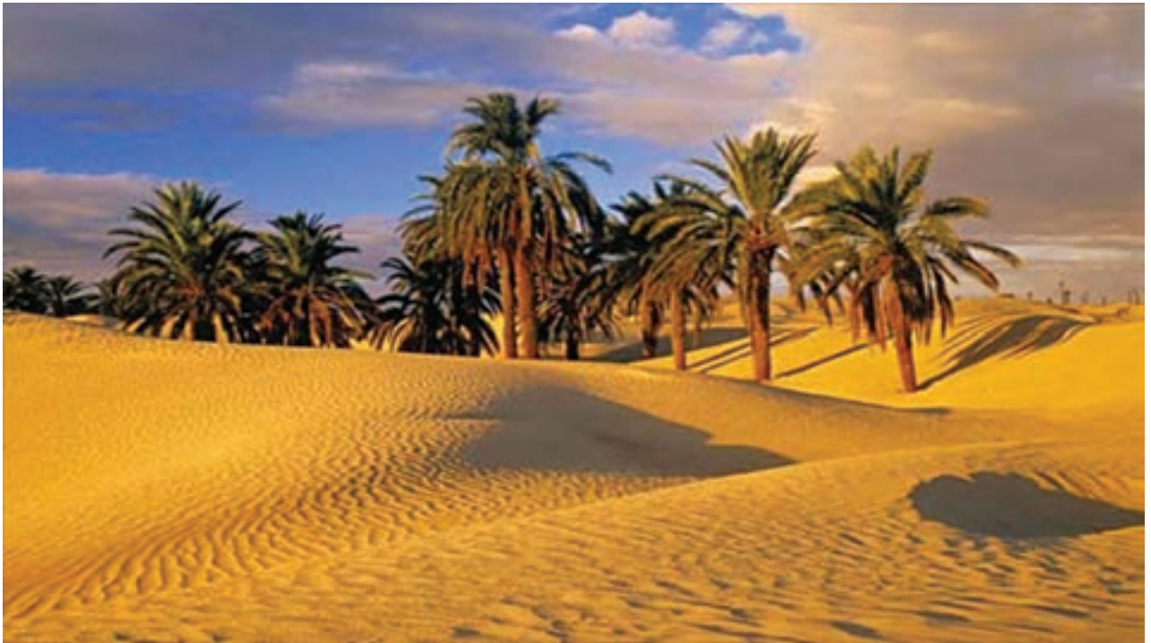
کوير حلوان، خراسان جنوبي