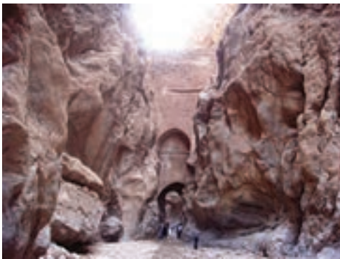
طاق شاه عباسی، قدیمی ترین سدقوسی جهان، خراسان جنوبی