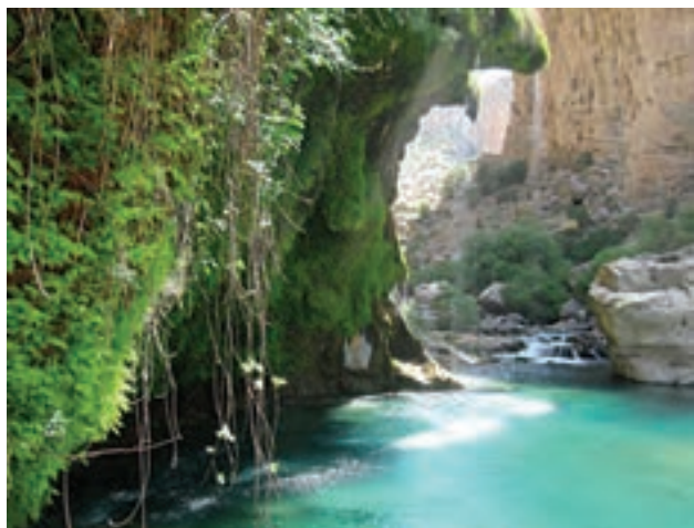
تنگ بستانک (بهشت گمشده)، فارس