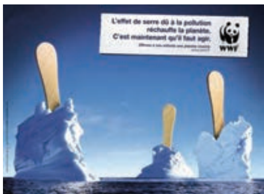
شکل ۲۵-۱- تبلیغ درباره گرمایش زمین و آب شدن یخ‌های قطبی