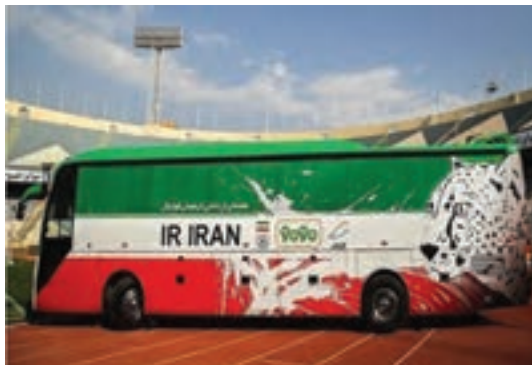
شکل ۱۵-۱- گرافیک محیطی - طراحی تبلیغاتی بر روی بدنه اتوبوس