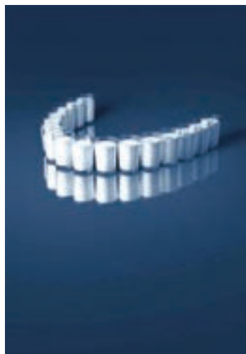
شکل ۳۵-۱- تبلیغ شیر با تأکید بر محافظت و استحکام دندان‌ها

طراحان صنعتی در طراحی انواع وسایل کاربردی زندگی روزمره (مانند صندلی، ابزار کار، وسایل صنعتی، خودروها و...) توجه ویژه‌ای به طراحی بر اساس بیونیک (طبیعت‌الگو) دارند.