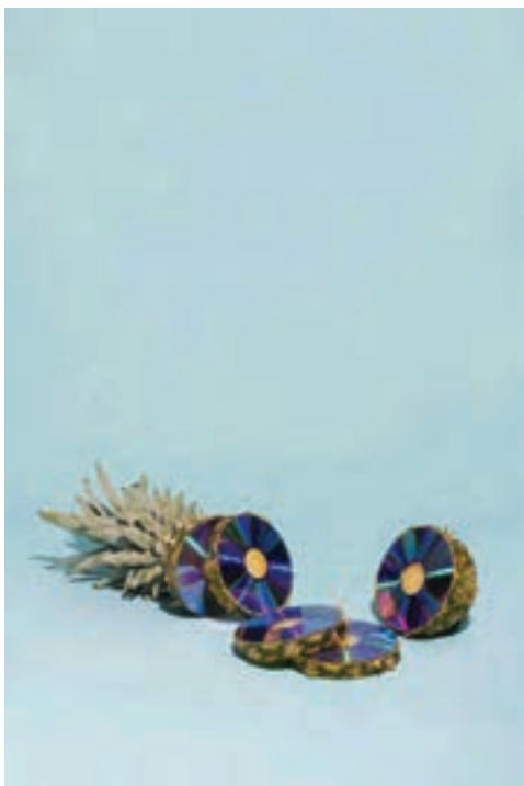
شکل ۳۰- تبلیغ سی دی با الهام از برش میوه