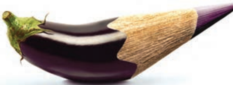
شکل ۲۳-۱- تبلیغ مدادرنگی با تأکید بر رنگ‌های طبیعی گیاهی