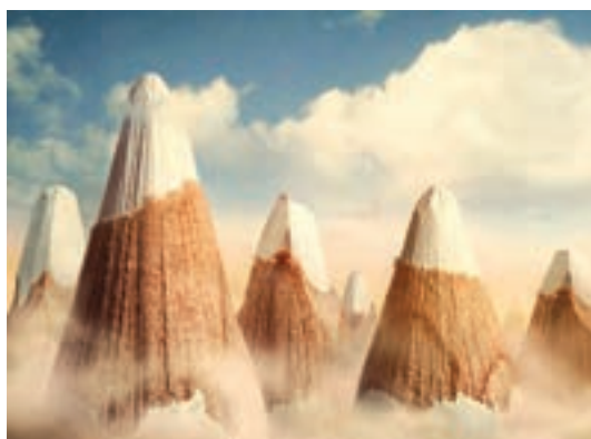
شکل ۲۴-۱- تبلیغ مدادرنگی با شبیه‌سازی به قله‌های پوشیده از برف