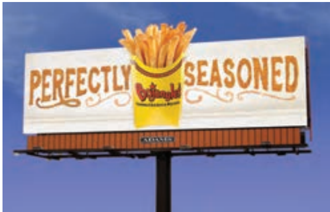
شکل ۱۲-۱- بیلبرد

به نظر شما هر یک از تصاویر صفحه قبل چه پیامی را انتقال می‌دهند؟ هر یک از پیام‌ها به چه شیوه‌ای ارائه شده‌اند؟ همهٔ مثال‌های صفحه قبل نمونه‌هایی از آثار گرافیک محیطی، مطبوعاتی، تبلیغات و عکاسی هستند. طراحان گرافیک و عکاسان با توجه به مهارت و توانایی که در زمینه شیوه‌های ارائه آثار خود دارند می‌توانند پیام‌های فرهنگی، هنری، تبلیغاتی، علمی و ... را به آسانی و با سرعت بیشتر به مخاطبان خود انتقال دهند. اکنون بار دیگر به نمونه‌های تصویری از همان نوع نگاه کنید و دربارهٔ هر یک در کلاس گفت‌وگو کنید.