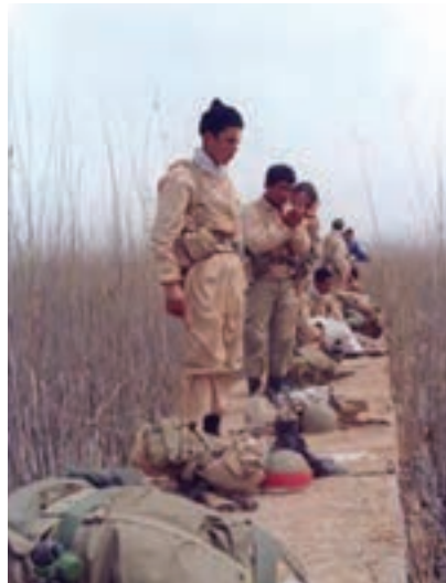
شکل ۱۳-۱- عکس خبری از دفاع مقدس