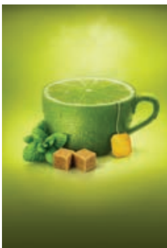
شکل ۲۷-۱- تبلیغ جای لیمو با بهره‌گیری از شکل طبیعی میوه