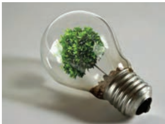
شکل ۱۹-۱- تصویر با موضوع انرژی‌های پاک

همچنین «بیودیزاین» نوعی از طراحی است که بر مبنای واقعیت‌های موجودات زنده در طبیعت صورت می‌گیرد. این الگوبرداری‌ها از طبیعت و موجودات آن زمینه گسترده‌ای را برای آفرینش‌های هنری در آثار هنرمندان در شاخه‌های گوناگون هنر پدید آورده است، علاوه بر آن، این گونه الگوبرداری از طبیعت، سبب می‌شود که نوع نگاه به طبیعت عمیق‌تر و دقیق‌تر شود و تمرین بسیار مؤثری است برای خوب دیدن و دقیق شدن در جلوه‌های آفرینش. در الگوبرداری از طبیعت، می‌توان آثار خلاقانه و ابتکاری را با محصولات گرافیکی طراحی کرد که سبب جلب توجه بیشتر محصول و یا کاربردی‌تر شدن آن در زندگی روزمره باشد.