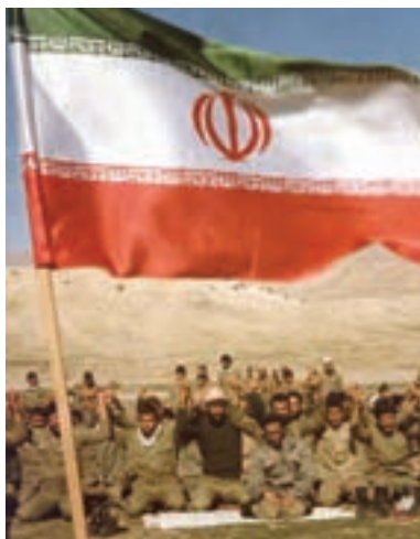
شکل ۱-۸- عکس خبری