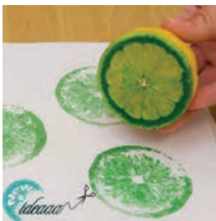
شکل ۲۶-۱- چاپ مستقیم با برش میوه