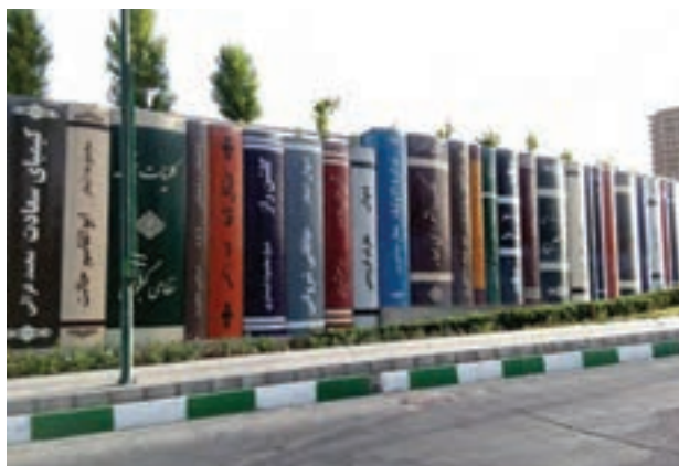
شکل ۱-۹- گرافیک محیطی