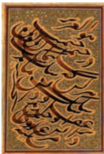
شکل ۱۶-۱- خوش نویسی