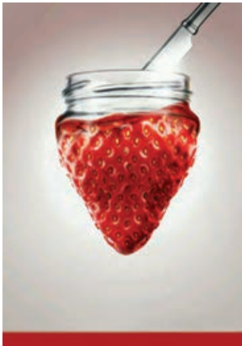
شکل ۳۳-۱- تبلیغ مواد غذایی با الهام از شکل طبیعی میوه