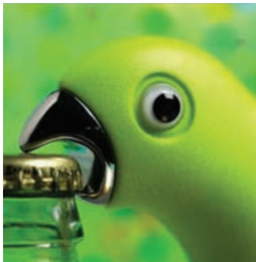
شکل ۲۱-۱- دربازکن بطری با الهام از منقار پرنده