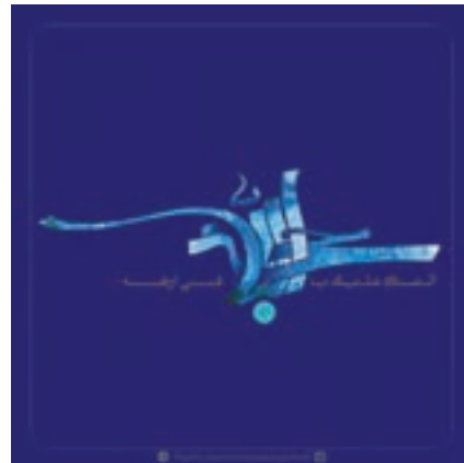
شکل ۱۱-۱- تایپوگرافی