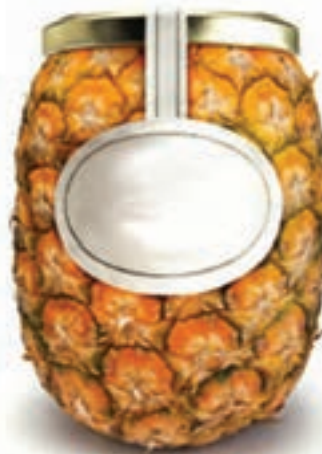
شکل ۲۲-۱- بسته‌بندی ظروف مربا با الهام از شکل طبیعی میوه‌ها