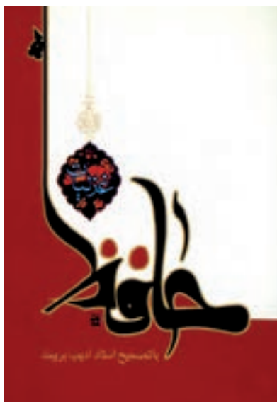
شکل ۱-۱- جلد کتاب