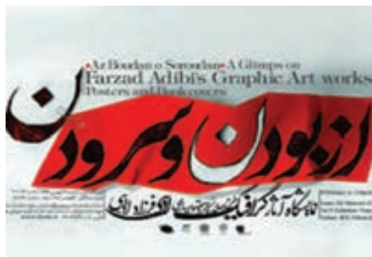
شکل ۱۸-۱- جلد کتاب