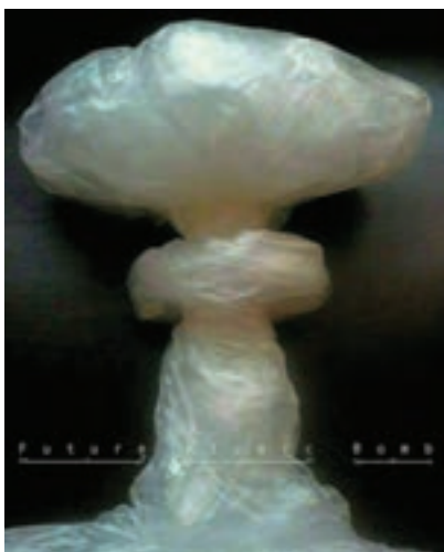
شکل ۳۶-۱- پوستر با موضوع فاجعه زیست محیطی استفاده بی‌رویه از پلاستیک