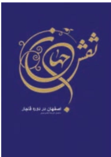
شکل ۱-۴- پوستر