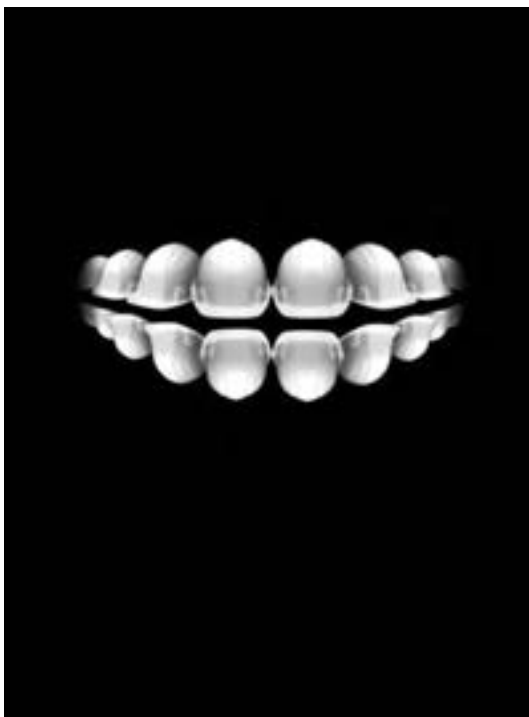
شکل ۲۹- تبلیغ خمیردندان با تأکید بر محافظت از دندان‌ها همچون کلاه ایمنی