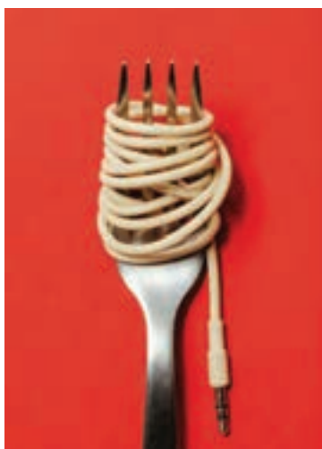
شکل ۲۸-۱- شباهت سیم به رشته ماکارونی