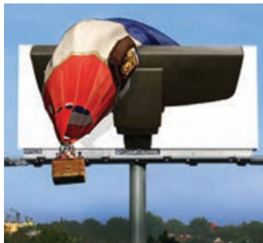
شکل ۱-۷- بیلبرد