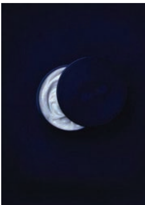
شکل ۳۲- تبلیغ کرم مخصوص شب با الهام از شکل هلال ماه