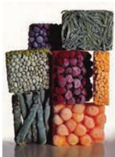
شکل ۱-۳- عکس تبلیغاتی