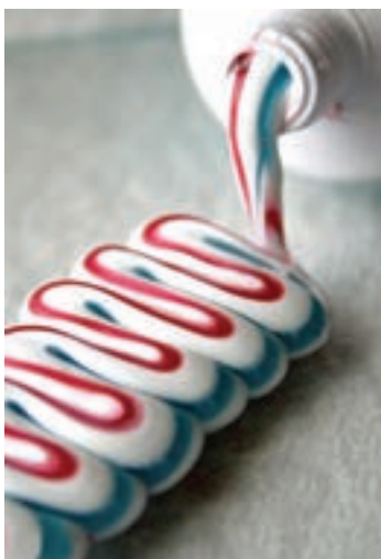
شکل ۱۷-۱- عکس تبلیغاتی