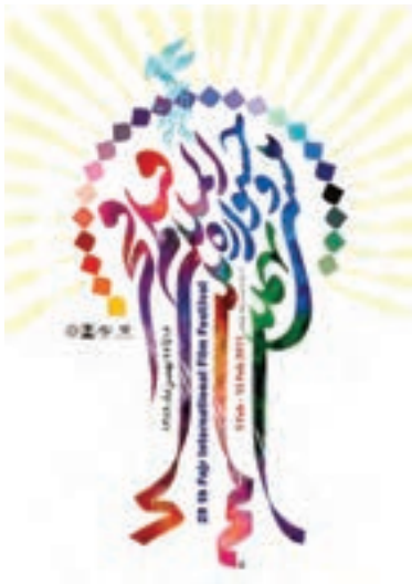
شکل ۱۴-۱- پوستر جشنواره فیلم فجر