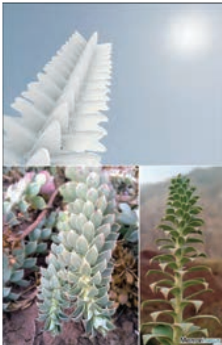
شکل ۳۴-۱- یک سازه معماری با الهام از شکل یک گیاه