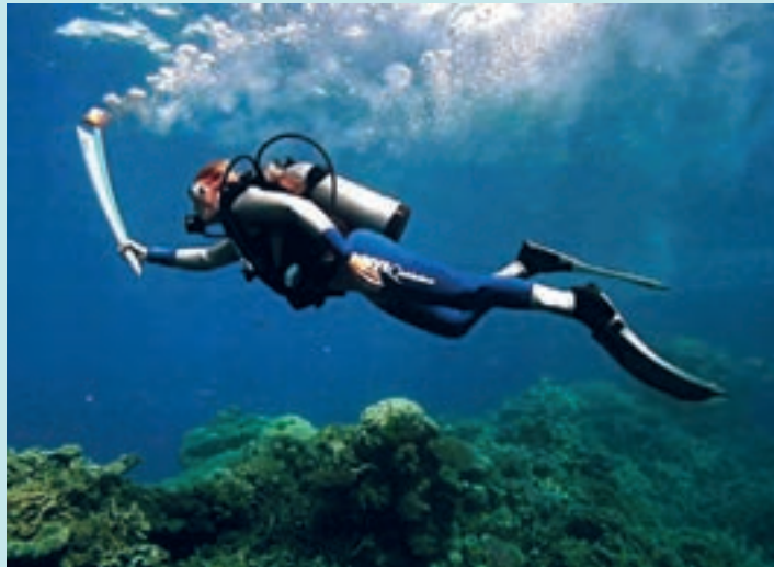
شکل ۲۴-۱- مشعل المپیک زیرآب

با کمک هم کلاسی خود انواع حمل مشعل در المپیک تابستانی را در کلاس نشان دهید. (۵ مورد) مشعل بازی‌های المپیک زمستانی هم برای نخستین بار در بازی‌های المپیک ۱۹۵۲ اسلو در استادیوم المپیک روشن شد در طی بازی‌های تابستانی و زمستانی و در آیین افتتاحیه مشعل‌دان استادیوم المپیک با این مشعل روشن شده و در روز اختتام بازی‌ها بعد از ۱۵ روز تا دور بعدی المپیک خاموش می‌شود.