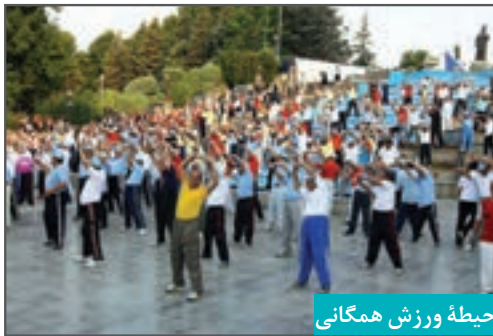
حیطه ورزش همگانی