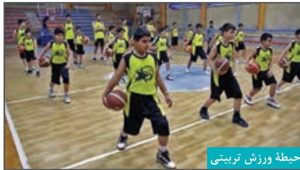
حیطه ورزش تربیتی