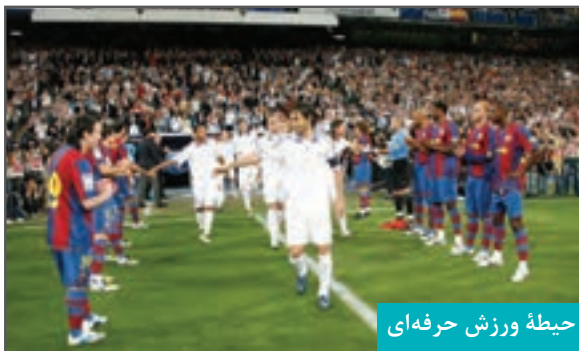
حیطه ورزش حرفه‌ای