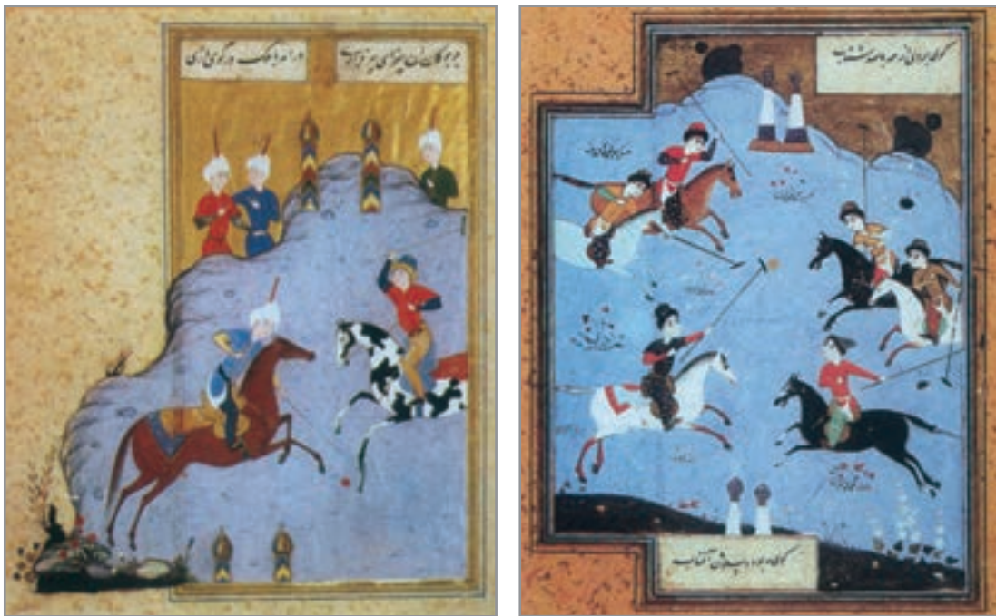
شکل ۱۵-۱- ورزش ایران در دوران پس از اسلام