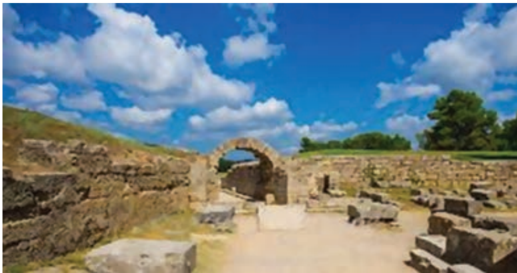
شکل ۱۷-۱- دشت المپیا

بازی‌های المپیک باستانی ۲ میراثی از تمدن باستان است که آغاز رسمی آن به سال ۷۷۶ پیش از میلاد مسیح و پیش از عصر طلایی یونان باز می‌گردد.