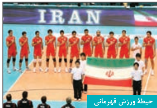
حیطه ورزش قهرمانی