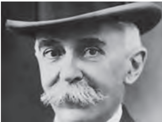
شکل ۱۸-۱- پیردوکوبرتن تاریخ‌دان، مورخ و آموزگار و بنیان‌گذار بازی‌های المپیک نوین است.