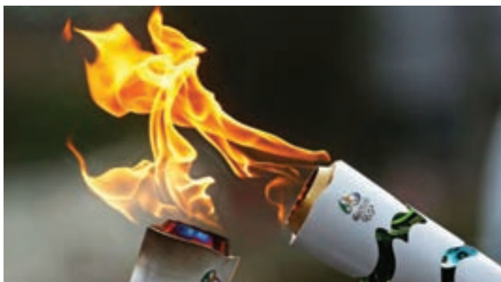
شکل ۲۳-۱- مشعل المپیک زمستانی