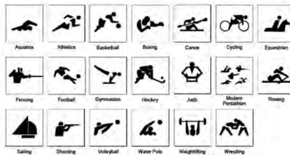
شکل ۲۱-۱- مقایسه پیکتوگرام‌ها