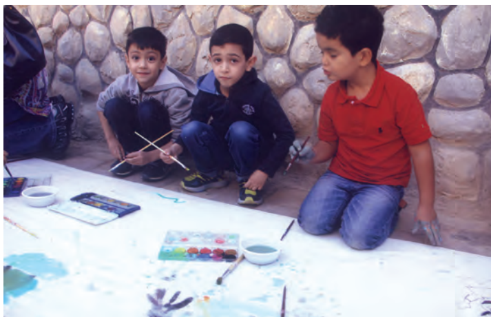
شکل ۱۲- نقاشی گروهی کودکان

۸ گردش علمی: این روش برای مهارت‌های مربوط به شناخت محیط مؤثر است. در این روش علاوه بر شناخت محیط، با افراد گوناگون آشنا می‌شود و راه‌هایی برای برقراری ارتباط مناسب با دیگران می‌آموزد. در این زمینه می‌توانید گردش‌های علمی زیر را برای کودکان تدارک ببینید (شکل ۱۳):