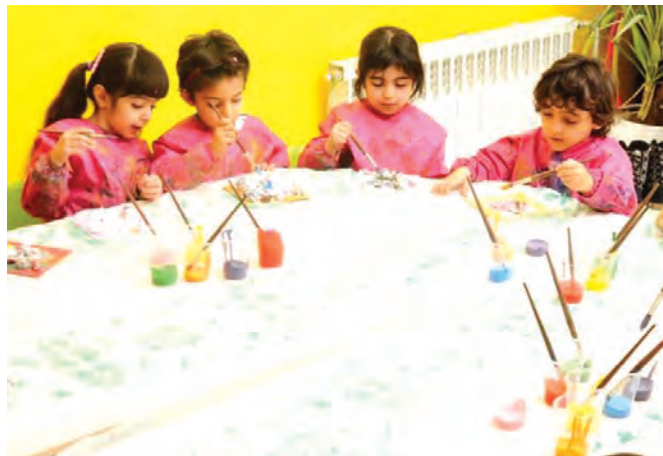
شکل ۱۸- مشارکت در انجام یک فعالیت گروهی

فعالیت ۳۲: به نظر شما برای موفقیت در والیبال هنرستان هر کدام از بازیکنان برای مشارکت گروهی مطلوب چه اصولی را باید رعایت کنند؟ با دوستان خود در این مورد گفت‌وگو کنید و نتیجه را در کلاس ارائه دهید.