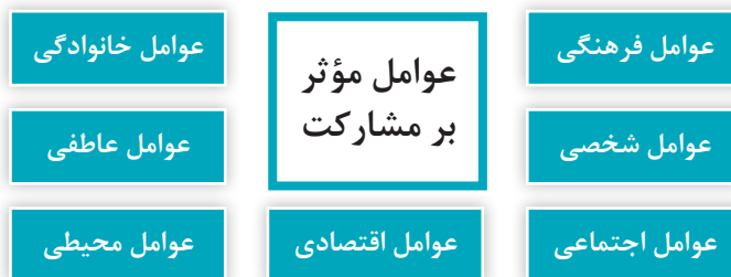
نمودار ۳- عوامل مؤثر بر مشارکت

یکی از عوامل فرهنگی روبه گسترش در اکثر جوامع، استفاده از ابزارهای مختلف فناوری ارتباطات و اطلاعات و ارتباط در دنیای مجازی است که بر میزان مشارکت مربی با کودک تأثیر می‌گذارد.