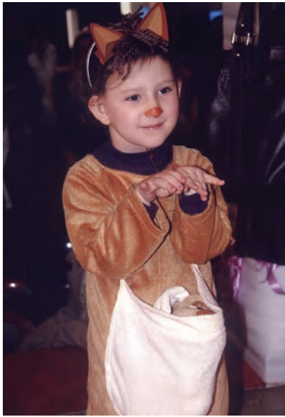
شکل ۹- شعرخوانی کودک