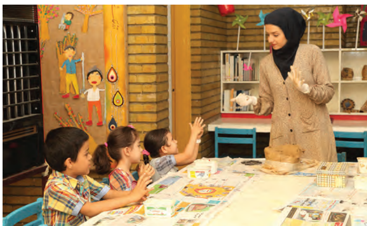
شکل ۱۹- فعالیت مشارکتی مربی با کودکان

۶ برنامه‌ریزی برای کودکان در انجام امور مرکز یا کلاس: دادن فرصت به کودکان در انجام امور مختلف کلاس می‌تواند باعث برانگیختن آنها برای مشارکت در فعالیت‌های آموزشی شود برای مثال برنامه‌ریزی برای برگزاری نمایشگاه‌ها، جشن‌ها و امثال آن (شکل ۱۹).