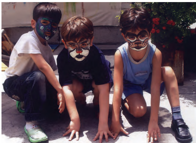
شکل ۸- نمایش کودکان

بعد از خواندن قصه می‌توان از کودکان خواست که نقش‌های قصه را وانمود کنند (ایفای نقش). این ایفای نقش به کودک کمک می‌کند علاوه بر شناخت خود و کاهش خود محوری، به درک و شناخت دیگران و احساسات آنها توجه کند. نمایش‌های کودکان با تعاون و همکاری همسالان او و نظارت مربی صورت می‌گیرد. فعالیت‌های پیشنهادی زیر در این زمینه می‌تواند مؤثر باشد: