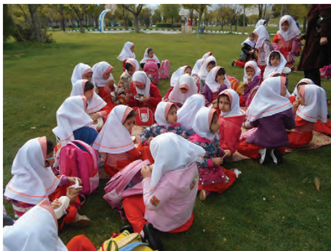
شکل ۱۳- گردش علمی کودکان