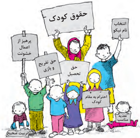
شکل ۲۰- حقوق کودکان در اسلام

اینکه این حمایت‌ها از حقوق کودکان، زمانی مطرح شده که هیچ نهاد، سازمان یا کنوانسیون بین‌المللی برای دفاع از حقوق کودکان وجود نداشته است. اسلام با در نظر گرفتن همه نیازهای اولیه جسمی، روحی و روانی کودکان و دفاع از آن، زمینه را برای رشد و پیشرفت آنان در همه جنبه‌ها فراهم آورده است (شکل ۲۰) از جمله این حقوق می‌توان به موارد زیر اشاره کرد: