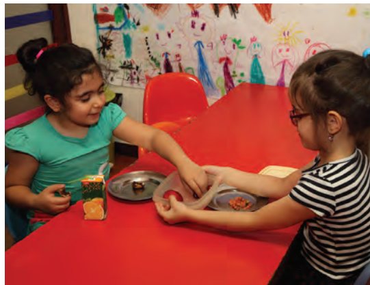
شکل ۲- مهارت‌های اجتماعی کودک

فعالیت ۶: در گروه‌های کلاسی در مورد پیام‌های شکل ۲ و عوامل مؤثر در ارتباط کودک با کودک گفت‌وگو کنید و نتیجه را در کلاس ارائه دهید.