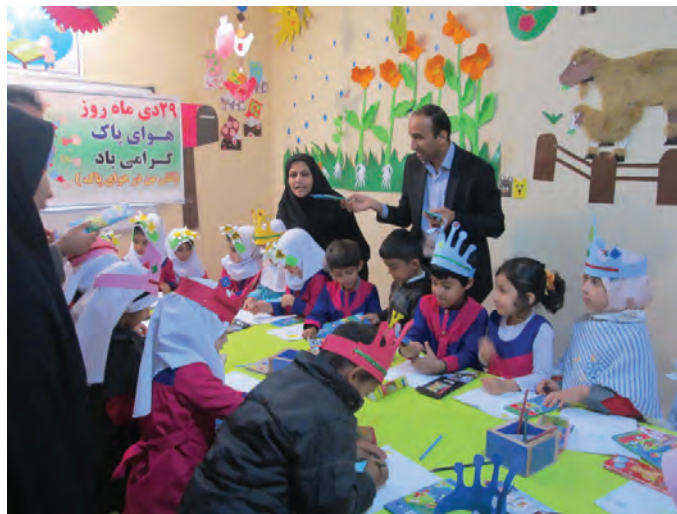
شکل ۱۶- مشارکت مربی با کودکان

بسیاری از کارشناسان و اندیشمندان و متفکران کشورمان به این نتیجه رسیده‌اند که حل بسیاری از معضلات جامعه جهانی با مشارکت سازمان‌ها و جوامع امکان‌پذیر است.