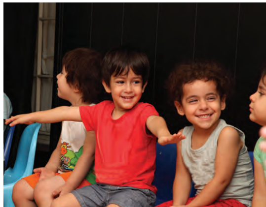
شکل ۱۵- بازی مشارکتی کودکان

فعالیت ۲۵: در گروه‌های کلاسی، هر کدام یک نمونه از فعالیت مشارکتی را که در گذشته تجربه کرده‌اید بیان کنید و دلایل رضایت و یا نارضایتی خود را از این فعالیت مشارکتی، در کلاس ارائه دهید.