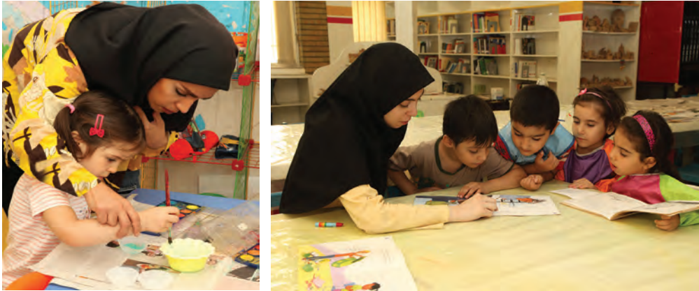
شکل ۱- ارتباط مربی با کودک

فعالیت ۱: در گروه‌های کلاسی با توجه به تصاویر بالا در مورد نقش ارتباط مربی با کودکان گفت‌وگو کنید و نتیجه را در کلاس ارائه دهید.