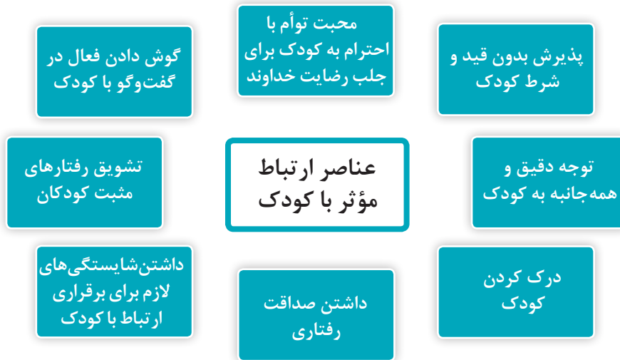
نمودار ۱- عناصر ارتباط مؤثر با کودک