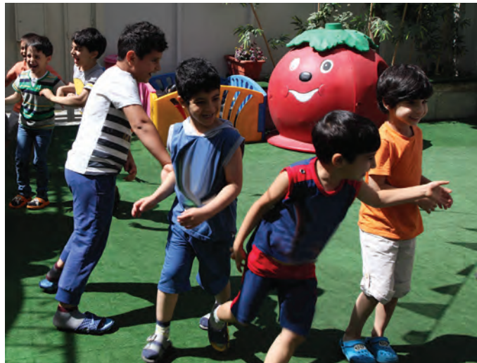
شکل ۱۰- بازی کودکان با یکدیگر