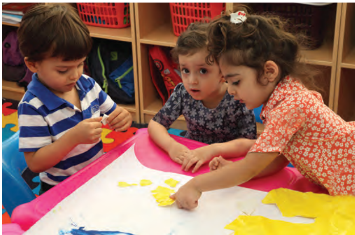
شکل ۱۱- درست کردن کاردستی

فعالیت ۲۰: در گروه‌های کلاسی با استفاده از وسایل دورریختنی عروسک درست کنید.