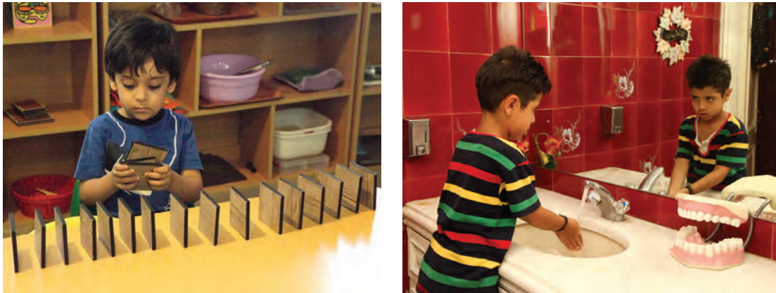
شکل ۳- مهارت‌های اجتماعی

می‌رساند و می‌تواند به نتایج مثبت متعددی شامل بندگی خدا، سازگاری، احساس شادزیستی و لذت منجر شود. مهارت‌های اجتماعی: مجموعه مهارت‌هایی هدفمند، جامعه‌پسند، قابل اندازه‌گیری، و آموختنی هستند که افراد را در فرایند ارتباط با دیگران یعنی شروع، ادامه و پایان دادن به ارتباطات بین فردی کمک می‌کنند. (شکل ۳).