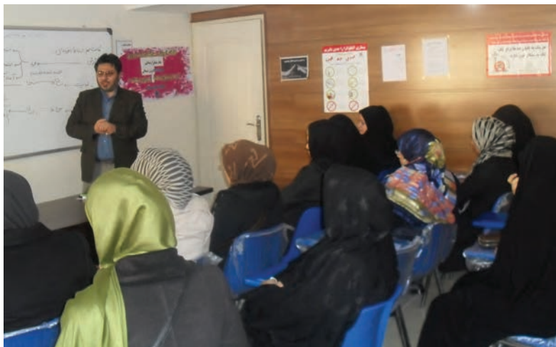
شکل ۲۱- برگزاری کارگاه آموزشی والدین

۴ کارگاه‌های آموزشی برای والدین، مربیان، و کلیه دست‌اندرکاران مرکز آموزشی توسط اساتید برگزار گردد (شکل ۲۱).