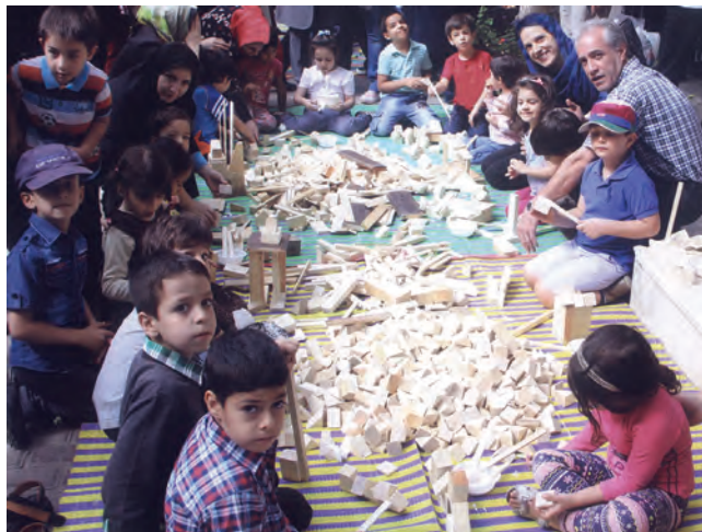
شکل ۱۷- فعالیت مشارکتی

۶ ت: تعادل در تقسیم کار: با تقسیم کار بین کودکان برای انجام فعالیت مشارکتی، شرح وظایف کودکان مشخص‌تر و تخصصی‌تر می‌شود، تداخل کاری به وجود نمی‌آید و توازن کار بین کودکان ایجاد می‌شود (شکل ۱۷).