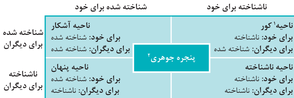
نمودار ۴- نواحی چهارگانه رفتارهای فرد در الگوی پنجره جوهری

را که دارید دست کم بگیرید و همه توانمندی‌های خود را هنوز نشناخته باشید یا رفتارهایی از کودکی در شما وجود داشته باشد ولی توجه کمی به آنها کرده‌اید. در ارتباط بین مربی با مراقب و مربی‌یار، هرچه رفتارهای آشکار آنها، بیشتر باشد، به همان اندازه تعارض‌ها و سوء تفاهم‌ها کاهش می‌یابند.