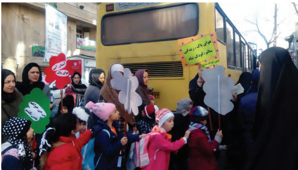
شکل ۳- ارتباط و مشارکت مربیان با همکاران

۳ ترتیب دادن اردوهای علمی، تفریحی و زیارتی با مشارکت همکاران: برگزاری اردوهای علمی، تفریحی، و زیارتی برای کودکان و مربیان و سایر کارکنان مرکز پیش از دبستان، به برقراری ارتباط صمیمی بین افراد منجر می‌شود و در نتیجه ارتباط و مشارکت نیز افزایش می‌یابد (شکل ۳).