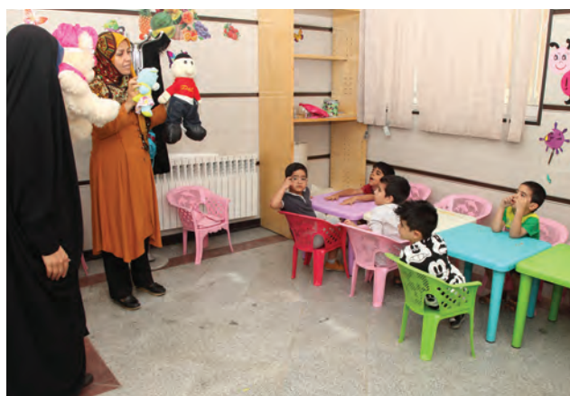
شکل ۴- نظارت مربی در مراکز پیش از دبستان

مربی‌یاران برای اجرای برنامه‌های کودکان باید یک محیط ایمن و بهداشتی متناسب با سن آنها فراهم کنند.