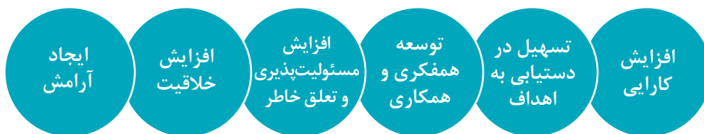
نمودار ۱- ضرورت ارتباط و مشارکت در مراکز پیش از دبستان

فعالیت ۴: در گروه‌های کلاسی فعالیتی مانند روز دانش‌آموز، برگزاری نمایشگاه و غیره را انتخاب کنید و در مورد تأثیر فعالیت‌های مشارکتی در برگزاری بهتر آنها گفت‌وگو کنید و نتیجه را به صورت یک پیام در تابلوی اعلانات ۱ ارائه دهید.