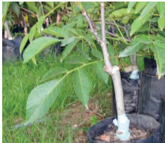
سمت راست گردوی پیوندی یکساله و سمت چپ نهال های بذری سوزنی برگ ها