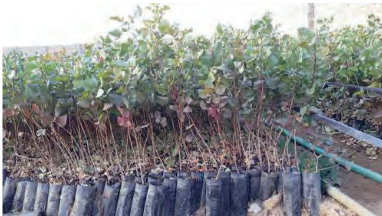
نهال‌های یکساله بذری پسته تهیه شده در داخل کیسه

نهالستان: به محلی گفته می‌شود که در آن، نهال‌های جوان پیوندی و غیر پیوندی و همچنین نهال‌های غیر مثمر، تولید و آماده انتقال به محل اصلی برای کاشت می‌شود. این محدوده (نهالستان) توسط یک کارشناس یا یک کاردان اداره می‌شود. نهال: درخت جوانی است که در مرحله قبل از تولید میوه قرار داشته و به وسیله یکی از روش‌های جنسی و یا غیر جنسی تکثیر می‌شود.