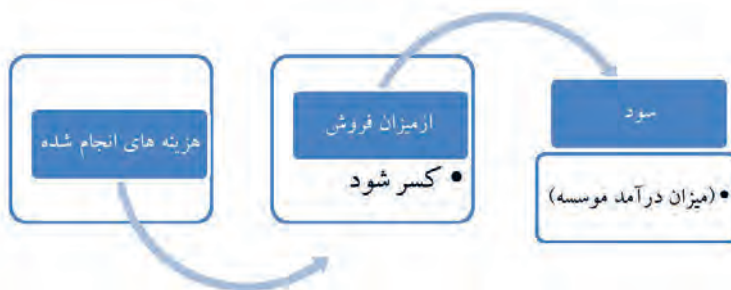
عوامل تعیین کننده سود و زیان یک مؤسسه در حالت کلی

در هر منطقه با توجه به شرایط خاص آب و هوایی، منابع آبی قابل دسترس و نوع خاک، اقدام به کشت گیاهان خاصی می شود. یک نهال کار حرفه ای باید اطلاعات جامع و کاملی از نوع درختان و ارقام مورد کشت و کار منطقه داشته باشد. در ضمن از ارقام و انواع جدید تازه معرفی شده به بازار نیز باید آگاه باشد تا بتواند در کوتاه ترین زمان ممکن نسبت به تکثیر و معرفی آن به بازار اقدام نماید. در بیشتر مناطق، نهال کارانی که توان تکثیر سریع ارقام مورد نیاز بازار را دارند منافع اقتصادی بالایی را به دست می آورند و ضمن کسب درآمد، در سطح منطقه به عنوان تولیدکننده موفق نیز شناخته می شوند.