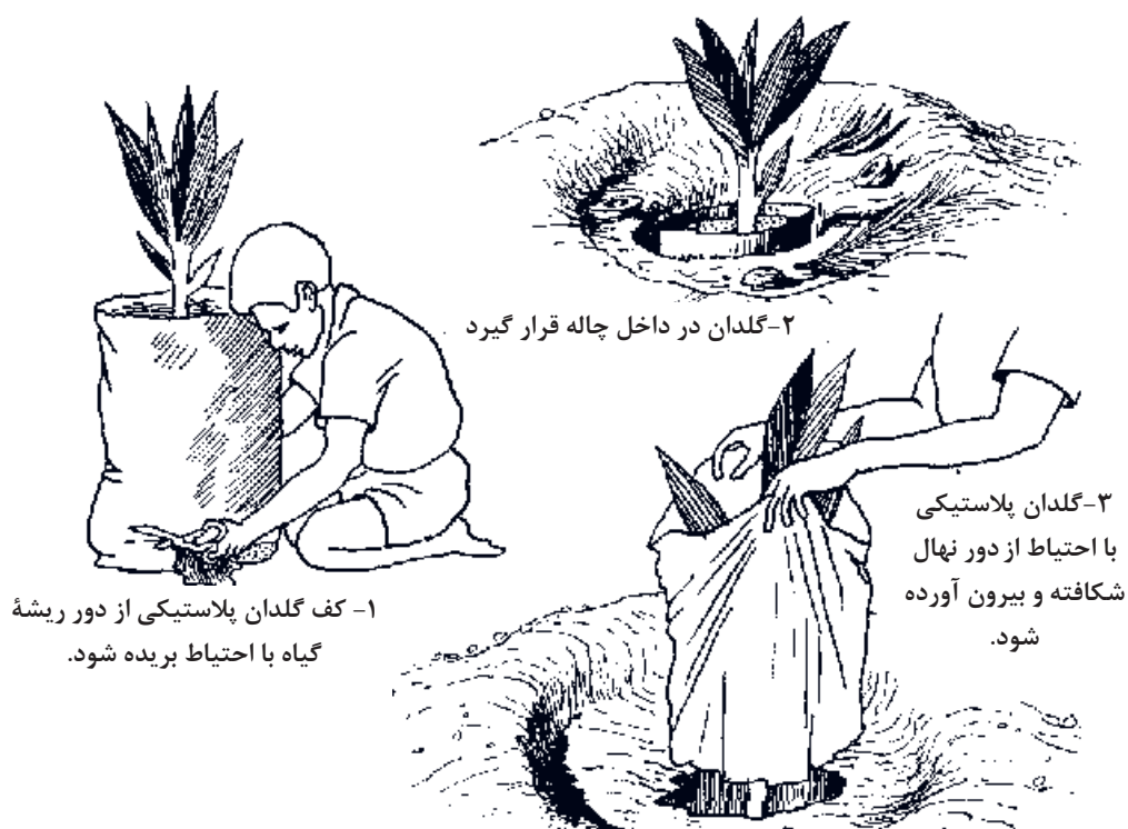
شرایط انتقال نهال‌های حساس گلدانی به چاله کاشت

ضمن اینکه این نکته را باید در نظر گرفت که در انتقال نهال به مناطق دور دست، باید مجوزهای لازم را از مدیریت حفظ نباتات محل فروش نهال مبنی بر دارا بودن سلامت کامل نهال‌ها از لحاظ آفات و بیماری‌های شایع تهیه نمود.