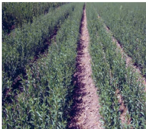
نهالستان بادام، هلو و شلیل