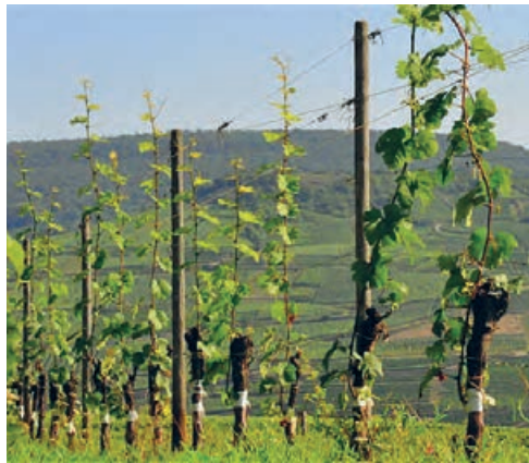
سمت راست انگورهای پیوندی کشت شده و سمت چپ یک نهالستان پیشرفته انگور