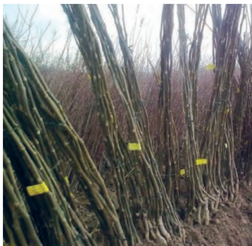
سمت راست نهال‌های کنده شده برچسب‌دار و سمت چپ نهال‌های برچسب‌دار در خزانه