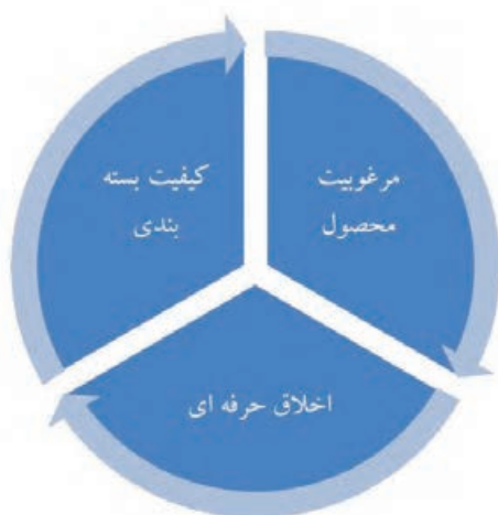
عوامل مؤثر در رضایتمندی مشتری

در هر کدام از حالات فوق، یک نهال فروش حرفه ای، نصب برچسب و مشخص نمودن نهال های قابل فروش را قبل از خارج کردن نهال از خزانه انجام می دهد. بنابراین در زمان بسته بندی، بارگیری و فروش، مشکلات زیادی نخواهد داشت. در حالت کلی بهتر است قبل از خارج کردن نهال از زمین، برچسب ضد آب مخصوص را که حاوی اطلاعات مربوط به نوع رقم، نوع پایه، نوع پیوندک و... می باشد را تهیه و بر روی ساقه، مقداری بالاتر از محل یقه نصب نمود.