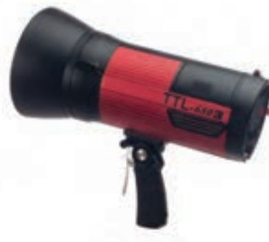
تصویر ۷۹ ▲