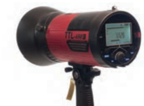
تصویر ۸۳ ▲

چه شباهت‌ها و تفاوت‌هایی می‌بینید؟ آنها را بنویسید.