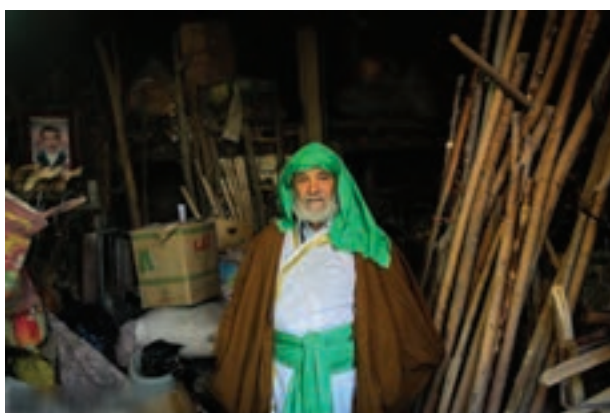
تصویر ۴۹ ▲