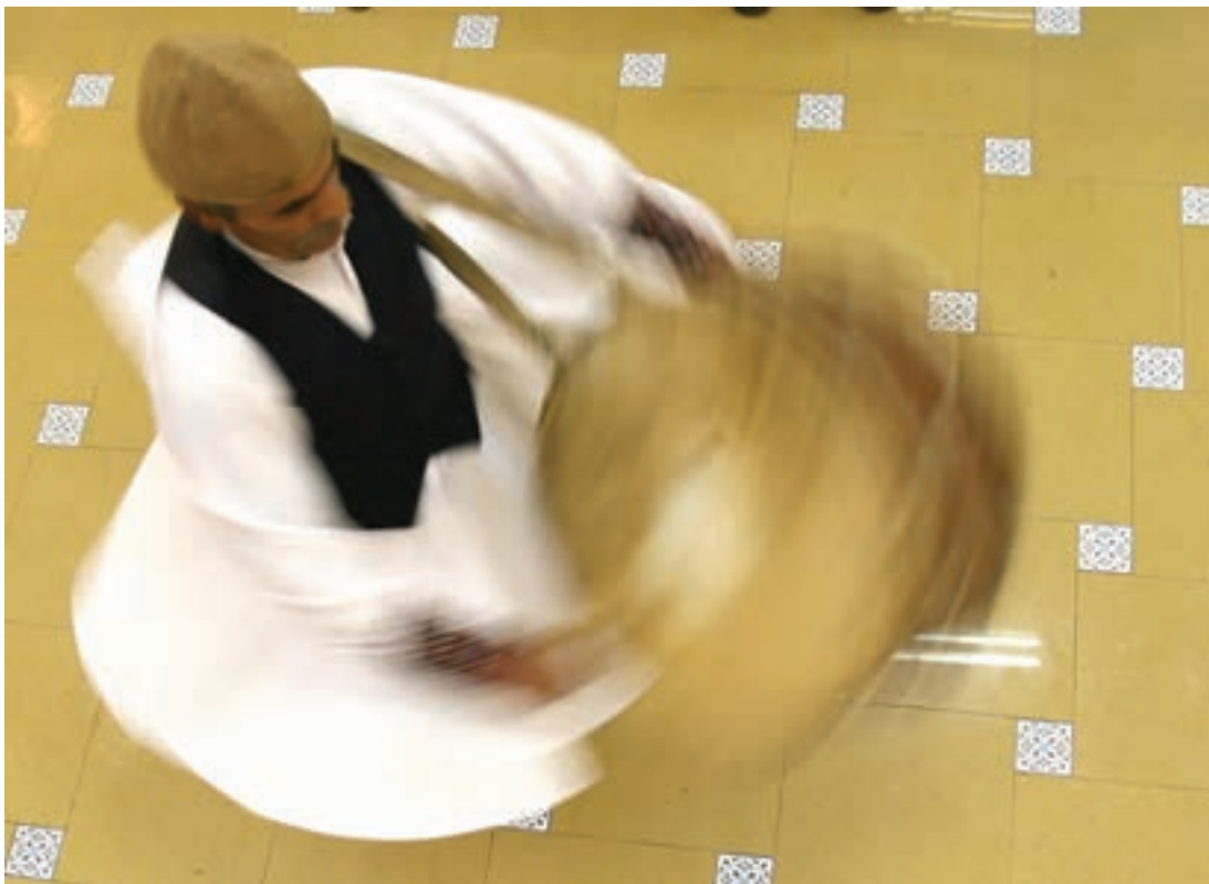
▲ تصویر ۳۲