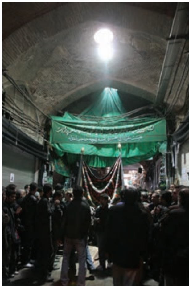
تصویر ۷۱ ▲

- نمونه عکس‌هایی از مراسم آئینی و مذهبی یا جشن‌های مذهبی جمع‌آوری کنید و در کارگاه بر روی دیوار نصب کنید در کدامیک فضای معماری بیشتر دیده می‌شود و مورد توجه عکاس بوده است؟ درباره آن‌ها با یکدیگر گفت‌وگو کنید. - از مکان‌هایی در استانتان که معماری ویژه‌ای دارند و یا محل برگزاری آئین‌های مذهبی، ملی و ... است عکاسی کنید.