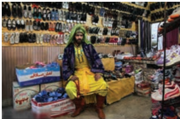
تصویر ۳۹ ▲