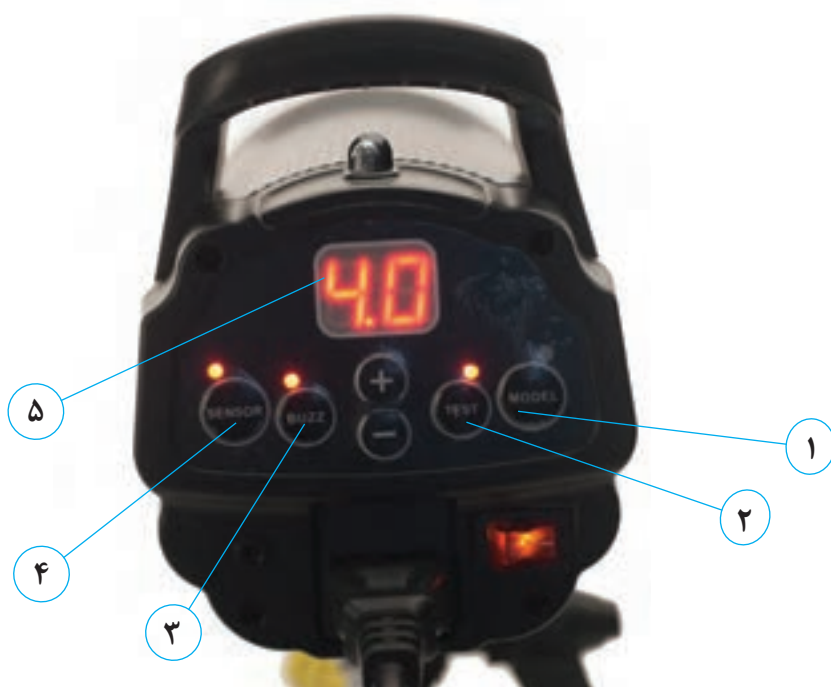
تصویر ۸۶ ▲