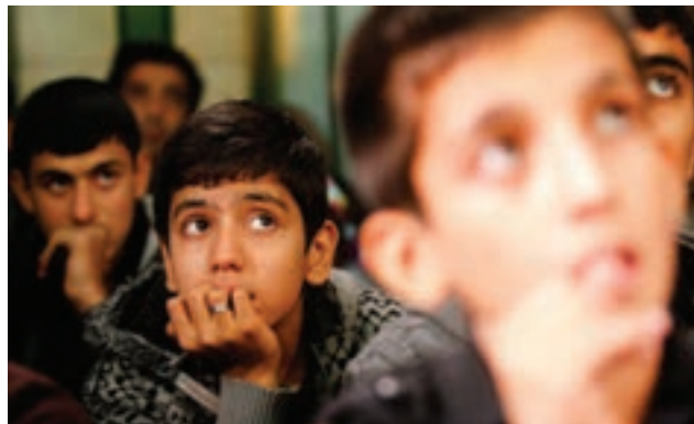
تصویر ۲۷ ▲