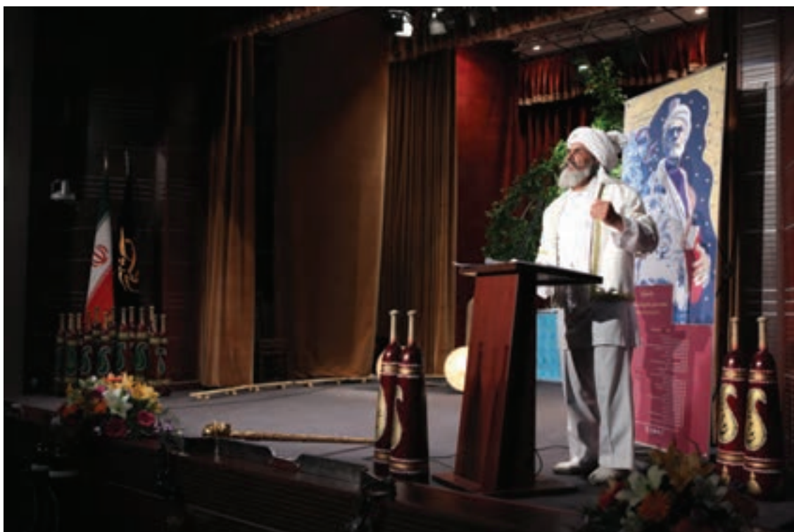
▲ تصویر ۳