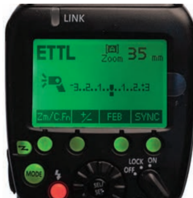
تصویر ۸۵ ◀

هرچند که صفحه کنترل فلاش‌ها در شکل ظاهری متفاوت است ولی در مجموع از یک مکانیسم برخوردارند. در تصاویر بعضی از دکمه‌های مشترک فلاش‌ها را معرفی می‌کنیم.