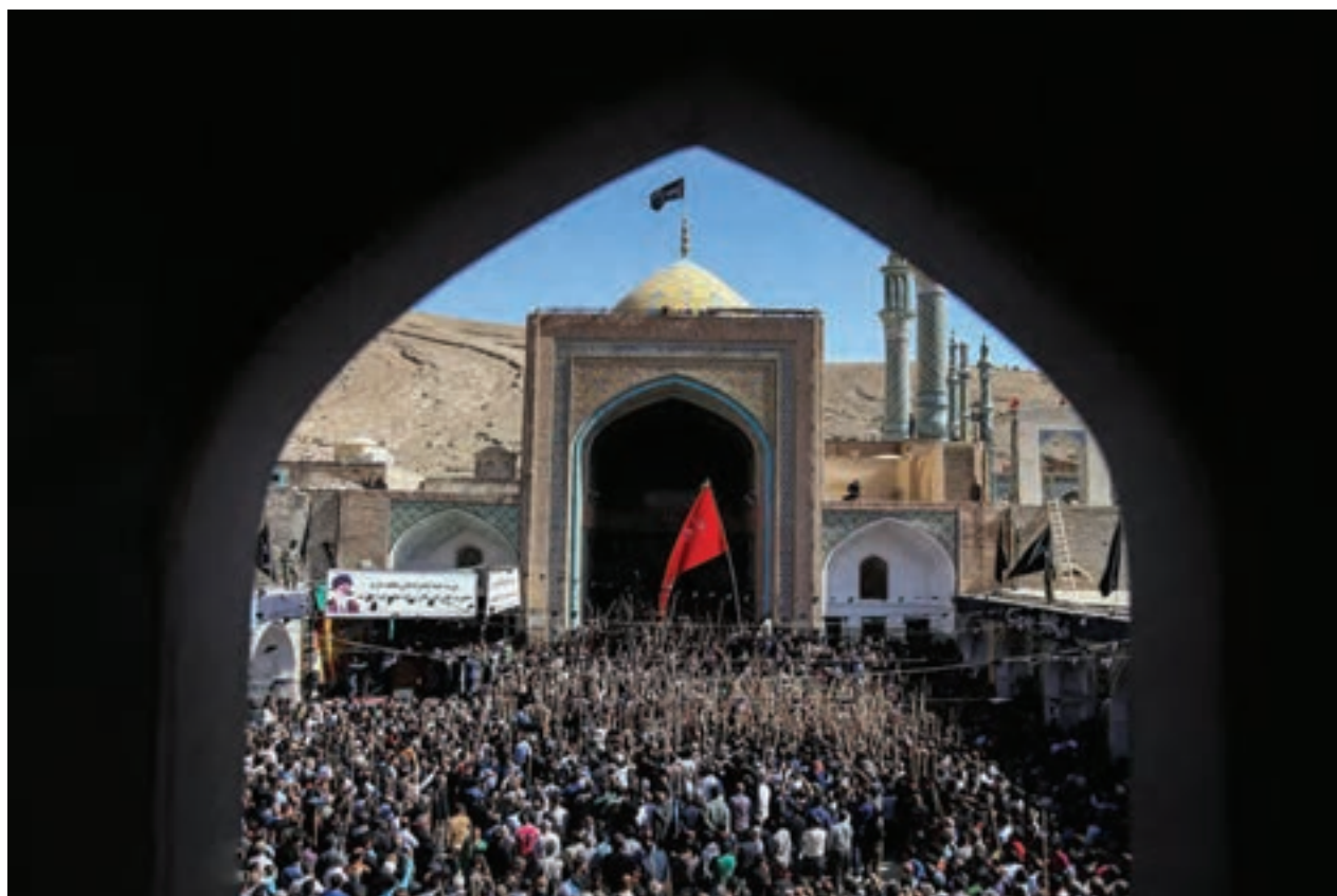
▲ تصویر ۷۴

این وسایل نسبتاً ساده هستند و نیازی به خرید همه آنها نیست. ما می‌توانیم با کمی وسایل ساده یک کاور ضد آب برای کیف و یا کوله و یک کاور ساده هم برای دوربین‌مان بسازیم تا در زمان لازم بتوانیم از آنها بهره‌مند شویم.