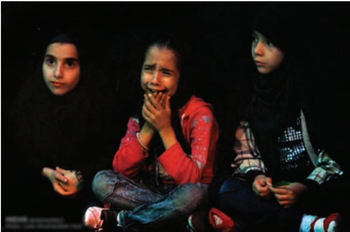
تصویر ۲۳ ▲