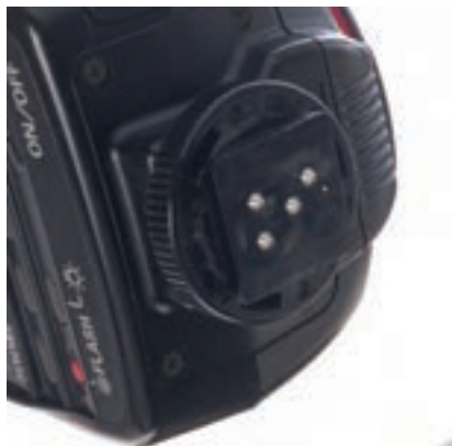
تصویر ۸۸ ▲

آیا به محل اتصال فلاش با دوربین دقت کرده‌اید؟ (تصاویر ۸۸ و ۸۹) فلاش شما چند نقطه اتصال با دوربین عکاسی دارد؟ آیا در تمامی دوربین‌های عکاسی محل نصب، نحوه اتصالات و آرایش و قرارگیری اتصالات به یک شکل است. کار این اتصالات چیست؟ به قسمت اتصال فلاش به دوربین عکاسی، پایه فلاش گفته می‌شود و محل نصب فلاش بر روی دوربین عکاسی (Hot shoes) نامیده می‌شود.