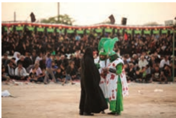
تصویر ۳۶ ▲

۱- ایده و اجرا: در برخی از مراحل عکاسی، از یک مراسم آئینی (مانند تعزیه)، عکاس پس از انجام کار، می‌تواند به ایده‌های خلاق برسد و برای یک مجموعه عکس، ایده‌پردازی کند. بدین ترتیب گویا ادامه یک مراسم آئینی را در زندگی روزمره به تصویر می‌کشد (تصاویر ۳۶ تا ۵۷).