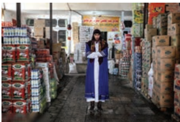
تصویر ۵۱ ▲