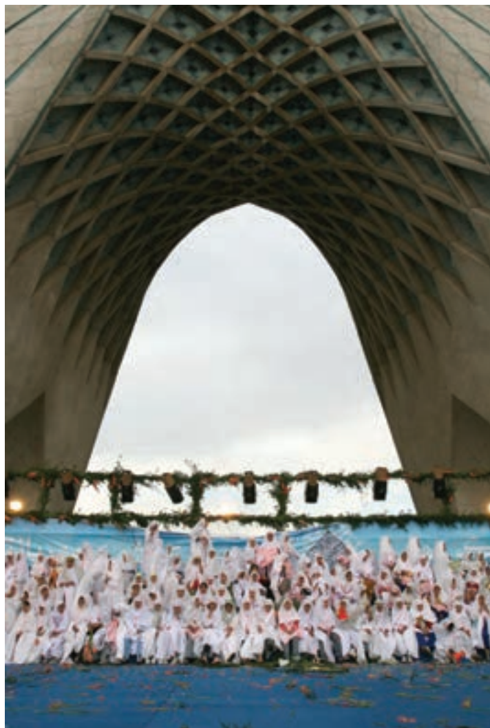
تصویر ۶۶ ▲

۴- فضای سالن (محیط): در برخی موارد و با وجود مشکلات نوری در سالن‌ها و آمفی‌تئاترها، ممکن است با فضاهای زیبایی از نظر معماری روبه‌رو شویم. بهتر است توجه ما فقط به برگزاری یک جلسه و یا مراسم آئینی معطوف نباشد. تهیه عکس از مدعوین در کنار زیبایی‌های موجود در سالن از نظر معماری و تنوع در طراحی دکور و چیدمان وسایل، می‌تواند ارزش عکس‌های تولید شده را ارتقاء بخشد. به عنوان مثال؛ برگزاری مراسم روز بزرگداشت سعدی و یا حافظ در حافظیه و سعدیه شیراز و یا بزرگداشت حکیم ابوالقاسم فردوسی در کنار بنای یادبود وی در طوس و بناهای یادبود دیگری مانند آن، می‌تواند به جذابیت و زیبایی عکس‌های تولید شده کمک قابل توجهی کند و یا برگزاری جشن غدیر و یا جشن‌های تکلیف، در مساجد و اماکن متبرکه، موقعیت مناسبی است که ما می‌توانیم در حین تهیه عکس از مراسم در حال برگزاری، به فضای معماری زیبای مساجد و یا کاشی‌کاری‌ها و مانند آن هم توجه کافی داشته باشیم و عکس‌های متنوع‌تر و مفیدتری را تهیه کنیم. همچنین عکاسی از جشن میلاد امام رضا (ع) در مشهد مقدس با توجه به معماری ویژه این مکان و کاشی‌کاری‌ها، کتیبه‌ها، نور و فضای صحن امام رضا (ع) از جاذبه‌های عکاسی با رویکرد معماری می‌تواند محسوب شوند.