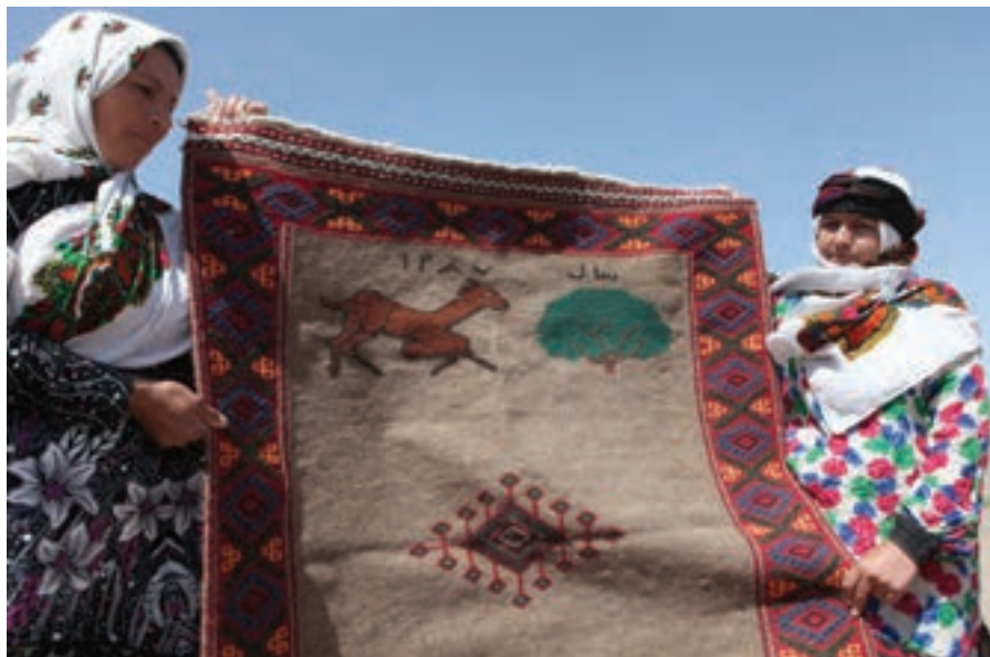
تصویر ۱۰۱ ▲