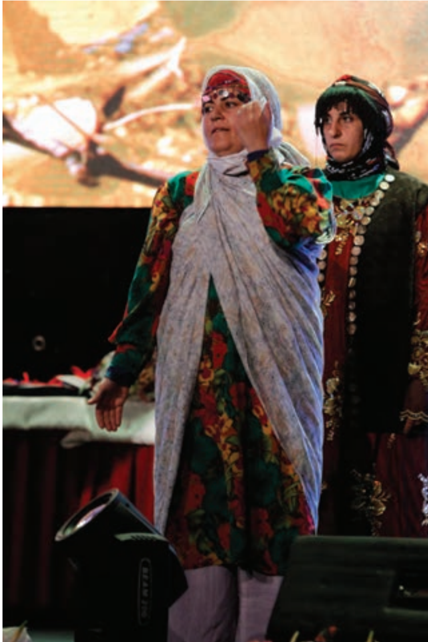
تصویر ۱۰ ▲

فکر می‌کنید برای انتقال مفاهیم دقیق و اتفاقات یک مراسم به چه نکاتی باید توجه کنید؟