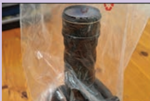
▲ تصویر ۷۶