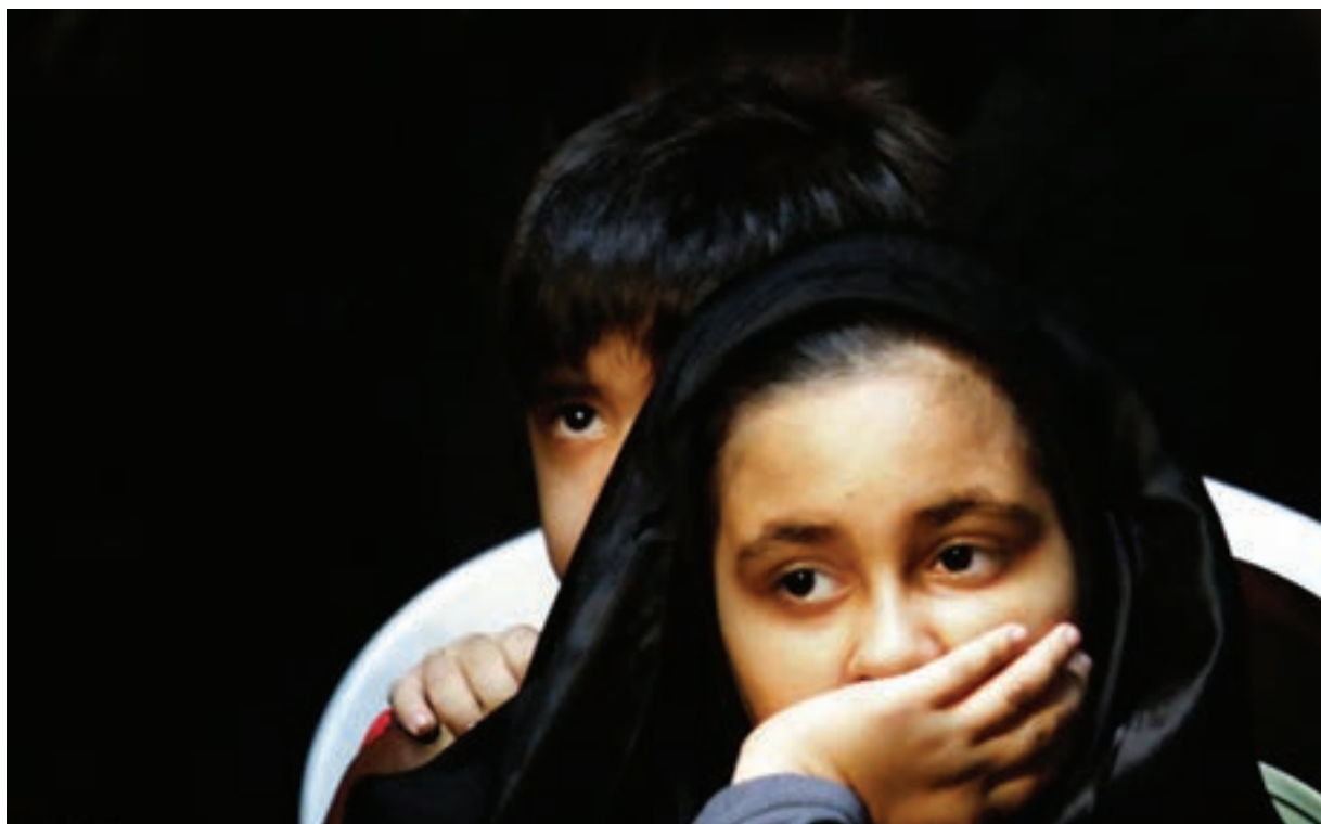
تصویر ۲۵ ▲