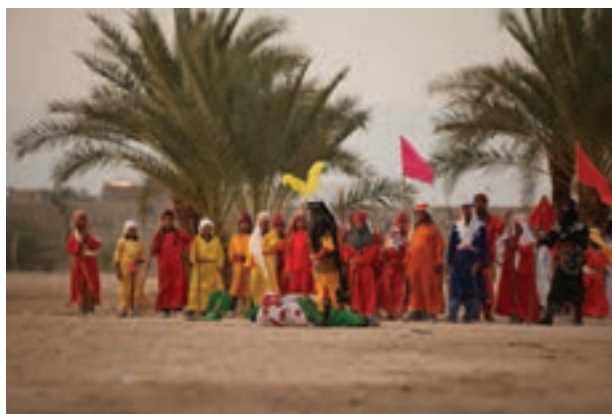
تصویر ۳۷ ▲