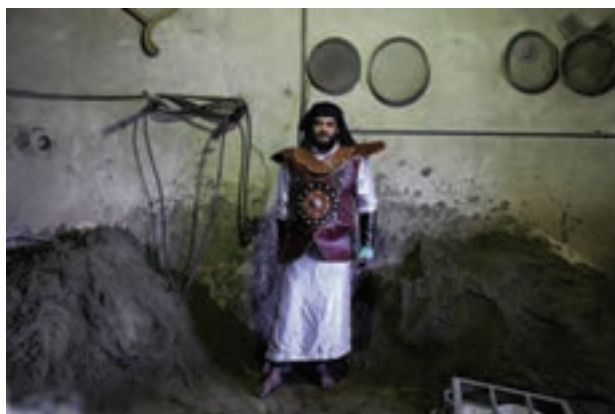
تصویر ۴۳ ▲