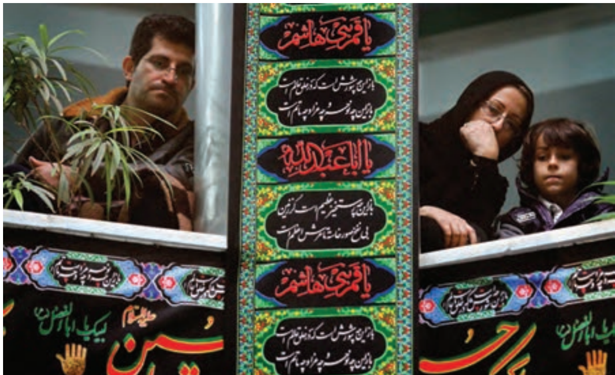
تصویر ۲۰ ▲