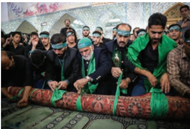
تصویر ۱ ▲

آیا می‌توانید یک تعریف ساده از جشن‌ها و مراسم آئینی در کلاس ارائه دهید؟ به عکس‌های زیر توجه کنید، آیا می‌توانید آنها را به لحاظ نوع دسته‌بندی کنید؟