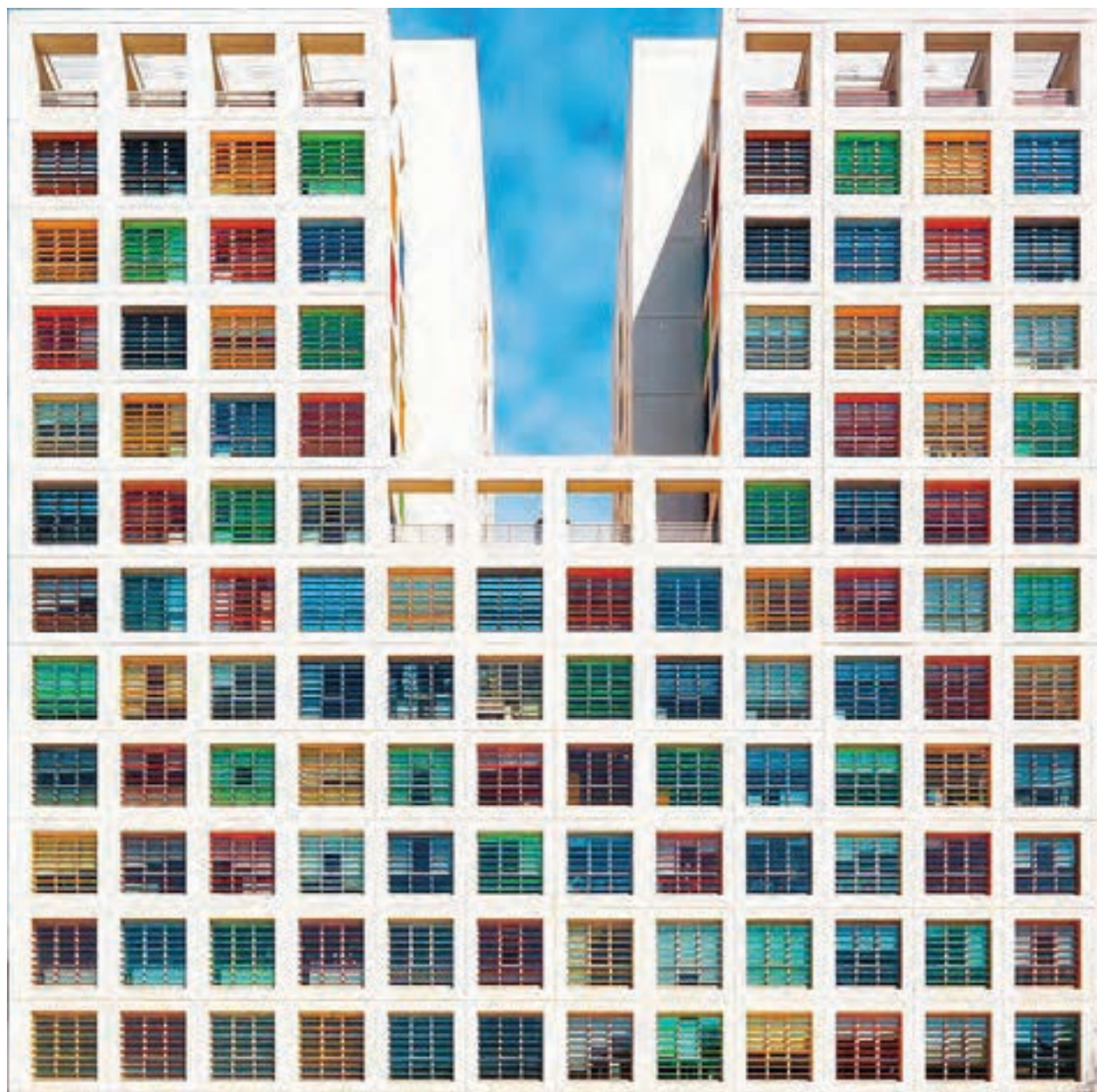
تصویر ۱۰۳ ▲