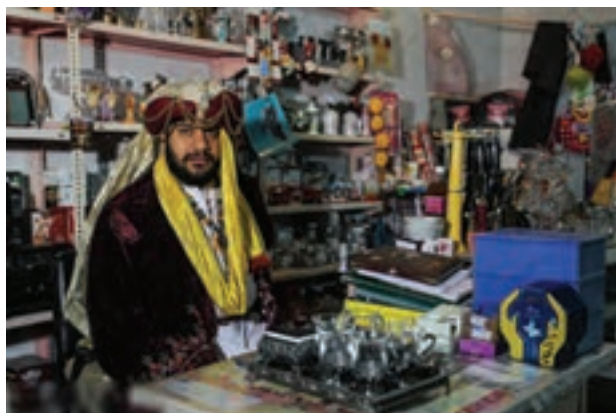
تصویر ۴۴ ▲