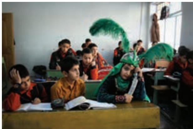
تصویر ۴۰ ▲