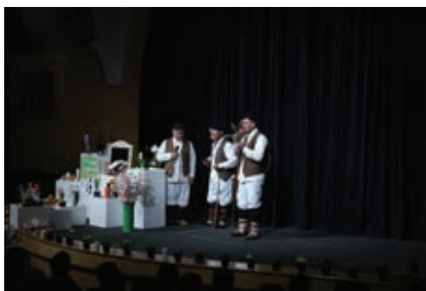
تصویر ۱۰۶ ▲