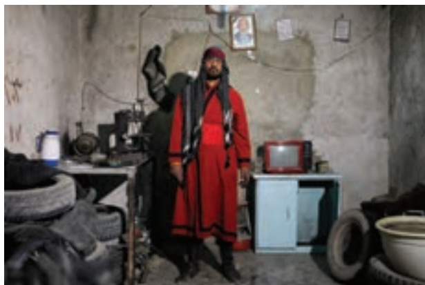
تصویر ۴۵ ▲