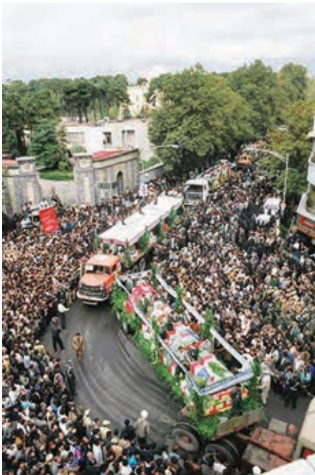
تصویر ۳۴ ▲