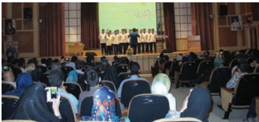
تصویر ۹۸ ▲