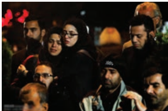
تصویر ۲۶ ▲