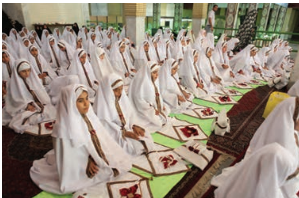
تصویر ۹۷ ▲