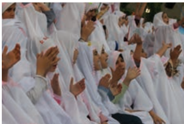
تصویر ۱۰۴ ▲