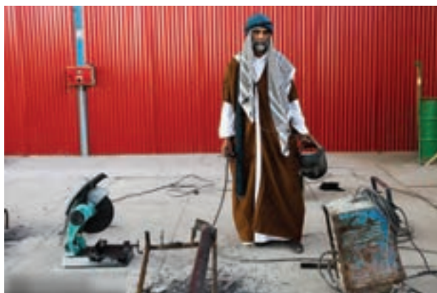
تصویر ۵۵ ▲