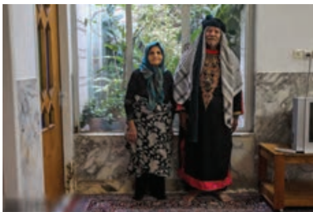
تصویر ۴۷ ▲