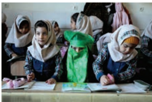
تصویر ۵۷ ▲

با مراجعه به کتابخانه مدرسه و یا فضای مجازی، دو مجموعه عکس را با خود به کلاس آورده و درباره موضوع، ایده و اجرای آن‌ها با هنرآموز خود و دیگر هنرجویان گفت‌وگو کنید.