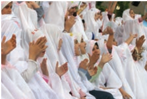
تصویر ۱۰۷ ▲

به نظر شما این عکس‌ها چه اشکالاتی دارند؟ آیا این اشکالات قابل رفع هستند؟ پیشنهاد شما برای رفع اشکال این عکس‌ها چیست؟