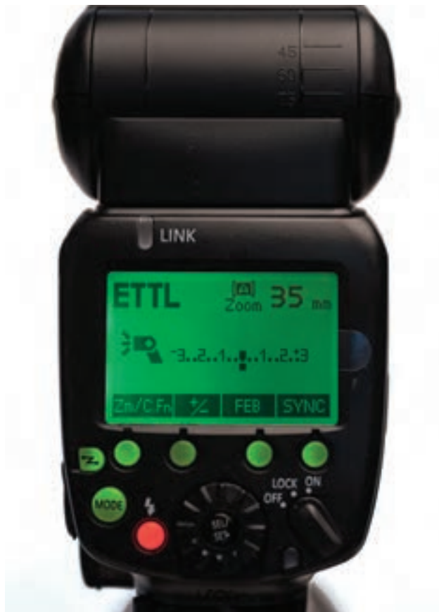
تصویر ۸۴ ▲