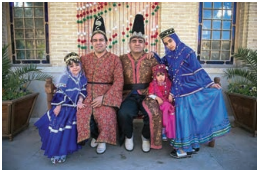
تصویر ۱۰۰ ▲