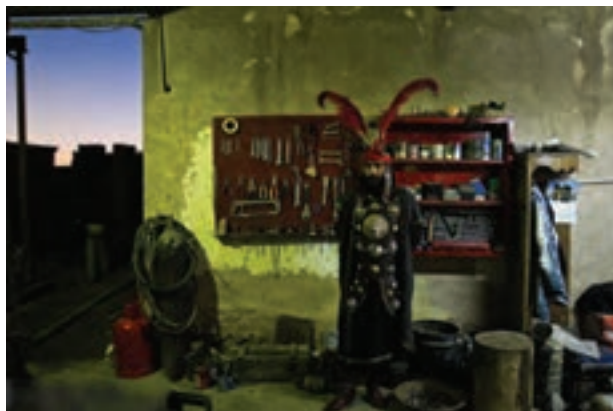
تصویر ۵۳ ▲