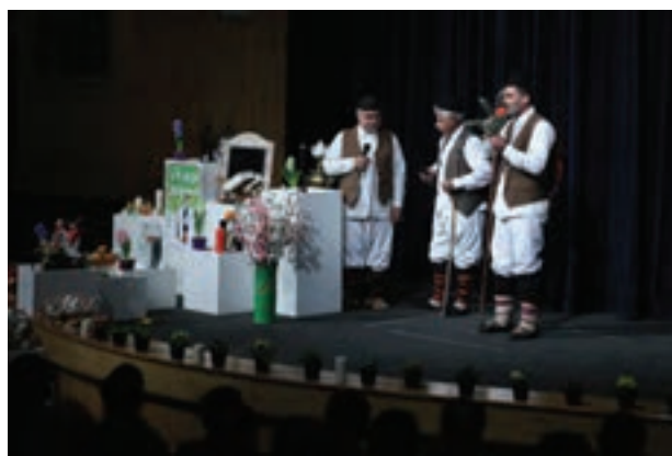
تصویر ۱۰۹ ▲

به آرشیو عکس‌های خود مراجعه کنید و با راهنمایی هنرآموز، هر کدام که نیاز به اصلاح رنگ، نور و یا کادر دارد را مشخص کرده پس از اصلاح آن‌ها را چاپ کنید و در کارگاه ارائه دهید.