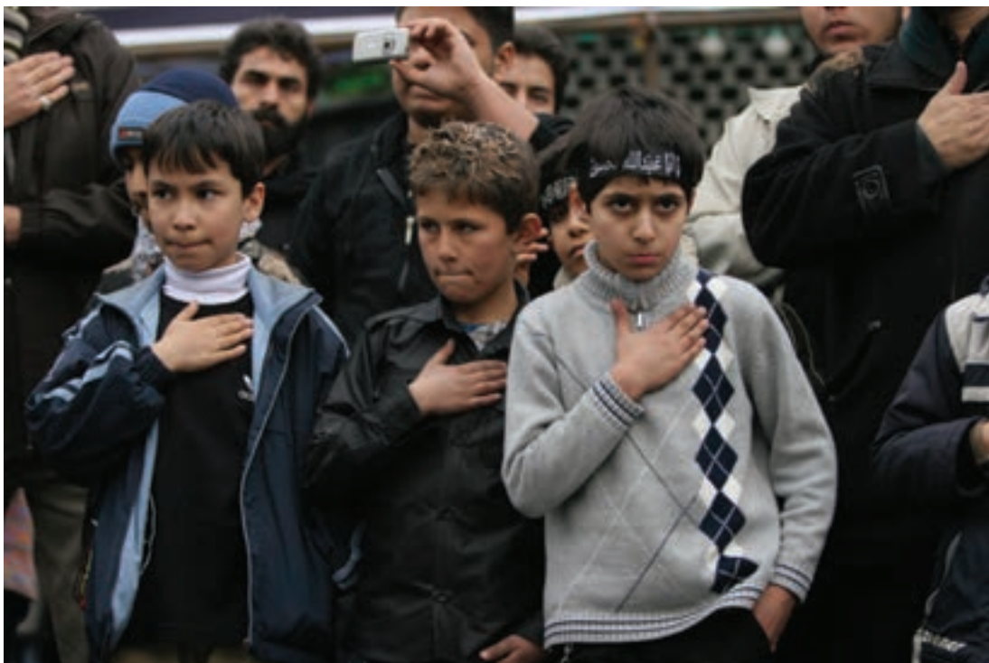
تصویر ۱۶ ▲