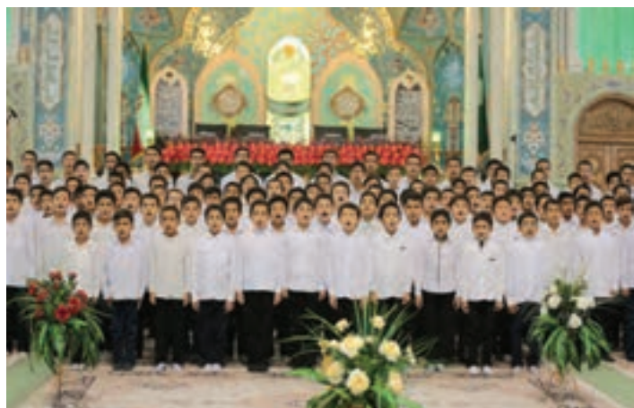
تصویر ۶۷ ▲

۴- فضای سالن (محیط): در برخی موارد و با وجود مشکلات نوری در سالن‌ها و آمفی‌تئاترها، ممکن است با فضاهای زیبایی از نظر معماری روبه‌رو شویم. بهتر است توجه ما فقط به برگزاری یک جلسه و یا مراسم آئینی معطوف نباشد. تهیه عکس از مدعوین در کنار زیبایی‌های موجود در سالن از نظر معماری و تنوع در طراحی دکور و چیدمان وسایل، می‌تواند ارزش عکس‌های تولید شده را ارتقاء بخشد. به عنوان مثال؛ برگزاری مراسم روز بزرگداشت سعدی و یا حافظ در حافظیه و سعدیه شیراز و یا بزرگداشت حکیم ابوالقاسم فردوسی در کنار بنای یادبود وی در طوس و بناهای یادبود دیگری مانند آن، می‌تواند به جذابیت و زیبایی عکس‌های تولید شده کمک قابل توجهی کند و یا برگزاری جشن غدیر و یا جشن‌های تکلیف، در مساجد و اماکن متبرکه، موقعیت مناسبی است که ما می‌توانیم در حین تهیه عکس از مراسم در حال برگزاری، به فضای معماری زیبای مساجد و یا کاشی‌کاری‌ها و مانند آن هم توجه کافی داشته باشیم و عکس‌های متنوع‌تر و مفیدتری را تهیه کنیم. همچنین عکاسی از جشن میلاد امام رضا (ع) در مشهد مقدس با توجه به معماری ویژه این مکان و کاشی‌کاری‌ها، کتیبه‌ها، نور و فضای صحن امام رضا (ع) از جاذبه‌های عکاسی با رویکرد معماری می‌تواند محسوب شوند.