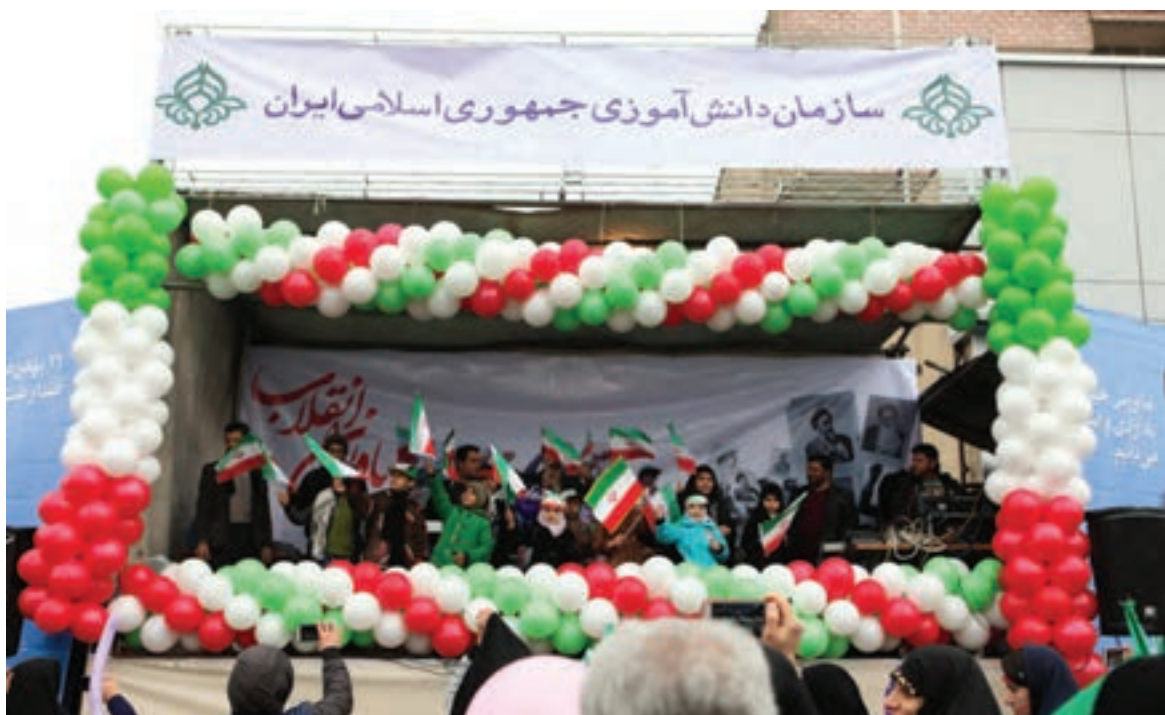
تصویر ۸ ▲