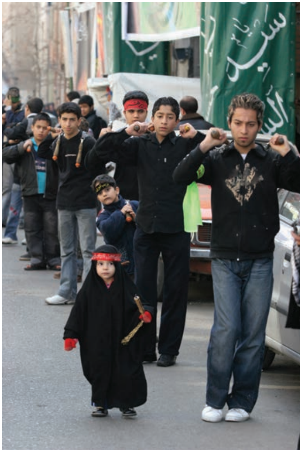
تصویر ۶۵ ▲