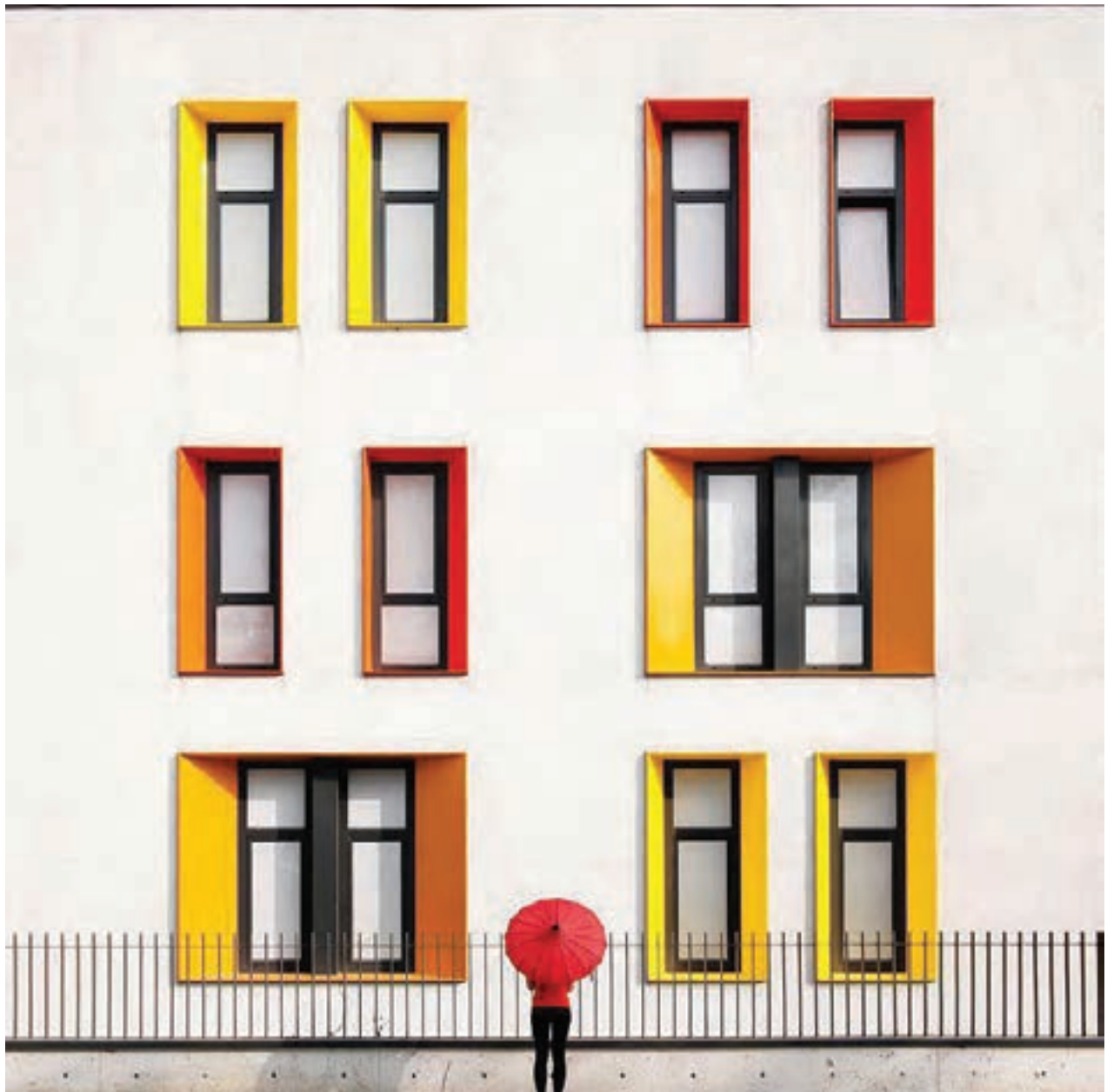
تصویر ۱۰۲ ▲