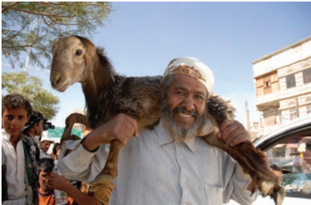
▲ تصویر ۹۵