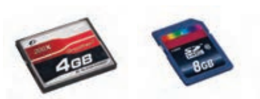
تصویر ۹۲ ▲

کارت‌های حافظه با گنجایش‌های بسیار بالا و نیز سرعت ذخیره سریع عکس‌ها تولید شده‌اند که در هنگام عکاسی پرشمار از مراسم، باید همراه عکاس باشند.