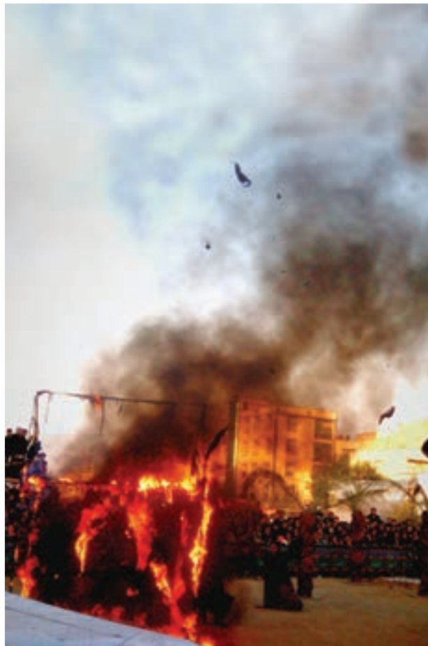
تصویر ۳۵ ▲

به نظر شما کدام عکس واقعی‌تر است؟ هریک از عکس‌ها به چه نوع مراسم یا واقعه‌ای اشاره می‌کند؟ آیا عکاس با توجه به موضوع عکس، کادربندی مناسبی انتخاب کرده است؟ کدامیک از عکس‌ها با موضوع این واحد یادگیری (مراسم و جشن‌ها) ارتباط مستقیمی دارد؟