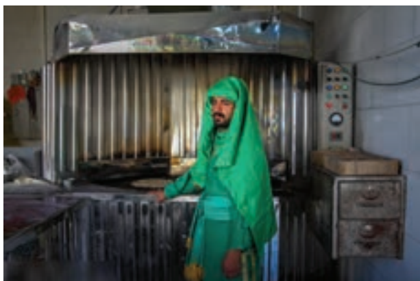
تصویر ۵۴ ▲