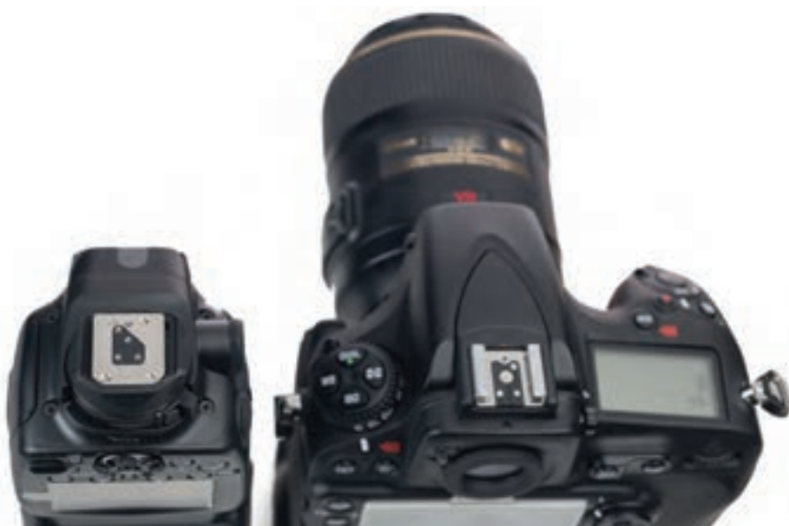
تصویر ۹۱ ▲