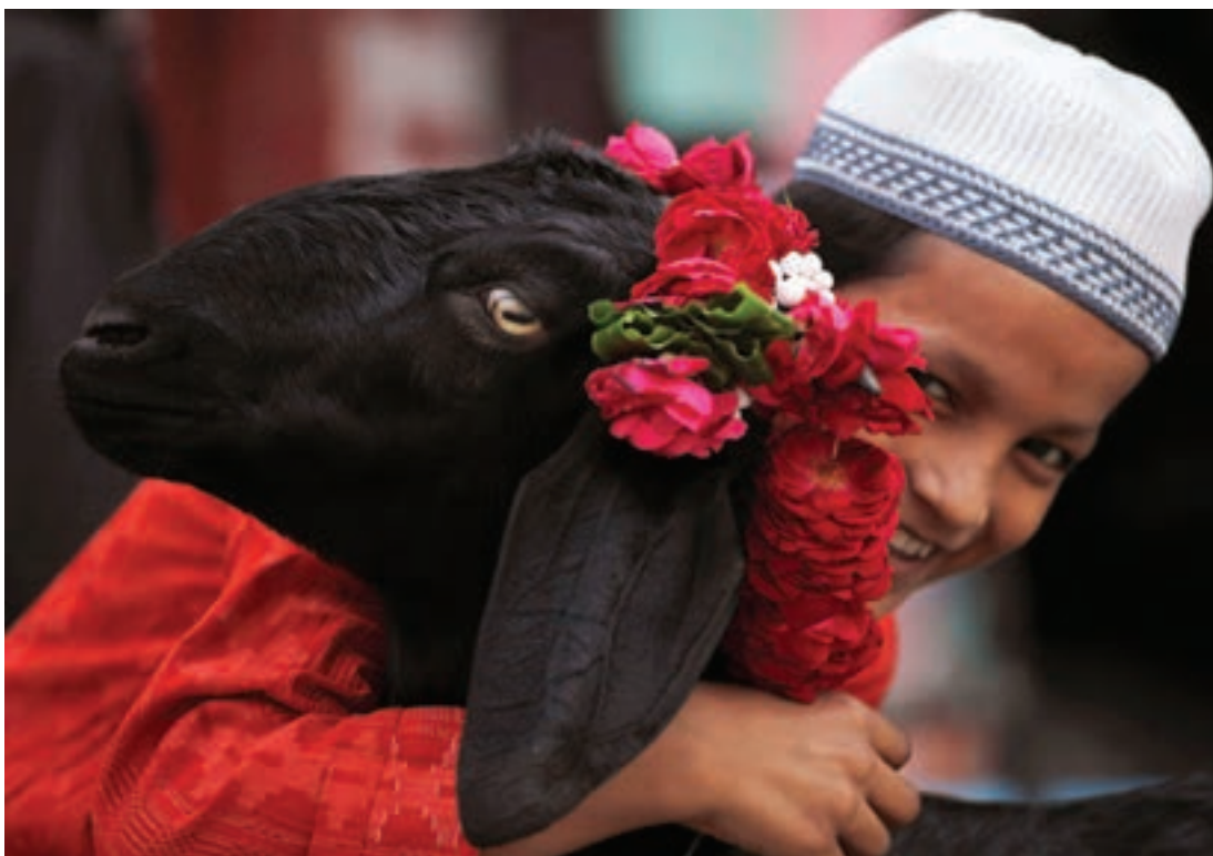
تصویر ۱۷ ▲