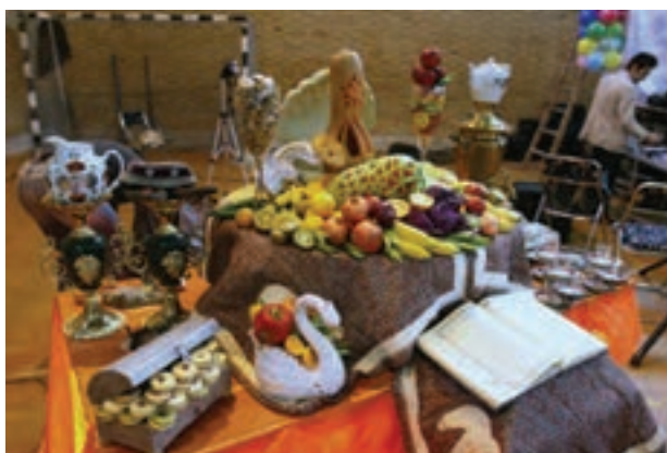
تصویر ۱۰۸ ▲

اکنون به تصاویر زیر نگاه کنید. هر یک از عکس‌ها چه تغییراتی کرده‌اند؟ (رنگ، کادر، نور و ...)