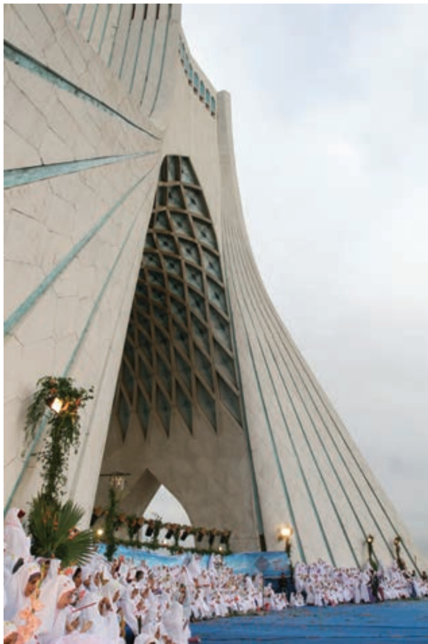
تصویر ۵۸ ▲

۲- ارزیابی از شرایط مکان و فضای عکاسی: عکاسی از جشن‌ها، مراسم و آیین‌ها نیز یکی از فعالیت‌های مرتبط با عکاسی بوده و از اصول و قواعد ویژه‌ای پیروی می‌کند.