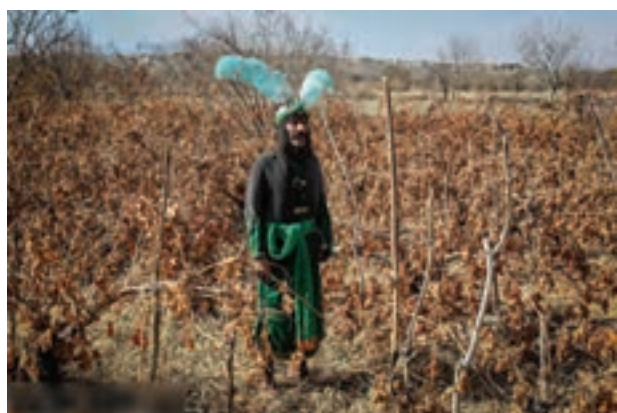
تصویر ۴۸ ▲