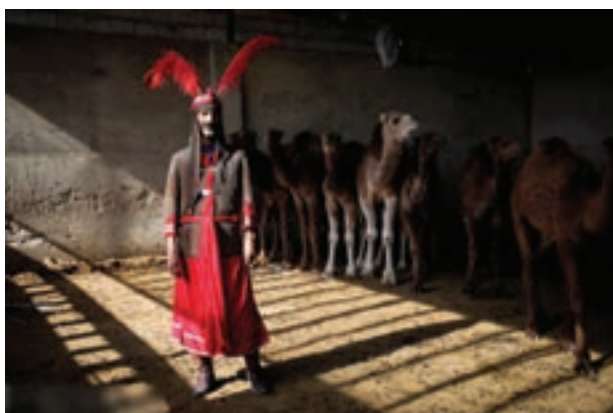
تصویر ۵۶ ▲