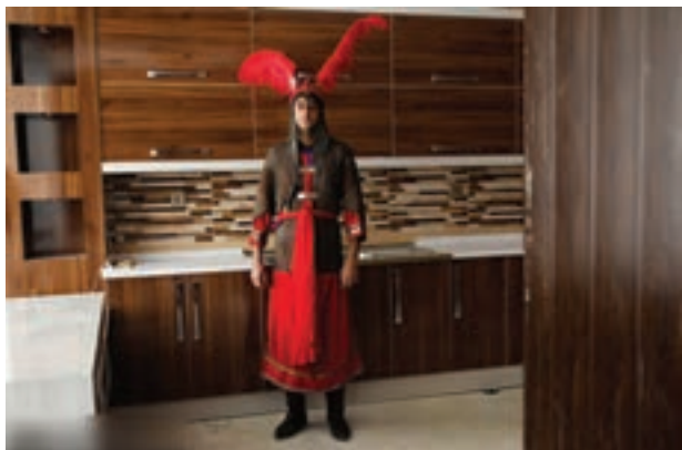
تصویر ۳۸ ▲