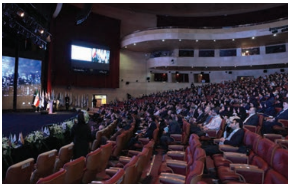
تصویر ۶۳ ▲