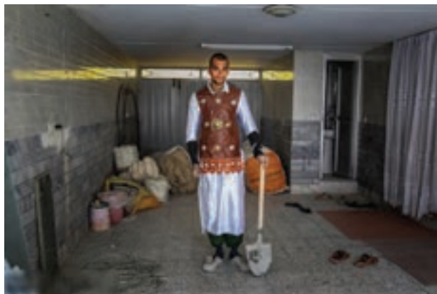
تصویر ۴۱ ▲