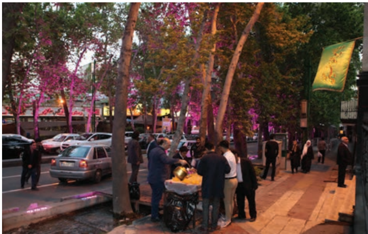
تصویر ۹۹ ▲

به عکس‌های ۱۰۰ تا ۱۰۳ توجه کنید: عکس‌ها را از نظر عناصر بصری و ترکیب‌بندی بررسی کنید و نظرات خود را بنویسید.