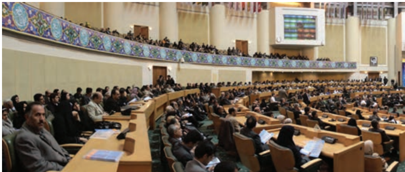
تصویر ۶۱ ▲

۳- وضعیت سالن و مدعوین: در بسیاری از مراسم و آئین‌ها، مدعوین معمولاً به صورت پراکنده در سالن مستقر می‌شوند. این پراکندگی، عکاس را برای تهیه عکس‌های مناسب و ایده‌آل با مشکلاتی مواجه می‌سازد. در برخی موارد می‌توان با کمی جابجایی و بالا و پایین شدن و یا به چپ و راست حرکت کردن و یا استفاده از لنزهای مختلف عکاس این مشکل را حل کند. در چنین وضعیتی در صورت امکان، بهتر است عکاس، نحوه نشستن مدعوین و ساماندهی سالن را با همکاری مجریان و مسئولان ذی‌ربط انجام دهد و سپس عکاسی را آغاز کند.