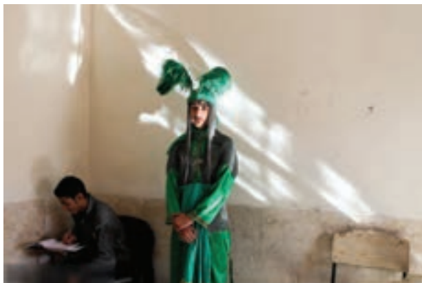
تصویر ۵۲ ▲