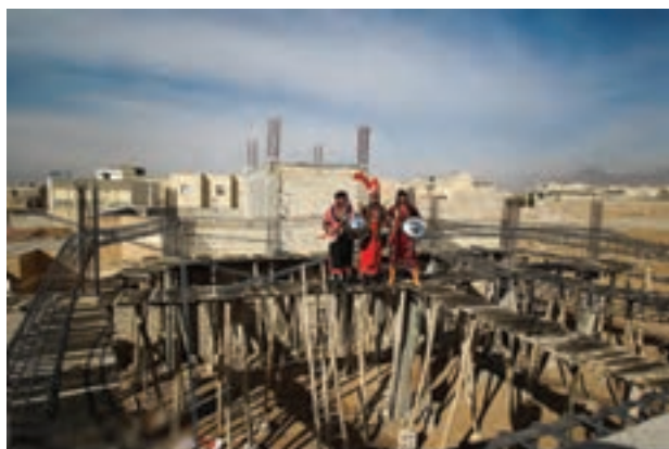
تصویر ۴۲ ▲