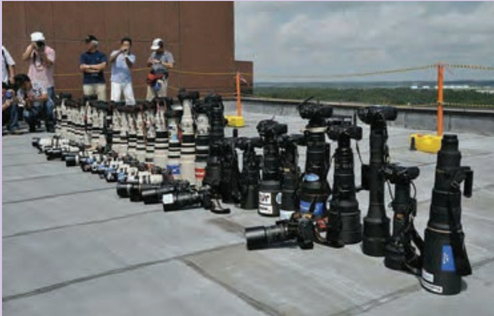
تصویر ۱۳ ▲

آیا می‌توانید فهرستی از تجهیزات لازم برای عکاسی در شرایط جوی و اقلیمی گوناگون تهیه کنید؟