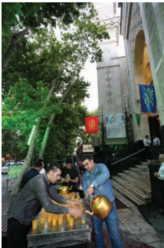
تصویر ۹۴ ▲

اکنون به عکس‌های زیر توجه کنید. درباره هر یک از عکس‌ها متناسب با موضوع و مکان عکاسی در کارگاه گفت‌وگو کنید و با جست‌وجو در عکس‌ها ابتدا مناسبت آنها را بنویسید و بگویید کدام یک از آن‌ها در بیان موضوع موفق بوده‌اند؟