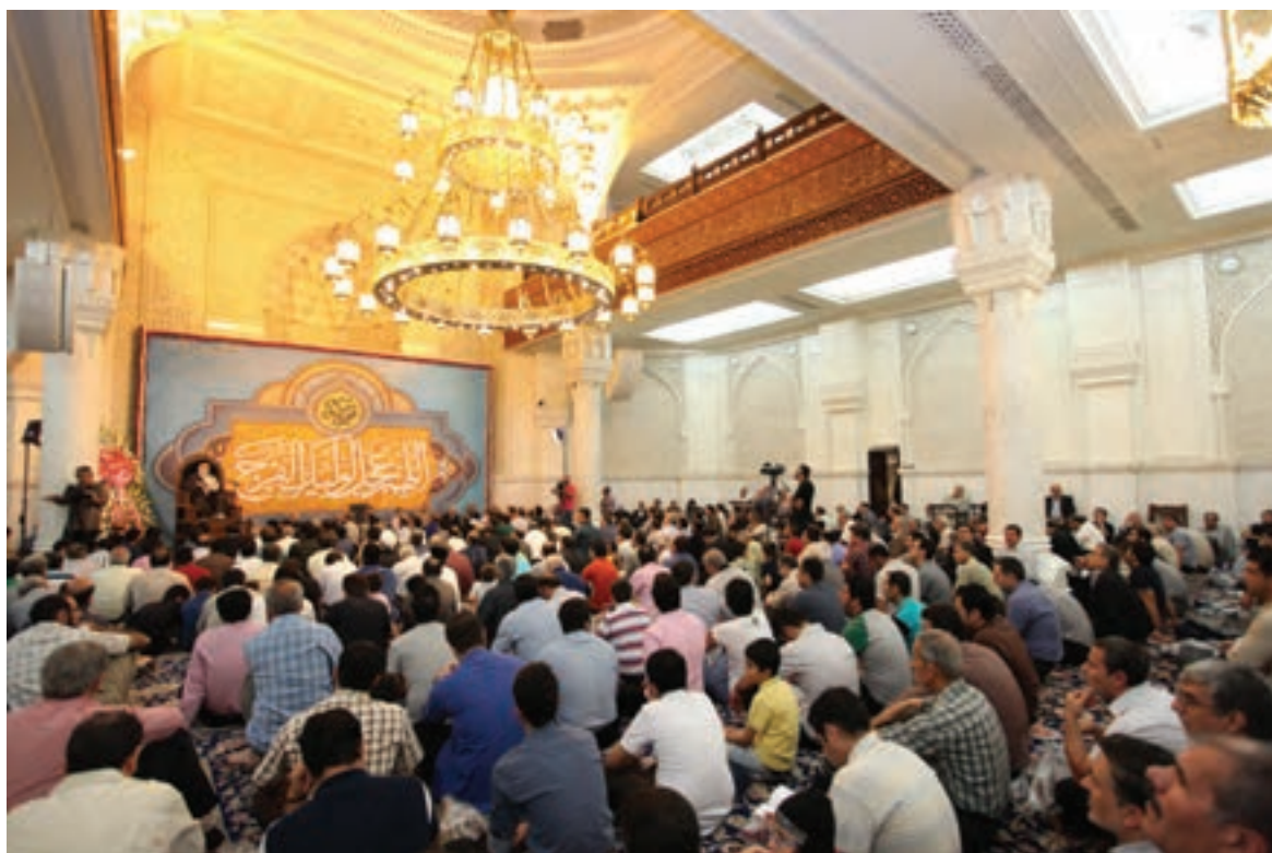
تصویر ۷ ▲