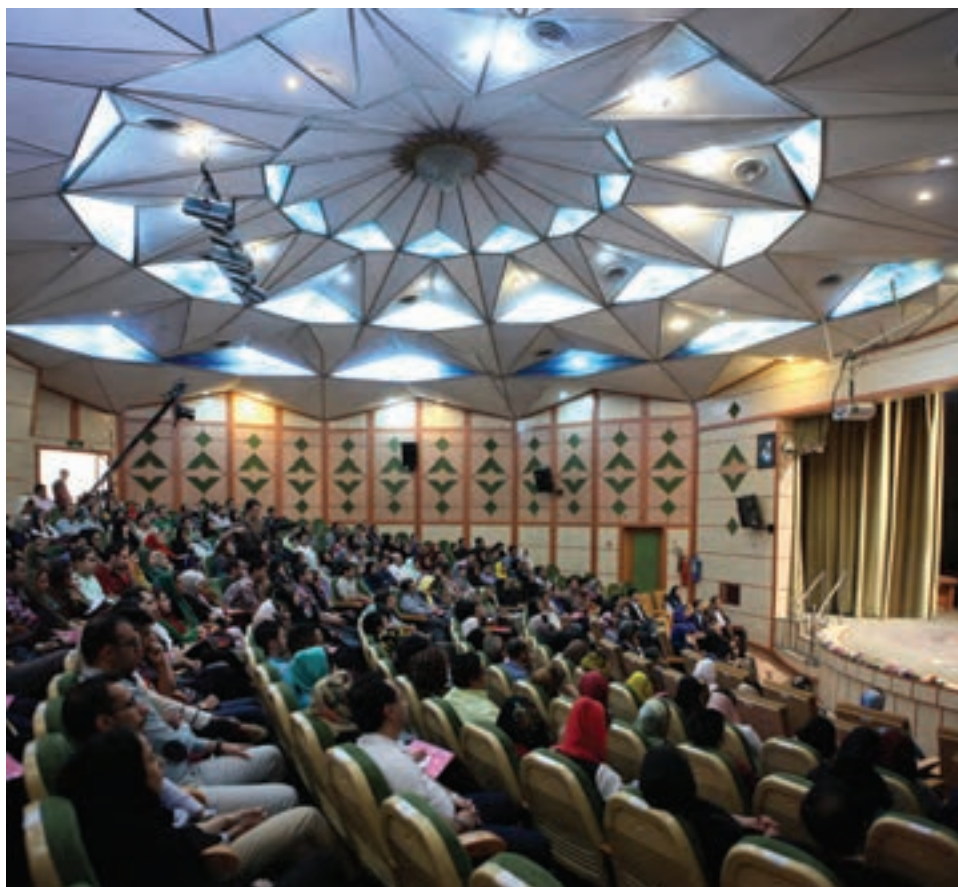
تصویر ۶۸ ▲