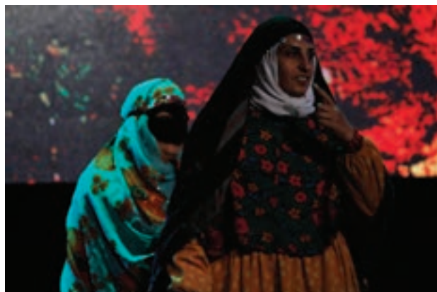
تصویر ۷۷ ▲

۱- نور: منابع نور طبیعی، یک نعمت بزرگ برای عکاسان است. شناخت منابع نور و نورپردازی مهم‌ترین عاملی است که سبب تفاوت در عکس‌ها شده و آموزش آن برای هر هنرجویی الزامی و کاربردی است.