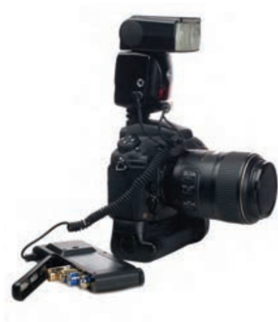
تصویر ۷۸ ▲

فلاش‌ها (فلاش‌های قابل حمل): به تصاویر زیر نگاه کنید.