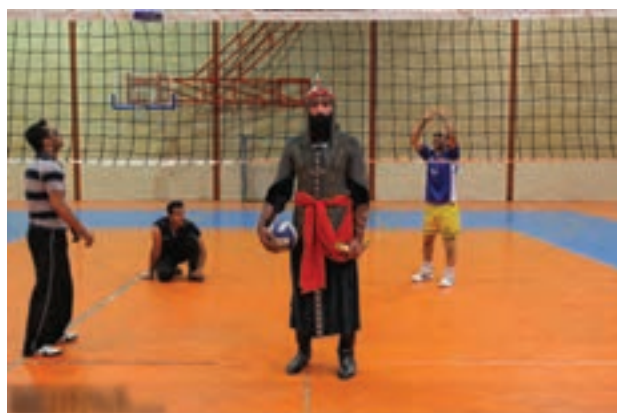
تصویر ۵۰ ▲