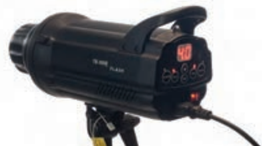
تصویر ۸۲ ▲

کار با فلاش‌های قابل حمل: به تصاویر نگاه کنید. در این تصاویر صفحه کنترل فلاش‌ها را می‌بینید.