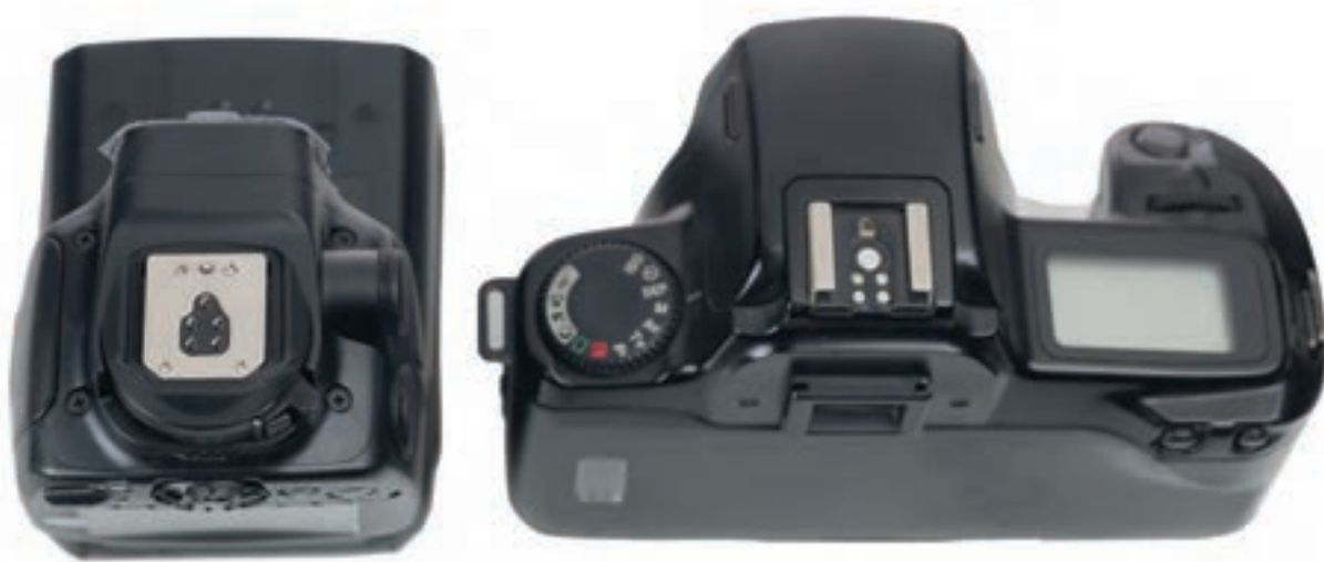
تصویر ۹۰ ▲

فلاش‌های اکسترنال، توسط نقاط فلزی خاص که کانکتور نام دارند به دوربین عکاسی متصل می‌شوند و وظیفه آنها برقراری ارتباط دوربین با فلاش و انتقال اطلاعات می‌باشد. این نقاط اتصال که یکی از آنها وظیفه دستور تخلیه فلاش را دارد، باقی آنها در دوربین‌های مختلف از آرایش خاصی برخوردار هستند (تصاویر ۹۰ و ۹۱). همین امر سبب می‌شود که برای هر دوربینی در برندها و مارک‌های مختلف، فلاش‌های اکسترنال مخصوص نیز تولید شود.