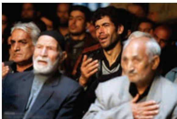
تصویر ۲۸ ▲