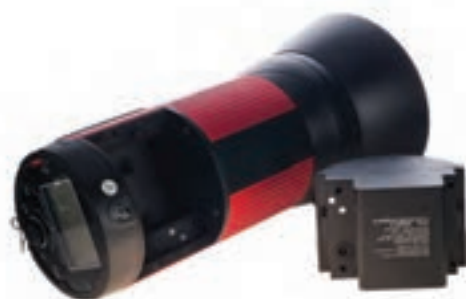
تصویر ۸۰ ▲

آیا می‌توانید ویژگی‌های فلاشی را که می‌شناسید بنویسید؟ * فلاش‌های قابل حمل به فلاش‌هایی گفته می‌شود که نیازی به برق به صورت مستقیم برای شارژ خازن‌های خود ندارند. فلاش‌های استودیویی از قدرت بیشتری نسبت به فلاش‌های قابل نصب روی دوربین (اکسترنال) برخوردار هستند. ولی نیاز این‌گونه فلاش‌ها به برق، استفاده از آن‌ها را در فضای خارج از استودیو مشکل می‌کند.