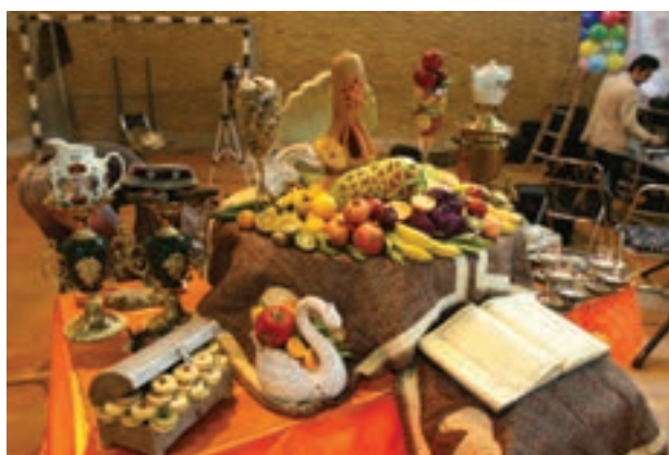
تصویر ۱۰۵ ▲