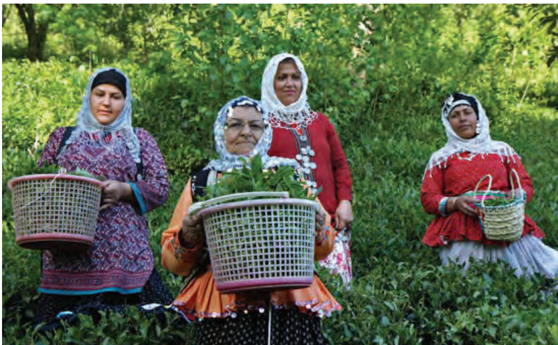
▲ تصویر ۳۳