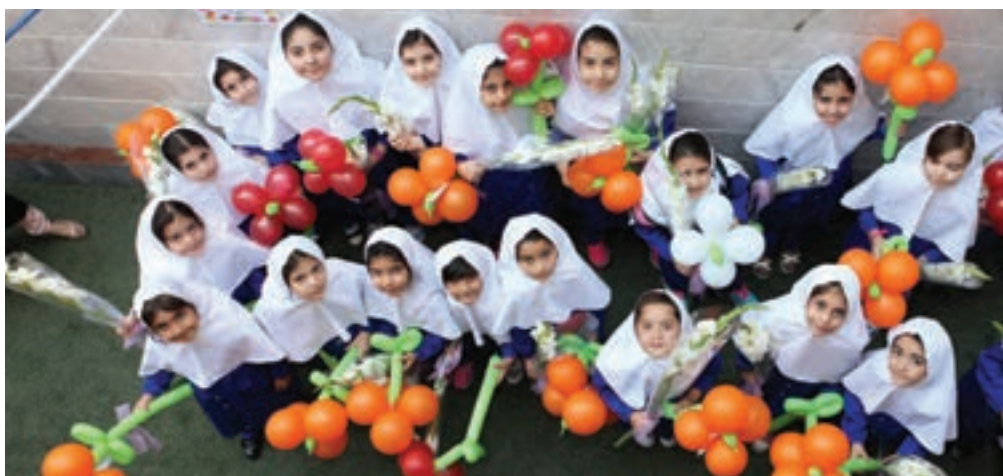
▲ تصویر ۹۶