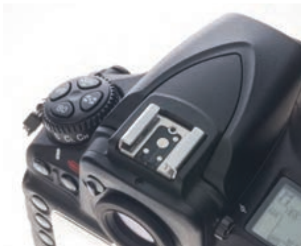
تصویر ۸۹ ▲