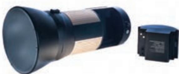
تصویر ۸۱ ▲