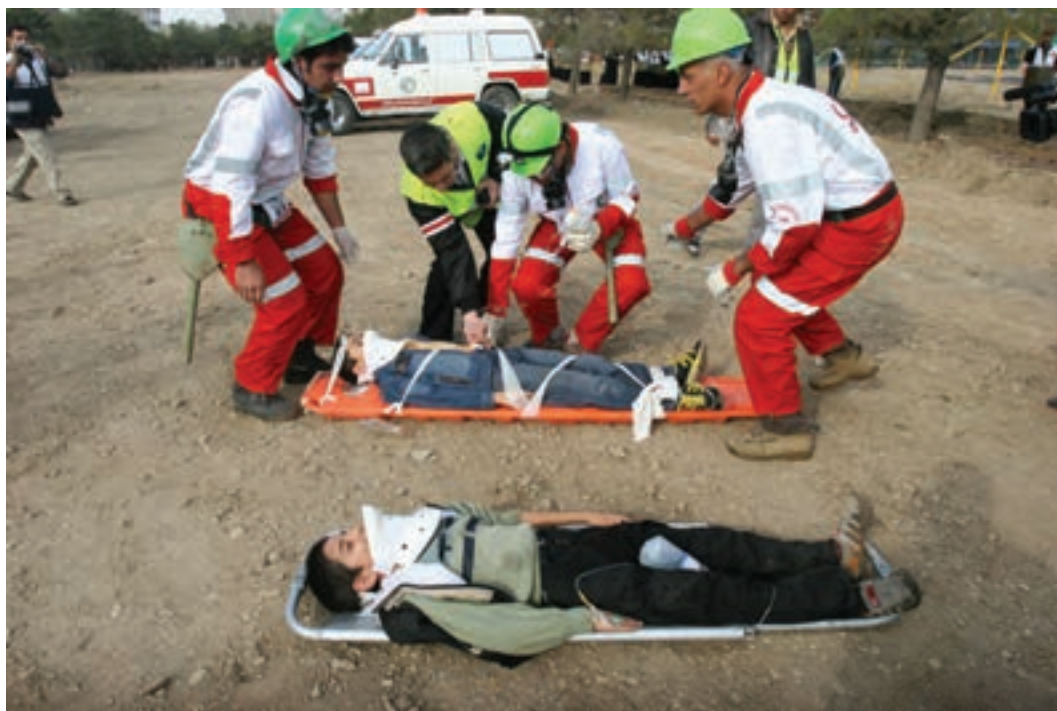
تصویر ۳۰ ▲