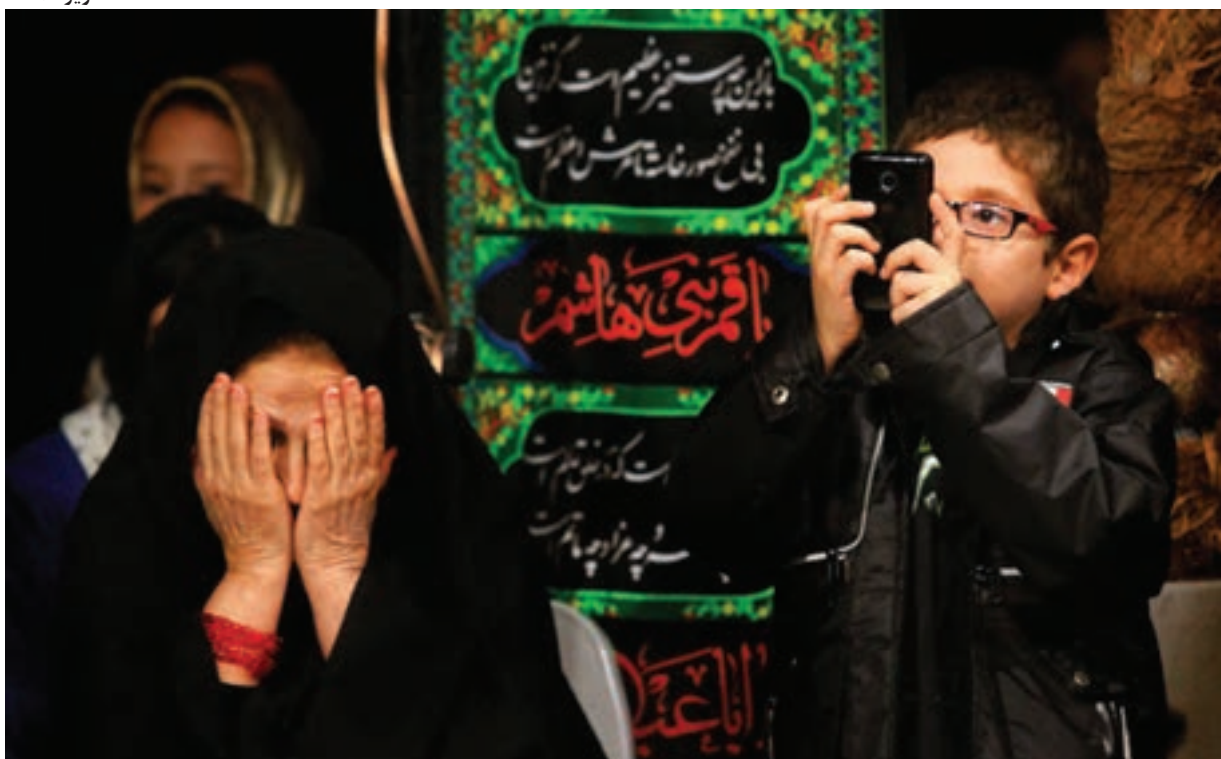
تصویر ۲۱ ▲