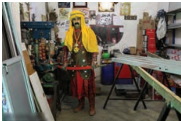
تصویر ۴۶ ▲