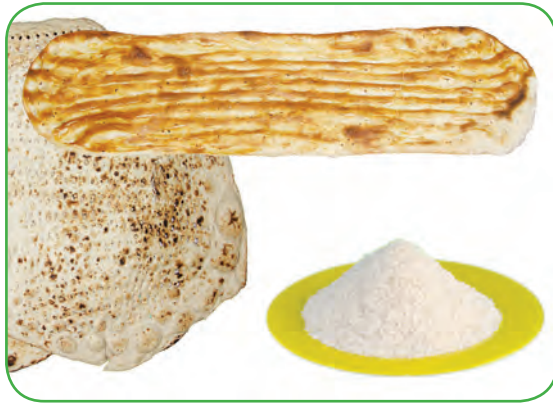
(برنج و نان)

تصاویر زیر گروه‌هایی از مواد غذایی را نشان می‌دهد که برای تغذیه صحیح مناسب است.