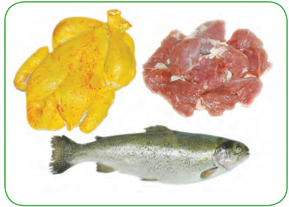
(مرغ، ماهی و گوشت)