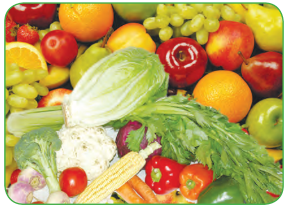
(سبزی و میوه‌ها)