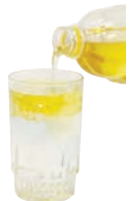
آب و روغن