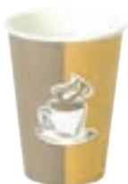
لیوان یونولیتی یا کاغذی