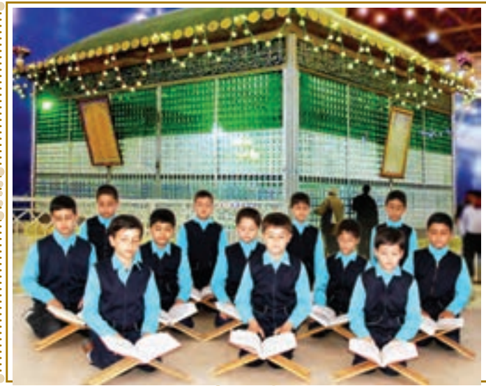
انس با قرآن کریم (استان تهران، شهرری، حرم امام خمینی)

از نمازخانه یا دفتر مدرسه به تعداد کافی، قرآن به کلاس بیاورید؛ هر میز حداقل یک قرآن داشته باشد. با راهنمایی آموزگار به صورت تصادفی قرآن را باز کنید. سپس دانش آموزان هر میز، آیات آن دو صفحه را برای یکدیگر می خوانند. آن گاه هر دانش آموز حدود یک سطر را با صدای بلند می خواند.