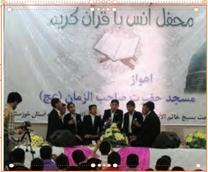
انس با قرآن کریم در استان خوزستان

با راهنمایی آموزگار خود پس از آوردن قرآن کریم از دفتر مدرسه، آن را به صورت تصادفی باز کنید و از روی آن بخوانید.