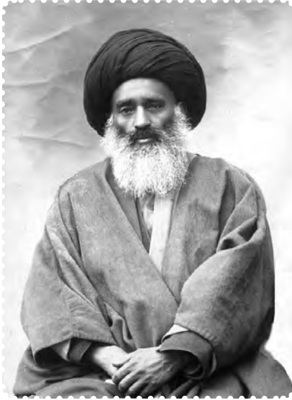
آیت الله بهبهانی