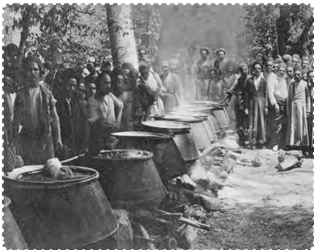
دیگ‌های غذا در سفارت انگلیس برای مشروطه خواهان

بدون پناهندگی به سفارت انگلستان، می‌توانستند به خواسته‌های خود دست یابند. دولت انگلستان بر خلاف دولت روسیه که از دربار حمایت می‌کرد، به ظاهر پشتیبان نهضت مشروطه بود. انگلستان، برای نیل به مقاصد و منافع استعماری‌اش این سیاست را در پیش گرفته بود. اما کسانی که از سیاست پیچیده استعمار انگلستان درک روشنی نداشتند