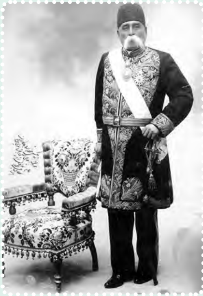
عبدالمجید میرزای عین الدوله

به هم ریخت؛ بازارها بسته شد و مردم در «مسجد شاه» گرد آمدند. در پی این تجمع، مردم نیرو گرفتند و کشمکش بین طرفداران استبداد و عدالت خواهان، شدت گرفت. دولت به وحشت افتاد و با پادرمیانی حاج میرزا ابوالقاسم امام جمعه، به طور موقت، قضیه فیصله یافت. حاج میرزا ابوالقاسم، داماد مظفرالدین شاه بود. او از جانب شاه به امامت جمعه تهران منصوب شده بود و از وی و دربار، پشتیبانی می کرد.