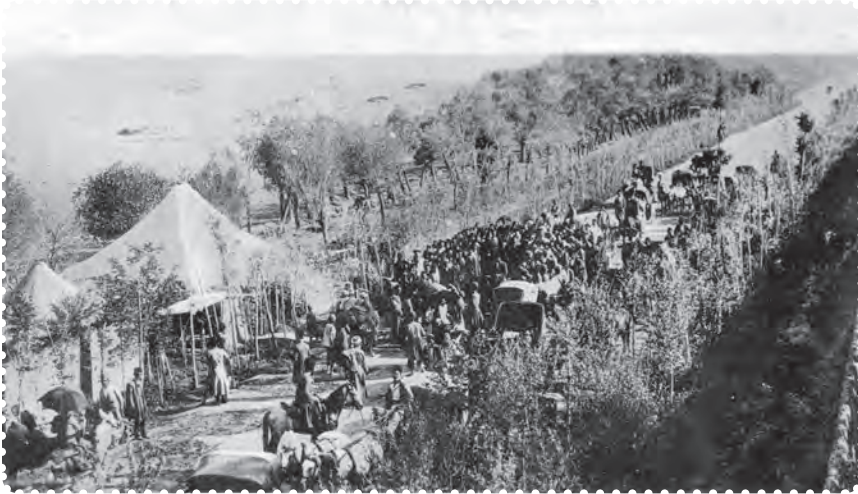
بازگشت علما از مهاجرت کبری

مظفرالدین شاه تسلیم خواسته‌های مردم شد. او عین‌الدوله را عزل کرد و فرمان تشکیل مجلس شورای ملی را در ۱۴ مرداد ۱۲۸۵ صادر کرد. هفت روز بعد، علما، با استقبال پرشکوه مردم، از قم بازگشتند. شهر چراغانی و جشن شادی به پا شد و در ۲۸ مرداد، اولین دوره مجلس شورای ملی با حضور نمایندگان تهران تشکیل گردید. عده‌ای از سیاستمداران مشروطه‌خواه، به تدوین قانون اساسی پرداختند ۱ . آنان با عجله آن را نوشتند و به امضای مظفرالدین شاه رساندند. شاه، ده روز پس از امضای قانون اساسی، درگذشت. به این ترتیب، کشور استبداد زده‌ی ما، با بهره‌گیری از اندیشه‌های سیاسی عالمان بزرگ دینی، کوشش فرهیختگان جامعه و مجاهدت مردم، به حکومتی دست یافت که می‌بایست براساس قانون اداره می‌شد.