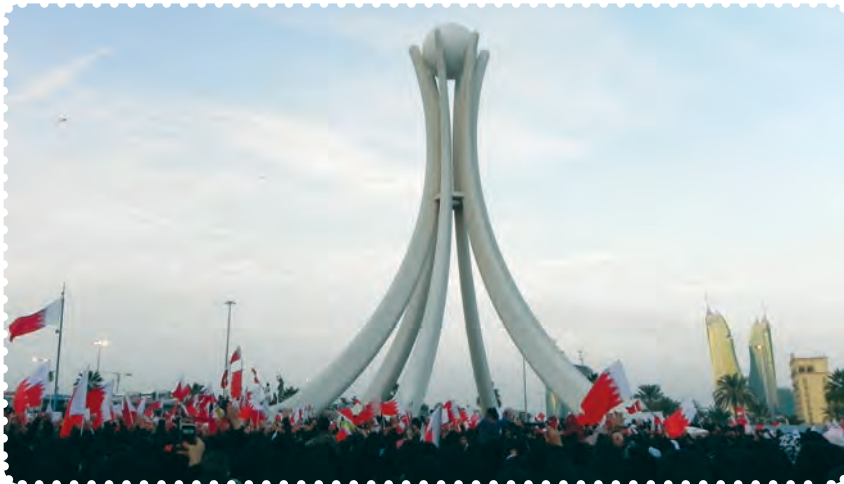
میدان لؤلؤ، نقطه آغازین قیام بحرینیان

و دگرگونی‌های جدید سیاسی در بحرین به حساب آورد. مردم بحرین به‌طور جدی خواستار انجام اصلاحات اساسی و برکناری حکومت آل خلیفه هستند و در این راه شهادت زیادی را تقدیم کرده‌اند ولی به دلیل حمایت خارجی از آن رژیم و سرکوب شدید مردم، انقلاب بحرین هنوز به نتیجه نرسیده است.