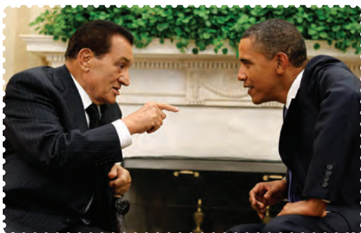
مبارک دیکتاتور مخلوع مصر و اوباما رئیس‌جمهور آمریکا

جامعه مصری از قدیم‌الایام ساختار مذهبی داشته و خاستگاه بسیاری از پیامبران الهی بوده است. از زمان ظهور اسلام تا دوران معاصر این کشور فارغ از کشاکش‌های سیاسی و مداخلات استعماری، از نظر اندیشه سیاسی و دینی رشد والایی داشته است و علما و متفکران بسیاری را در خود پرورش داده است.