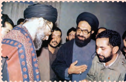
شهید عارف حسینی در محضر رهبر انقلاب اسلامی حضرت آیت الله خامنه‌ای

رهبر انقلابی شیعیان پاکستان و رهبر نهضت اجرای فقه جعفری پاکستان؛ وی از علما، دانشمندان و رهبران بیداری اسلامی پاکستان و شبه قاره هند است. او با تحصیل در حوزه علمیة نجف اشرف و حضور در کلاس‌های درس امام خمینی، در شمار یاران و پیروان امام خمینی درآمد. آشنایی وی با امام خمینی سرآغاز دگرگونی فکری و سیاسی او بود. وی در سال ۱۳۵۲ از عراق اخراج شد و به پاکستان بازگشت. در سال ۱۳۵۳ برای ادامه تحصیل راهی ایران شد و رهسپار حوزه علمیة قم گردید. وی به دلیل فعالیت‌های سیاسی در جهت نهضت امام خمینی توسط ساواک دستگیر و از ایران اخراج شد. در سال ۱۳۶۳ وی