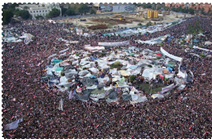
قیام مردم مصر در میدان التحریر (آزادی)

زبانہ کشید و بہ سرعت بہ مناطق دیگر ہم سرایت کرد. امواج سہمگین انقلاب مردم حسنی مبارک را مجبور بہ تسلیم و شکست کرد.