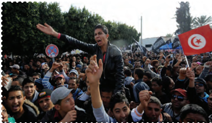
تظاهرات مردم تونس علیه دیکتاتور وابسته به غرب

الف) بیداری اسلامی در تونس: تونس کشوری اسلامی در شمال آفریقا است که در کنار دریای مدیترانه واقع شده است و به دلیل موقعیت جغرافیایی، سیاسی، تجاری و سوق‌الجیشی، نقش مهمی را در سیاست کلی آفریقا و کشورهای عربی برعهده دارد و به همین علت، از دیرباز مورد طمع قدرت‌های استعماری بوده است. به گونه‌ای که ژول فری، نخست وزیر اسبق فرانسه از تونس به عنوان «کلید خانهٔ فرانسویان» یاد می‌کند. ۱ فعالیت‌های سیاسی در تونس به دلایل مختلف، از جمله نزدیکی جغرافیایی با اروپا، آشنایی اکثریت مردم به زبان فرانسه، وجود مراکز متعدد آموزش عالی، رفت و آمد میلیون‌ها جهانگرد خارجی به‌خصوص اروپاییان، گسترش فعالیت مطبوعات و به‌طور کلی گسترش آگاهی‌های عمومی مردم، از سایر کشورهای منطقه و جهان عرب بیشتر است. کوشش مردم تونس برای کسب استقلال و آزادی پس از جنگ جهانی دوم افزایش یافت و دولت فرانسه به‌ناچار استقلال آن کشور را به رسمیت شناخت و در سال ۱۳۳۵ ش/ ۱۹۵۶ م به‌عنوان