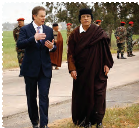
سرهنگ قذافی دیکتاتور پیشین لیبی در کنار نخست‌وزیر انگلستان