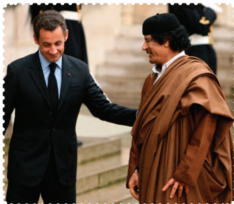
قذافی و سارکوزی رئیس جمهور پیشین فرانسه

پ) بیداری اسلامی در لیبی: کشور اسلامی لیبی در شمال آفریقا واقع شده است. حکومت لیبی به رغم داشتن شالوده‌های اولیه اسلامی، دارای نوعی ایدئولوژی سیاسی سکولار مبتنی بر پان عربیسم بود. سرهنگ معمر قذافی دیکتاتور لیبی، اسلام را ابزاری برای اجرای منویات خود می‌دانست. با بالا گرفتن قیام مردم لیبی، قذافی در نخستین واکنش، قیام‌کنندگان را مشی جوان وابسته به القاعده و مصرف‌کنندگان قرص‌های روان‌گردان توصیف کرد. با ورود ناتو در مسئله لیبی کفه قدرت به نفع مخالفان قذافی سنگینی کرد. سرانجام پس از ماه‌ها درگیری نظامی با سقوط طرابلس، حکومت قذافی سرنگون و خود او کشته شد. نکته جالب در مورد قذافی این است که وضعیت او بیش از هر دیکتاتوری به صدام شبیه بود.