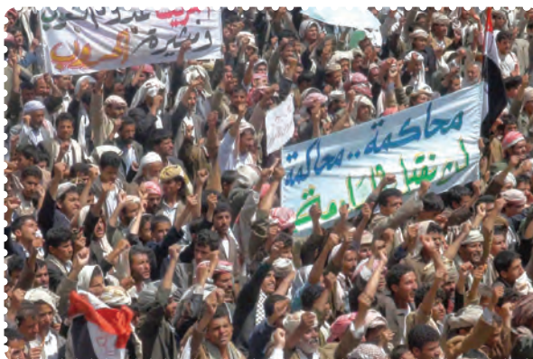
قیام مردم مسلمان یمن

ت) بیداری اسلامی در یمن: جمهوری یمن در جنوب شبه‌جزیره عربستان واقع است و دارای نژادهای عرب (۸۶ درصد)، ترک، هندی، ایرانی و سومالیایی است. بیش از ۵۰ درصد یمنی‌ها شیعی مذهب‌اند که غالباً در منطقه صعدة و شمال یمن ساکن‌اند. البته عمده شیعیان یمن زیدی‌اند که بعد از امام سجاد (ع)، زید بن علی (ع) را امام می‌دانند. مردم یمن در پی انقلاب‌های گوناگون در کشورهای اسلامی، اعتراضات و تظاهرات گسترده‌ای را در شهرهای مختلف علیه رژیم دیکتاتوری علی عبدالله صالح آغاز کردند که علی‌رغم طولانی و گسترده بودن مخالفت، با سرکوب شدید مواجه شدند. عاقبت علی عبدالله صالح از یمن گریخت ولی جانشین او نیز همان سیاست‌های غرب‌گرایانه را ادامه می‌دهد. انقلاب یمن همچنان آتش زیر خاکستر است.