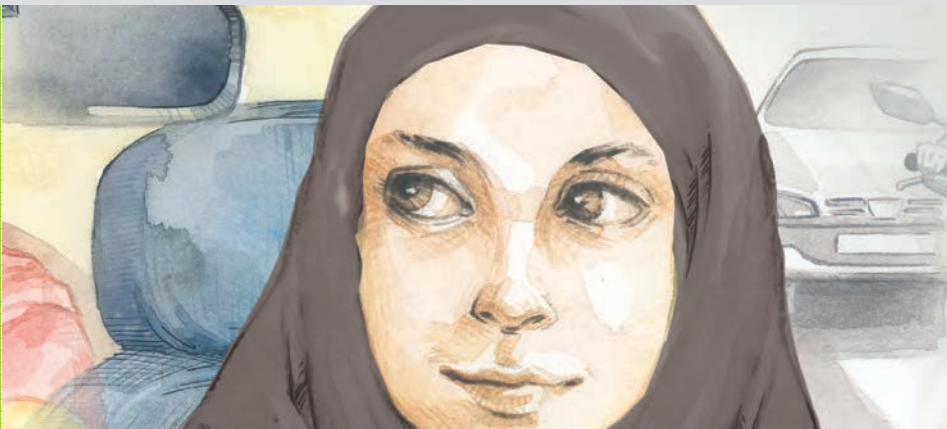
▲ نمای ۱: حس دختری