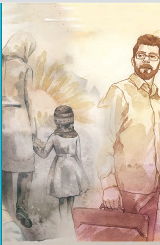
▲ نمای ۲: من و بابا و مامان