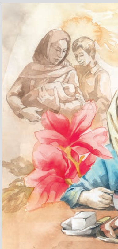
▲ نمای ۱: در جست‌وجوی هویت