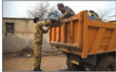
کمک‌رسانی به مردم سیل زده توسط سربازان غیور کشور