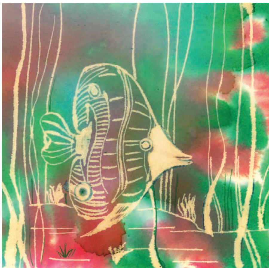
▲ تصویر ۵۷-ج - اثر دانشجو مهناز سیداختیاری