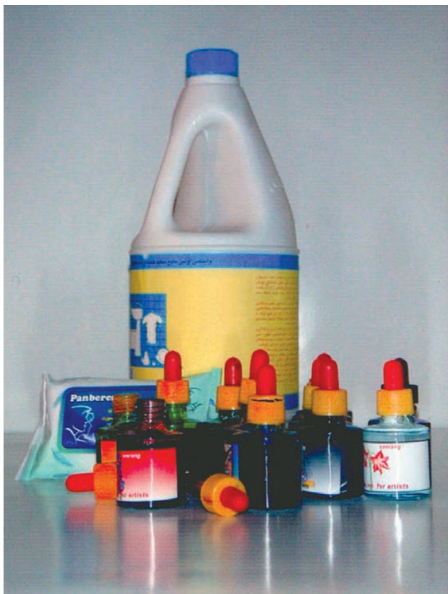
▲ تصویر ۵۴- در تصویر وسایل مورد نیاز شیوه جوهرهای رنگی و پاک‌کننده (سفیدکننده) دیده می‌شود

جوهرهای رنگی، دستمال کاغذی، پاک‌کننده، قلم موی الیاف مصنوعی و یا چوب کبریت (تصویر ۵۴).