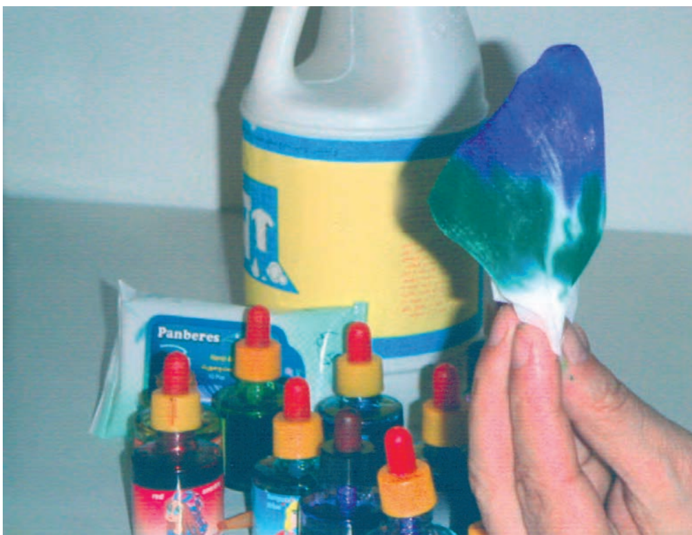
▲ تصویر ۵۶- الف - نشان دهنده مرحله دوم رنگ آمیزی با جوهرهای رنگی و پاک کننده است.