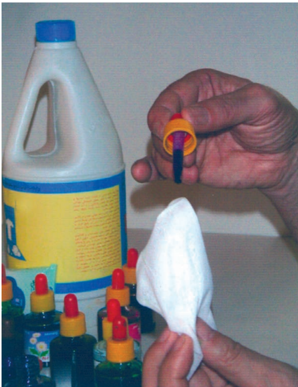
▲ تصویر ۵۵ - تصویر نشان دهنده مرحله اول شیوه جوهرهای رنگی و پاک‌کننده است که با قطره‌چکان بر دستمال کاغذی مرطوب اکولین می‌چکانیم

در این شیوه ابتدا دستمال کاغذی را با آب مرطوب می‌کنیم. سپس با استفاده از قطره‌چکان چند قطره از رنگ دلخواه را همان‌گونه که در تصویر ۵۵ مشاهده می‌کنیم بر روی دستمال کاغذی مرطوب که چند تا خورده می‌چکانیم. و با توجه به خیس بودن سطح دستمال رنگ به راحتی و به صورت اتفاقی بر سطح دستمال پخش می‌شود. و با همین شیوه رنگ‌های دیگر را به آن اضافه می‌کنیم. نتیجه حاصله رنگ‌هایی با شکل‌های غیرمنتظره و زیبا می‌باشد (تصویر ۵۶- الف و ب). بعد از این که رنگ‌گذاری به اتمام رسید، تای دستمال را به دقت باز نموده و صبر می‌کنیم تا کاملاً خشک شود و سپس با پاک‌کننده (سفیدکننده) بر روی آن طرح مورد نظر خود را اجرا می‌کنیم (تصویر ۵۶- الف تا ج). و طرح به صورت خطوط نگاتیو (سفید) بر سطح دستمال کاغذی بوجود می‌آید و پاک‌کننده به خوبی رنگ را پاک می‌کند.