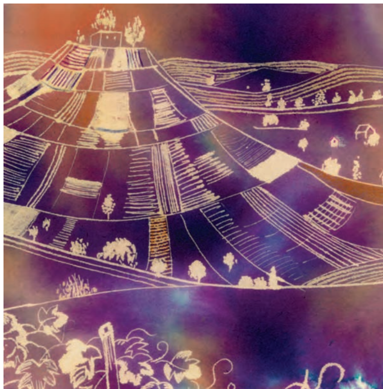
▲ تصویر ۵۷- ب - اثر دانشجو مهناز سیداختیاری