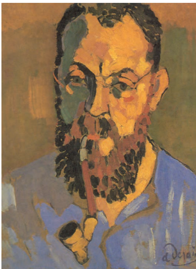
تصویر ۳-۹- اثر آندره دُرن، رنگ روغن روی بوم، (۳۵×۴۶ سانتی‌متر)

دُرن با به کارگیری مجموعه رنگهای اصلی و ثانویه، چهره هانری ماتیس نقاش فرانسوی را در حین کشیدن پیمپ نقاشی کرده است. او ابتدا طرح خود را به سطوح کلی، بر اساس تابش نور از سمت راست تفکیک کرده است. برای بخش نور، از رنگهای زرد، قرمز، نارنجی و قهوه‌ای و برای سایه‌ها، از رنگهای سبز، بنفش و آبی سود جسته است. دُرن با اشاره‌های خفیف مثل نور عینک در سمت چپ چهره و سایه زیر چشم در بخش راست چهره، از دو قسمتی شدن چهره به نور و سایه جلوگیری کرده است. همین‌طور پیمپ که دارای رنگهای نارنجی و قهوه‌ای است در بنفش پیراهن باعث چرخش کلی رنگها و هماهنگی تصویر می‌شود. دُرن، با این که از رنگهای خالص و ثانویه استفاده کرده ولی شکل به کارگیری رنگها و نحوه قلم زدن او، به حجم‌پردازی چهره کمک کرده است. از طرفی این رنگها توانسته‌اند چهره‌ای حساس و نگران را به ما نشان دهند.