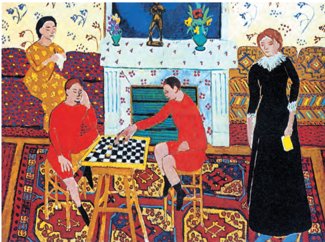
تصویر ۱۳-۳- اثر هانری ماتیس، رنگ روغن روی بوم، (۱۹۴×۱۴۳ سانتی متر)

تصویر (۱۳-۳) اثر هانری ماتیس که از مجموعه چهار پیکره در فضای بسته (اتاق) شکل گرفته است می‌تواند به شما کمک کند. شما نیز به صورت آزاد و با رنگهای اصلی و ثانویه، به صورت تخت، چند فیگور را در داخل فضایی مشخص ترکیب کنید. ماتیس در این اثر آزادی و راحتی نقاشی کودکان را دارد. از طرفی پختگی و تجربه زیاد در شناخت رنگها در ترکیب چند پیکره را به نمایش می‌گذارد. دقت کنید که با وجود حذف جزئیات پیکره‌ها و چهره‌ها و اشیاء، چگونه از نقوش فرش، کاغذ دیواری و مبلمانها، برای هماهنگی و چرخش رنگها استفاده کرده است. تصویر (۱۴-۳) نیز دارای همین ویژگیهاست.