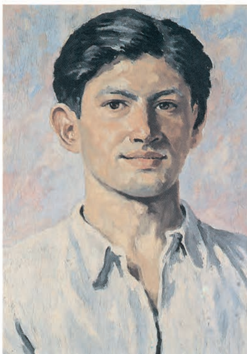
۳۹×۵۷ سانتی متر

تصویر ۲۱-۳- اثر محمود جوادی پور، رنگ روغن روی بوم