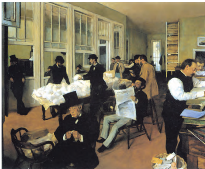
تصویر ۲۴-۳- اثر ادگار دگا، رنگ روغن روی بوم

رنگ کف اتاق در تضاد با دیوارها، گرمای فضای اتاق را که ناشی از جنب و جوش و فعالیت است بیشتر نشان می‌دهد. اگر دیوارها و کف اتاق را خاکستری رنگی بدانیم پیکره‌های انسانی با تیرگی لباسهایشان کاملاً جلوتر دیده می‌شوند. مجموعه رنگها، یعنی خاکستریهای رنگی مایل به سبز، آبی، قهوه‌ای و سفید در کنار رنگهای قهوه‌ای تیره، هرکدام عاملی در جهت چرخش چشم در سطح نقاشی هستند. تصویر (۲۵-۳) نمونه جالب دیگری برای این برنامه است.