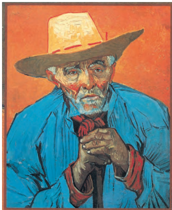
تصویر ۱۲-۳ اثر ونسان ون گوگ، رنگ روغن روی بوم، (۶۹×۵۶ سانتی‌متر)

طرح نهایی خود را به کمک خطوط بر بوم نقاشی اجرا کنید. بهتر است در مرحله نخست سطوح کلی تیره و روشن را از هم مجزا کنید. برای بخشهایی که نور به پیکره تابیده از رنگهای زرد – قرمز و نارنجی استفاده کنید و در سایه‌ها می‌توانید از رنگهای آبی، سبز و بنفش استفاده کنید. در تصاویر (۱۱-۳) و (۱۲-۳) به کارگیری رنگهای اصلی و ثانویه در جهت بیان حالات روحی به خوبی دیده می‌شود.