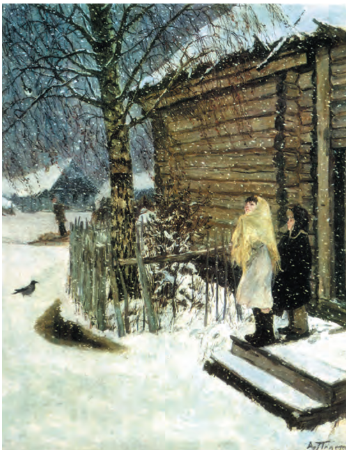
تصویر ۲۳-۳- اثر آرکادی پلاستف، رنگ روغن روی بوم، (۱۱۳×۱۴۶ سانتی متر)

تصویر (۲۳-۳) اثر پلاستف، یک روز برفی را نشان می دهد. دو کودک با شیفتگی به تماشای بارش برف ایستاده اند. این اثر از دو رنگ مکمل زرد و بنفش به همراه خاکستریهای رنگی حاصل از ترکیب دو رنگ، نقاشی شده است. رنگ زرد در روسری دخترک و بنفش در آسمان دیده می شود. زرد، به خاطر شدت درخشش نسبت به بنفش، وسعت سطح کمتری دارد. بین زرد و بنفش رنگ کلبه قرار دارد که از ترکیب این دو رنگ ساخته شده است و عامل چرخش چشم بین این دو رنگ است.