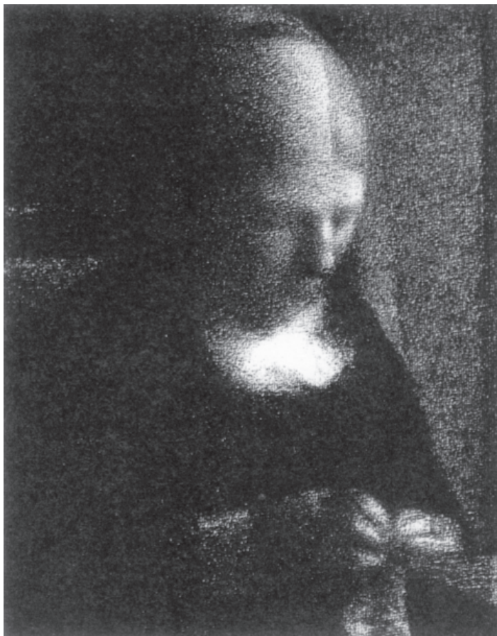
تصویر ۲-۳- اثر ژرژ سورا، زغال روی کاغذ، (۳۱×۲۴ سانتی‌متر)