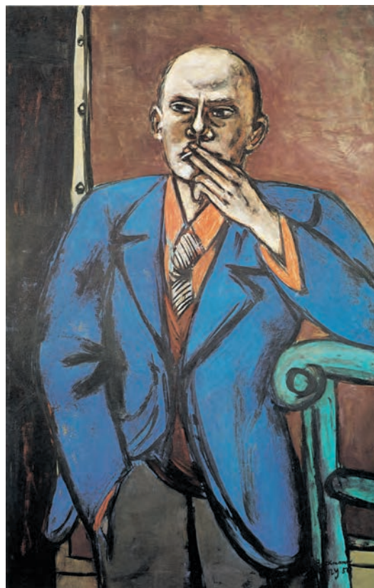
تصویر ۱۱-۳ اثر ماکس بکمان، رنگ روغن روی بوم، (۹۱/۴۴×۱۴۰ سانتی‌متر)