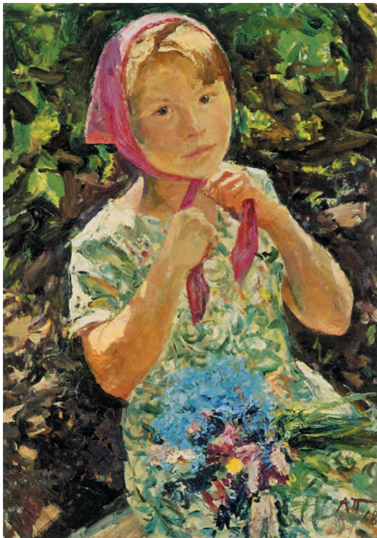
تصویر ۲۰-۳ — اثر آرکادی پلاستف، رنگ روغن روی بوم، (۷۰×۵۰ سانتی‌متر)

طرحی از او و نشانه‌هایی از فضای اطراف او، نظیر درختها و گلها و ... که حضور رنگهای سرد و گرم در آن دیده شود تهیه کنید. در این مرحله، می‌توانید از رنگهای گرم و سرد و ترکیبات آن استفاده کنید دقت کنید که وارد جزئیات نشوید و کلیت موضوع را در نظر بگیرید. بازتاب رنگهای طبیعت در پیکره و پوست و لباس و موهای مدل شما دیده خواهد شد. به تصویر (۲۰-۳) اثر آرکادی پلاستف ۱ نگاه کنید. پیکره در میان درختها نشسته است و روسری خود را محکم می‌کند. به‌خاطر نور شدید روز و بازتاب رنگ روسری، مجموعه‌ای از رنگ گرم مایل به قرمز را در چهره او مشاهده می‌کنیم. ولی در جای جای چهره و دستها بازتاب رنگ سبز لباس و برگهای اطراف را می‌بینیم. نقاش، به درستی از مجموعه رنگهای موجود بهره گرفته است تا در اثرش تعادل و هماهنگی رنگی ایجاد نماید.