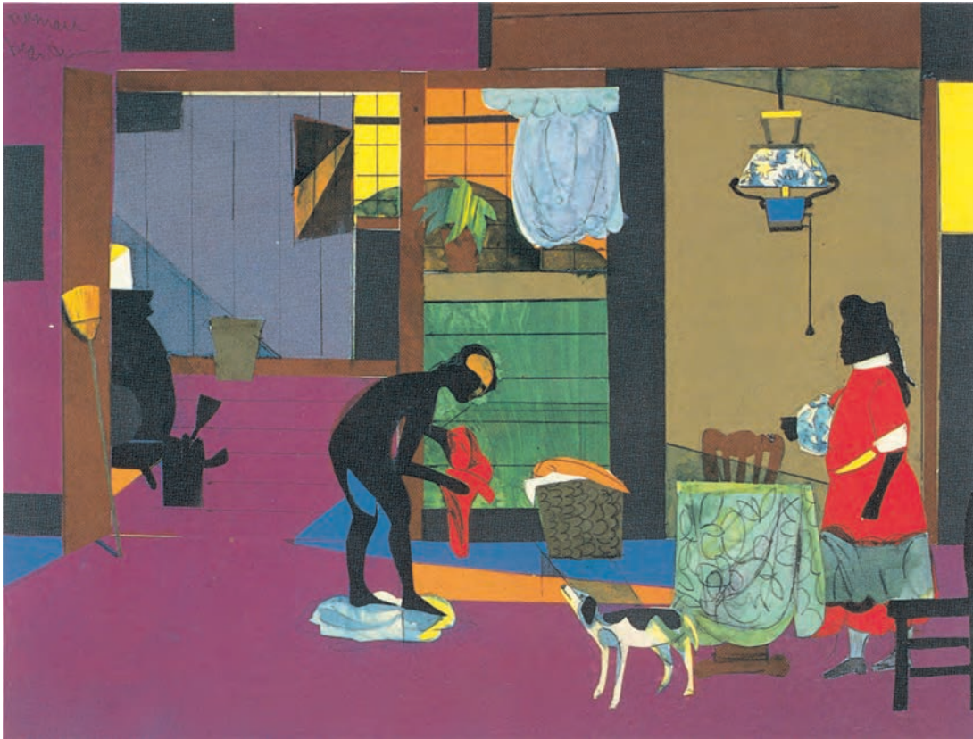
تصویر ۱۴-۳- اثر ژمار بردن ۱ ، کلاژ و ترکیب مواد، (۳۴/۹×۴۵/۱ سانتی متر)