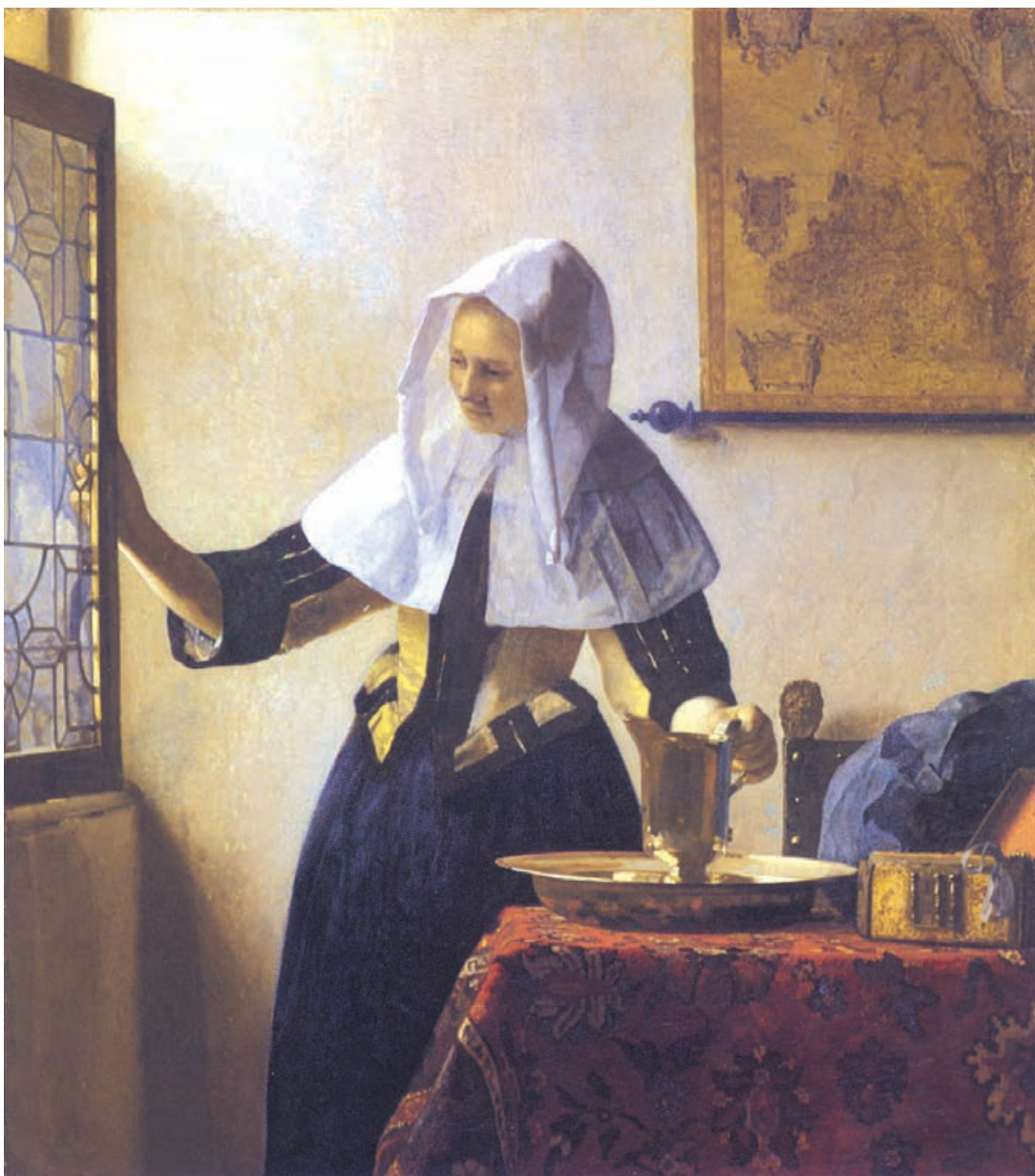
تصویر ۱-۳- اثر یان ورمیر ۱ ، رنگ روغن روی بوم، (۴۵/۷×۴۰/۶ سانتی متر)

سورا ۲ نقاش پست امپرسیونیست ۳ نیز، با استفاده از نورپردازی متمرکز در تصویر (۲-۳) توانسته است تیرگی و روشنیهایی بسیار جذابی را در اثر خود ایجاد نماید. وی، استادانه، تغییر مایه سیاه و سفید را به منظور القای عمق فضایی اثرش به کار گرفته است. شما هم می‌توانید در این مرحله از تأکید بر جزئیات دوری کنید. با تار کردن چشمها، تفکیک نور و سایه کلی در کار میسر خواهد بود. این کار باعث می‌شود تا کمتر به جزئیات بپردازید.