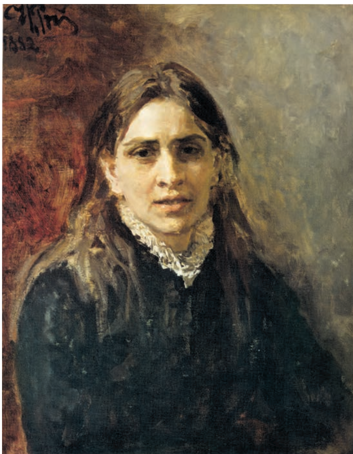
تصویر ۷-۳ اثر ایلیا ریپین ۱ ، رنگ روغن روی بوم، (۶۱×۵۰ سانتی متر)