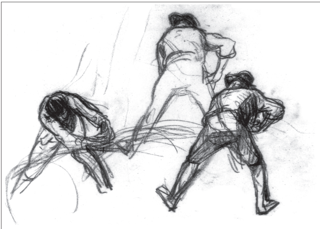
تصویر ۳-۳- اثر فرانسوا میله، طراحی بازغال