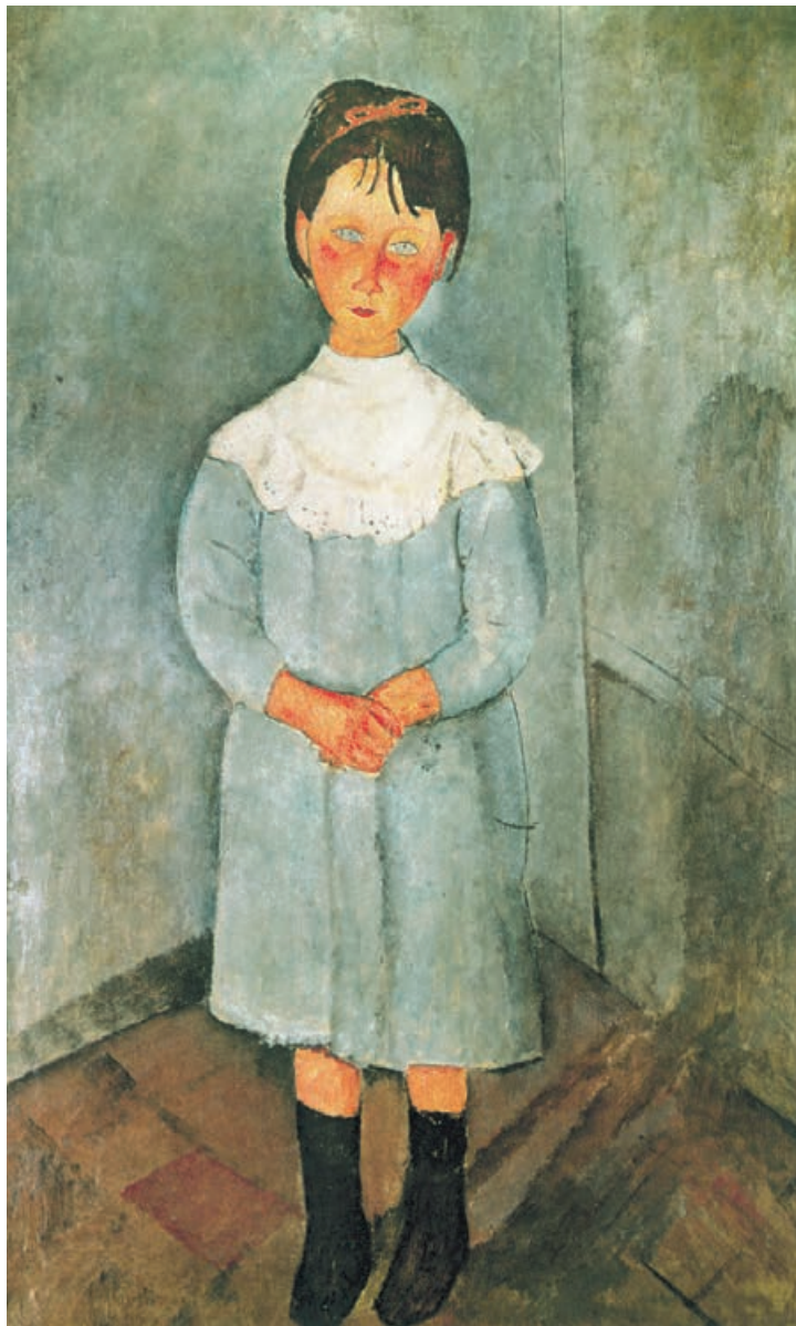
تصویر ۲۲-۳ اثر آمادئو مدیلیانی، رنگ روغن روی بوم، (۱۱۷×۷۲/۳۹ سانتی‌متر)

نقاش، طراحی خود را از دختر بچه با خطوط ظریف انجام داده است، دخترک، با سر کج و دستهای درهم، در کنج اتاق ایستاده است. او سپس بخش عمده نقاشی را با خاکستریهای رنگی مایل به آبی، سبز و بنفش پوشانده و کف اتاق قهوه‌ای و بنفش و دستها و صورت را زرد و نارنجی رنگ آمیزی کرده است.