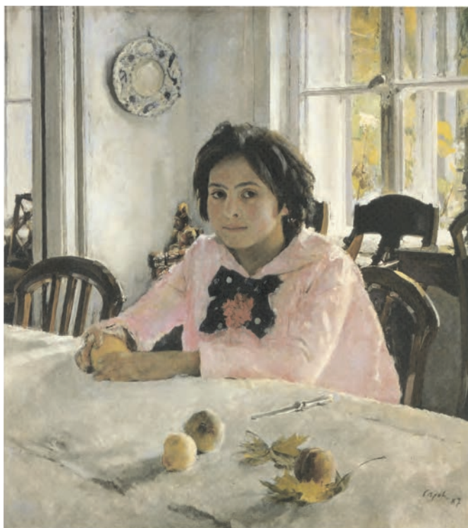
تصویر ۲۵-۳- اثر والتین سرف، رنگ روغن روی بوم، (۸۵×۹۱ سانتی‌متر)