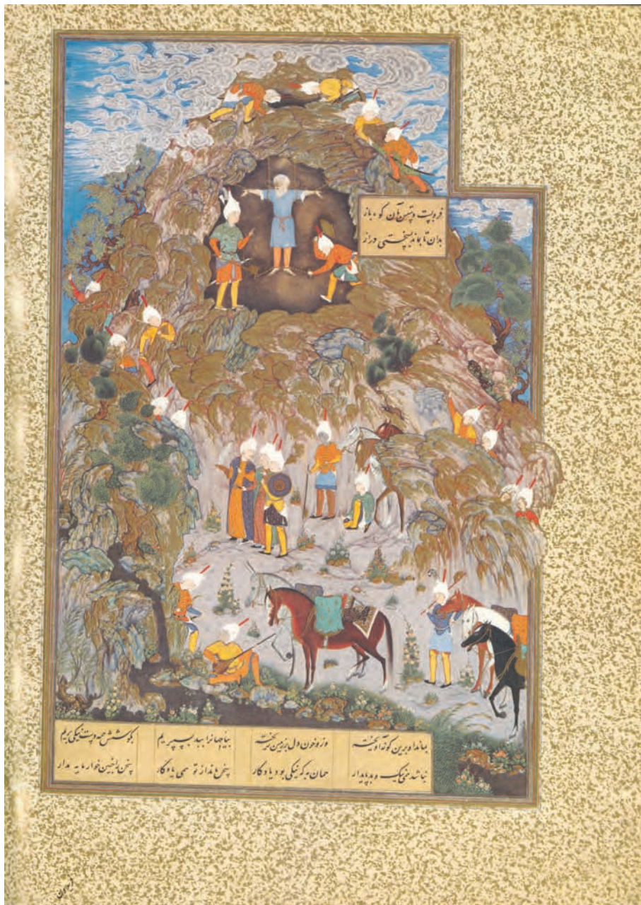
تصویر ۲۷-۳- اثر سلطان محمد، نسخه خطی شاهنامه طهماسبی، سده ۱۰ هجری

کار در کارگاه: نقاشی از انسان با خاکستریهای رنگی حاصل از ترکیب مکملها اهداف: