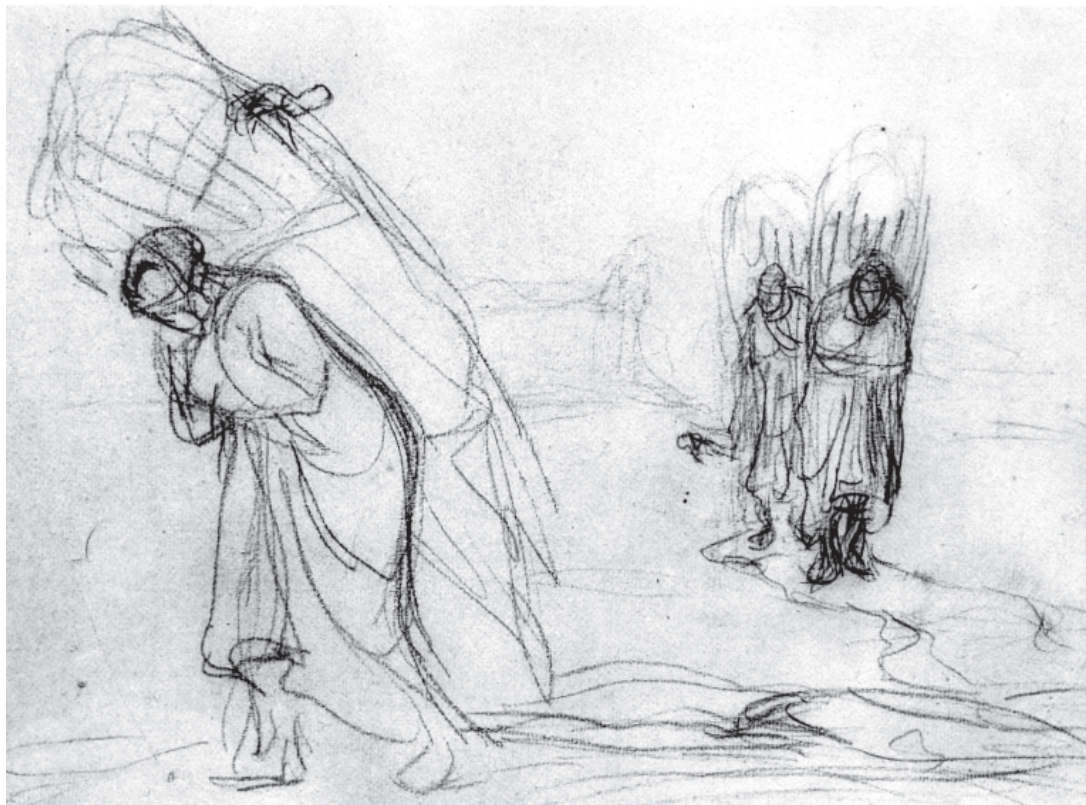
تصویر ۳-۴- اثر فرانسوا میله، طراحی بازغال