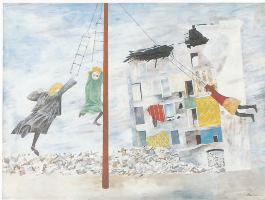
تصویر ۳۰-۳ اثر بن شان ۲ ، رنگ روغن روی بوم، (۷۵/۶×۱۰۱/۴ سانتی متر)