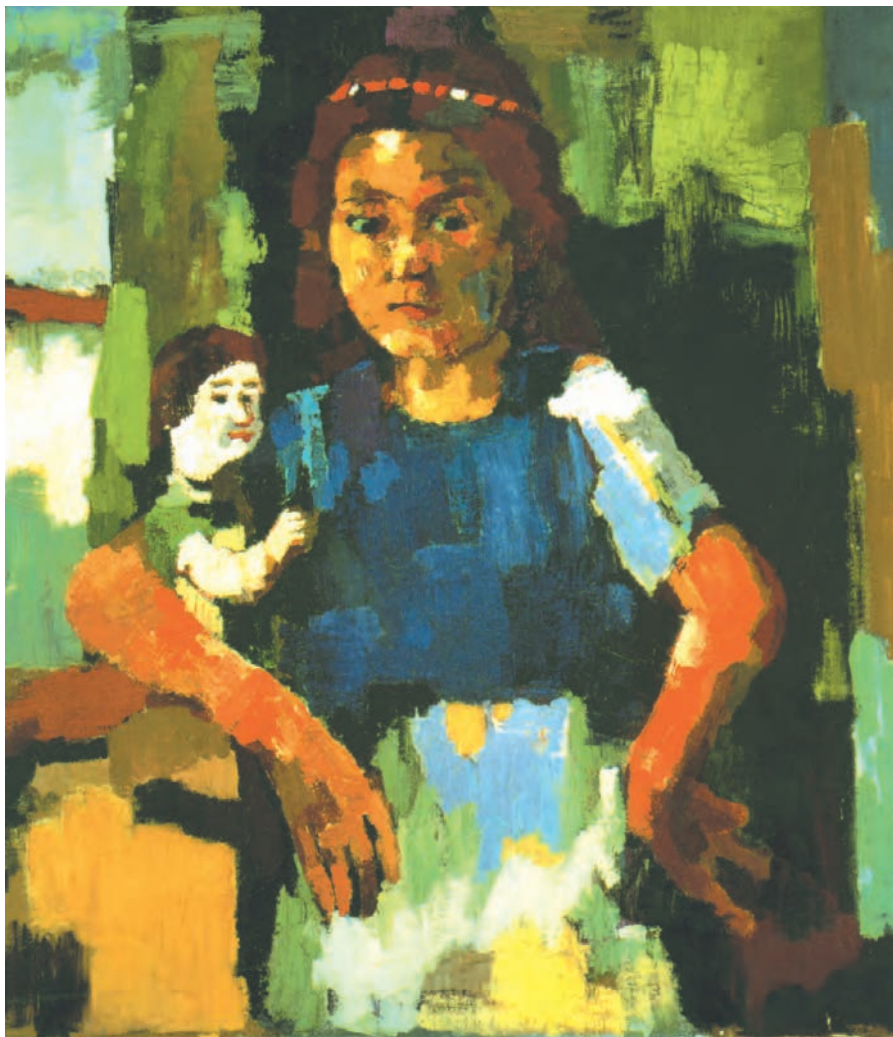
تصویر ۱۰-۳- اثر اُسکار کوکوشکا، رنگ روغن روی بوم

اُسکار کوکوشکا فقط به چهره نپرداخته، بلکه نیم تنه‌ای از یک دختر بچه با عروسکش را در کنار پنجره تصویر کرده است و نور را از سمت چپ به آن تابانده است، کوکوشکا نیز با وجود ساده کردن سطوح به کمک رنگ توانسته است حجم و فضایی را که دخترک ایستاده نشان دهد. گردش سبزه‌ها و همین‌طور رنگهای سفید، زرد، نارنجی و قهوه‌ای و سیاهها در تمام اثر، باعث احساس تعادل رنگی در چشم بیننده می‌شود.