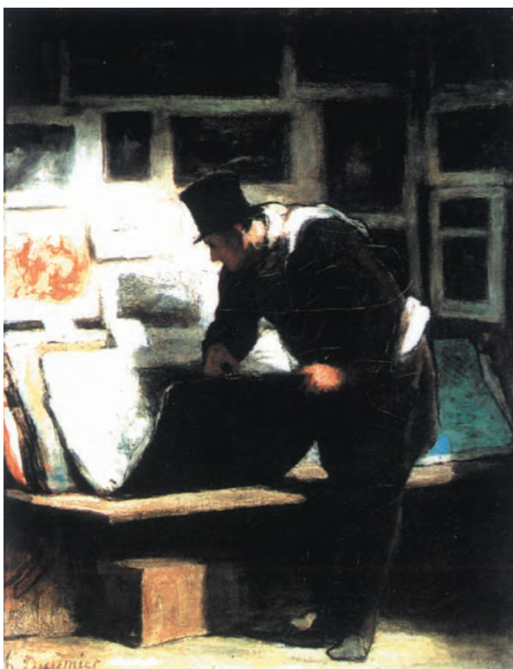
تصویر ۳-۶ — اثر انوره دومیه، رنگ روغن روی بوم

دومیه ۱ ، در تصویر (۳-۶) با تفکیک کلی فضای کار خود به روشنی و تیرگی به اثر خود عمق بخشیده است. او به پیکره انسان خیلی کلی پرداخته و از نمایش جزئیات پرهیز کرده است. چرخش روشنایی از قسمت جلوی تصویر تا سفیدی کاغذهای داخل پوشه تا کاغذهای پس‌زمینه، باعث چرخش چشم از جلو به عقب در تصویر است. دومیه با ترکیب رنگ سبز در خاکستریهای خود، قسمت پس‌زمینه اثر را که به وسیله بومها تقسیم بندی شده، به عقب برده است در نتیجه، پوشه کاغذها و کاغذهای کنار آن جملگی به خاطر روشنی زیاد، جلوتر دیده می‌شوند. در تصویر (۳-۷)، یک پرتره و تصویر (۳-۸)، فضای داخلی نمونه‌های دیگری از این تمرین را می‌توان دید.