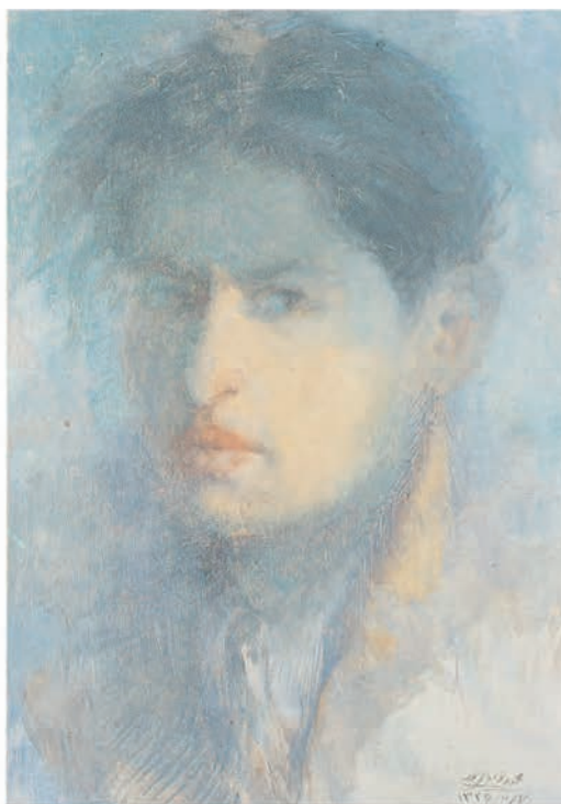
۳۷×۵۳ سانتی متر