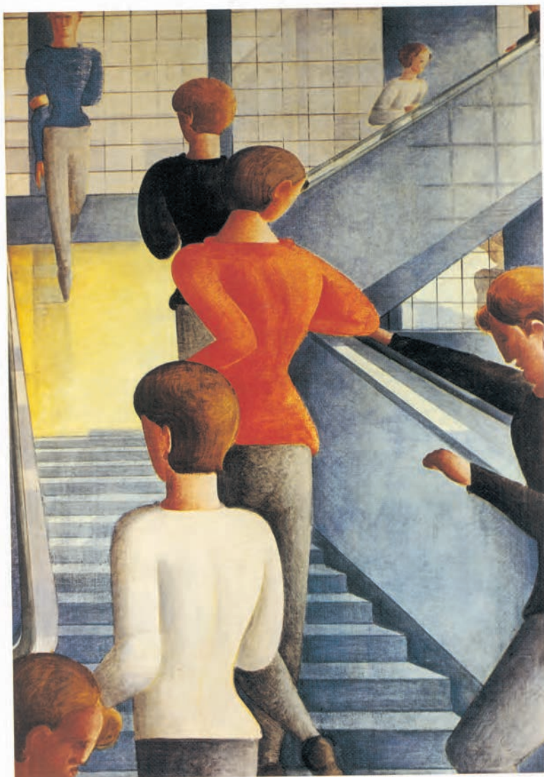
تصویر ۲۸-۳- اثر اسکار شلمر ۱ ، رنگ روغن روی بوم، (۱۱۴/۳×۱۶۲/۳ سانتی‌متر)

طرح خود را به کمک یک جفت رنگ مکمل مناسب با موضوع و خاکستریهای رنگی حاصل از ترکیب آنها، رنگ آمیزی کنید. در مرحلهٔ نخست، از یک جفت رنگ مکمل استفاده کنید تا بر تمامی خاکستریهای رنگی مسلط شوید. رفته رفته می‌توانید جفت مکملهای دیگر به آن اضافه کنید. استفاده از ترکیبهای بیشتر نیاز به تجربهٔ عملی بیشتر شما در این زمینه دارد. (تصاویر ۲۸-۳، ۲۹-۳ و ۳۰-۳) نمونه‌هایی از به‌کارگیری خاکستریهای حاصل از ترکیب مکملها می‌باشند.