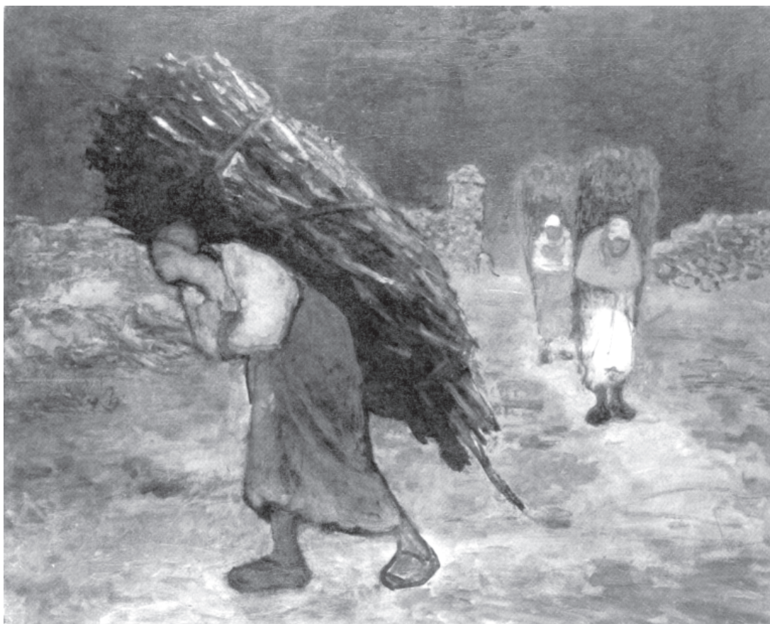
تصویر ۵-۳ — اثر فرانسوا میله، رنگ روغن روی بوم، (۷۸/۷×۹۷/۸ سانتی‌متر)

پیش طرح به شما کمک می‌کند تا هنگام اجرای کار با سیاه و سفید و خاکستریهای مابین با رنگ روغن، آمادگی داشته باشید. به تصویر (۵-۳) دقت کنید میله، در این اثر طرح خطی خود را با سیاه و سفید و تعداد محدودی خاکستری مابین در جهت حجم‌پردازی پوشانده است. توجه او بیشتر بر عناصر اصلی و نورپردازی کلی کار متمرکز بوده، به همین دلیل، از پرداختن به جزئیات چهره‌ها صرف‌نظر کرده است. ملاحظه می‌کنید که حال و هوای کلی کار چنان است که نقاش، در خود، نیازی به توجه به جزئیات احساس نکرده است. در این مرحله، شما نیز می‌توانید نقاشی خود را به همین روش آغاز کنید. یعنی به حالت و شکل کلی توجه داشته باشید و به جزئیات نپردازید. نورپردازی صحیح، شما را در جهت به‌دست آوردن تیرگی و روشنیها و نیز حجم‌پردازی کمک می‌کند. کار خود را در ابتدا به سطوح کلی سیاه و سفید و خاکستریهای مابین (به تعداد محدود) تفکیک کنید. بعد در محدوده تاریکیها، خاکستریهای مایل به سیاه و در روشنیها، خاکستریهای متمایل به سفید را جاگذاری کنید تا نتیجه بهتری بگیرید.