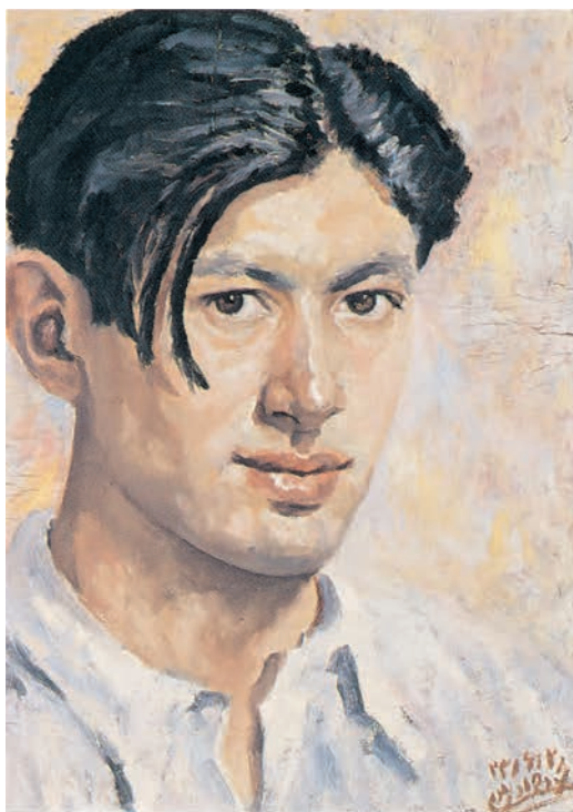
۳۰×۴۱ سانتی متر

در تصویر ۲۱-۳ چهار نقاشی از چهره هنرمند، اثر محمود جوادی پور استفاده از رنگهای گرم و سرد را در نورهای مختلف می بینیم. علی رغم این که ما محیط پیرامونی را نمی بینیم ولی بازتاب رنگهای اطراف به خوبی در چهره ها نمایان است.