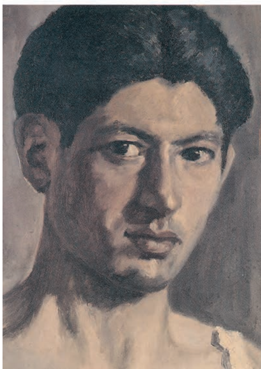
۲۷×۳۵ سانتی متر