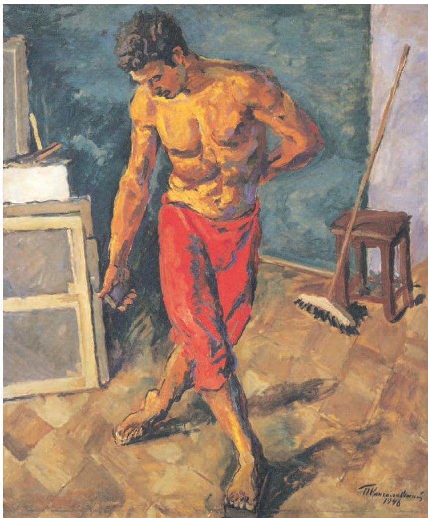
تصویر ۱۹-۳ — اثر پیوتر کانچالوفسکی ۱ ، رنگ روغن روی بوم، (۱۷۱×۱۴۳ سانتی‌متر)

مطابق آنچه پیش‌تر گفته شد پیش‌طرحی از مدل خود که با توجه به نورپردازی و فضا‌سازی محیط در آن، رنگهای گرم بر آن حاکمیت دارند، تهیه کنید. برای مثال می‌توانید مدل خود را به کمک نور مصنوعی که غالباً رنگهای گرم تولید می‌کنند نورپردازی نمایید و لباس و رنگ اشیای پس‌زمینه را مطابق خواست خود تغییر دهید. بازتابهای نور حاصل از شعله شمع و آتش نیز رنگهای گرم ایجاد می‌کنند. اینک، به کمک مجموعه رنگهای گرم دایره رنگ و ترکیبات آن می‌توانید طرح خود را بازسازی کنید. از سطوح کلی نور و سایه و تیره و روشن رنگ بهره بگیرید و رفته رفته سطوح بزرگ را به کمک رنگهایی با سطوح کوچکتر، از یکدیگر تفکیک کنید به گونه‌ای که رفته رفته حجم اشیای شما آشکار شود. در اینجا نیز در ابتدا اگر محدوده کوچکتری از رنگهای گرم را انتخاب کنید و پس از دست یافتن به مهارت بیشتر رفته رفته رنگهای دیگر را به آن بیفزاید نتیجه بهتری حاصل خواهد شد (تصویر ۱۹-۳).