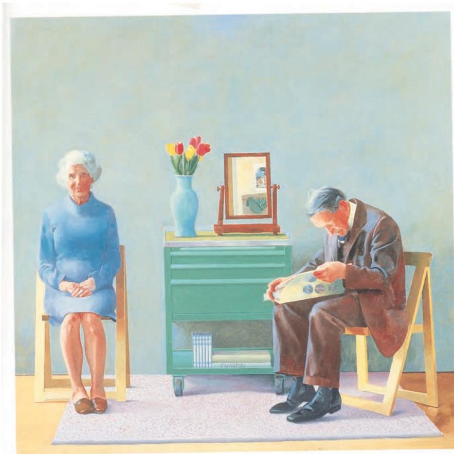
تصویر ۲۹-۳ اثر دیوید هاکنی ۱ ، رنگ روغن روی بوم، (۱۸۳×۱۸۳ سانتی متر)