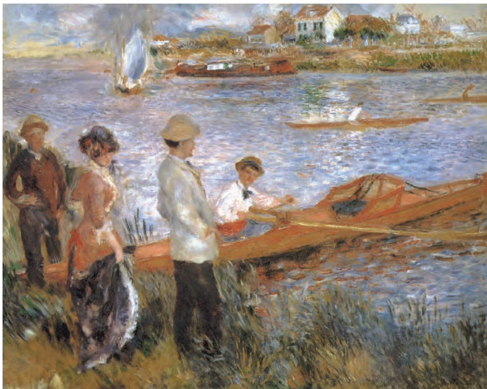
تصویر ۱۵-۳- اثر اگوست رنوار، رنگ روغن روی بوم