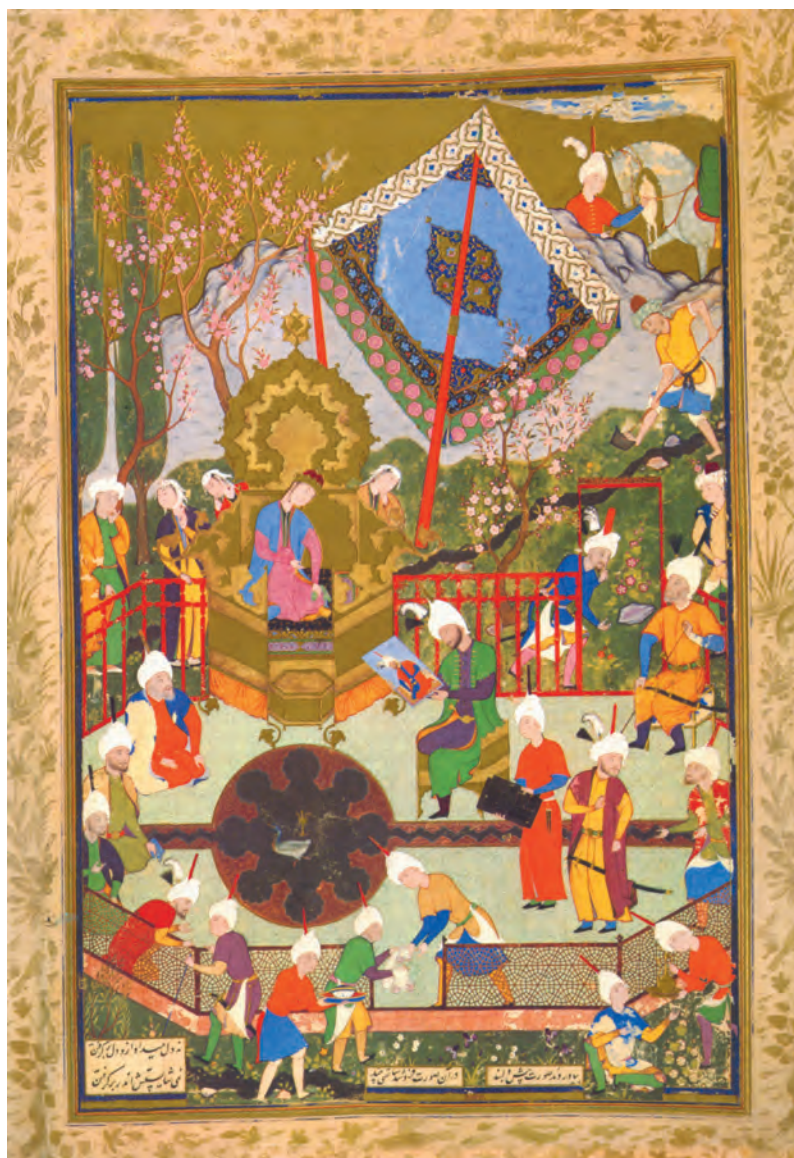
تصویر ۲۶-۳- اثر میرزا علی، نسخه خطی خمسه نظامی، سدهٔ ۱۰ هجری

رنگهای اصلی و ثانویه، در سطح اثر پخش شده‌اند و برای این‌که چشم، تمام تصویر را ببیند، خاکستریهای رنگی، در واقع عاملی برای چرخش چشم و تقویت رنگهای اصلی می‌شوند.