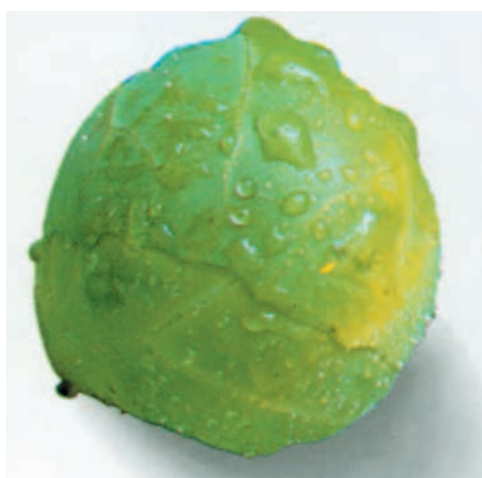
شکل ۸۷-۱- یک تکمه کلم را نشان می‌دهد.