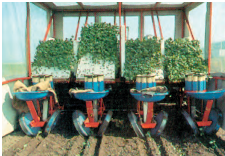
شکل ۹۴-۱- دستگاه نشاکار

– پس از نشاکاری، اطراف بوته‌ها را قدری سفت کنید. تذکر: نشاکاری را حتی المقدور در عصر و در صورت امکان در یک روز ابری انجام دهید (شکلهای ۹۴-۱ و ۹۵-۱ و ۹۶-۱).