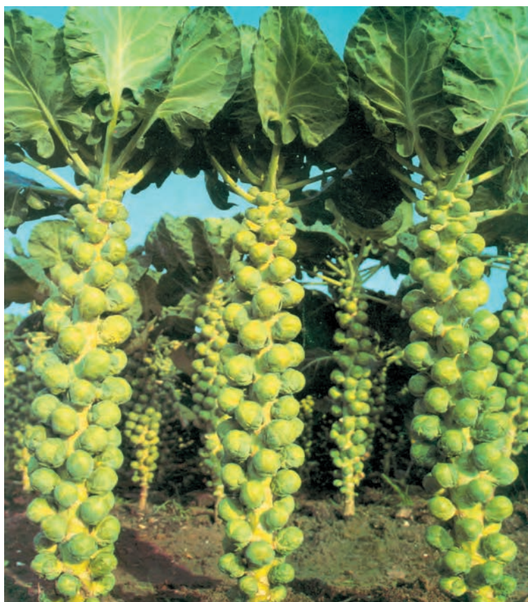
شکل ۸۶-۱- تکمه‌ها را روی گیاه کلم تکمه‌ای نشان می‌دهد.

- گیاهی از خانواده چلیپاییان ۱ و از جنس براسیکا ۲ و گونه براسیکا اولرسه ۳ و از واریته ژمنیفر ۴ است (شکلهای ۸۶-۱ و ۸۷-۱).