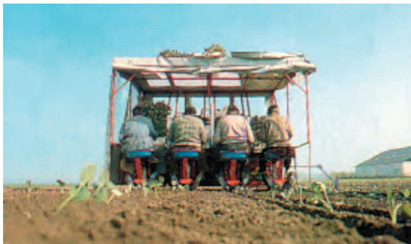
شکل ۹۵-۱- نشاکاری توسط ماشین را نشان می‌دهد.

واحد کار: تولید و پرورش کلم دکمه‌ای شماره شناسایی: ۱۱۳-۲۱۰۲۱۰۲۱۳۱