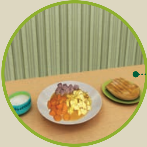
غذای شماره‌ی ۲

غذاهای موجود در تصاویر را مشاهده کنید، سپس آن را در جدول زیر طبقه‌بندی کنید.