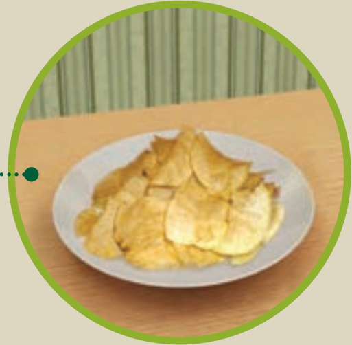
غذای شماره‌ی ۱

اکنون با توجه به جدول بگویید، کدام یک، وعده غذایی مناسب‌تری است؟ چرا؟