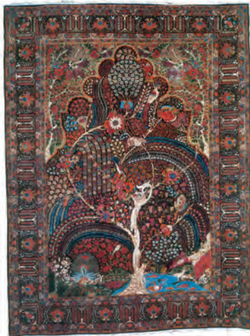
قالیچه کرمان - دوره قاجار