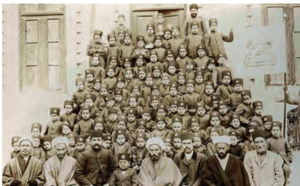
معلمان و دانش آموزان مدرسه رشديه تهران

به نظر شما چرا امیرکبیر دستور داد، استادان و معلمان مدرسه دارالفنون از کشورهایی غیر از روسیه و انگلستان (مانند فرانسه و اتریش) استخدام شوند؟