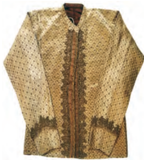
نمونه‌ای از لباس‌های دوره قاجار

قاجار به پهلوی، ایران را درست در زمان اوج‌گیری علم، صنعت و تولید اروپاییان، به عقب‌ماندگی مضاعف دچار کرد. بدین ترتیب با آغاز مسابقه علمی، اقتصادی و صنعتی دوره مدرن، ایران به کلی از گردونه رقابت بیرون رفت.