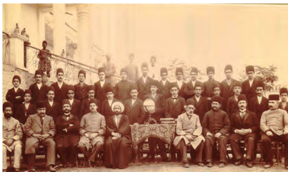
معلمان و استادان مدرسه علوم سیاسی - این مدرسه را میرزا نصرالله خان مشیرالدوله در زمان مظفرالدین شاه به منظور تربیت نیروهای سیاسی وزارت امور خارجه تأسیس کرد.

دارالفنون یکی از مدارس بود که با هدف آموزش علوم مختلف و فنون جدید به دانشجویان ایرانی، در داخل کشور و با ایده و پیگیری امیرکبیر، تأسیس شد. امیرکبیر قصد داشت تا آموزش دانشجو در داخل کشور را جایگزین فرستادن آنها به خارج کند تا از این طریق، بتواند بر محتوا و اساتید و روش های تدریس، نظارت بیشتری داشته باشد. اگرچه وی تأسیس این مدرسه را به چشم خود ندید و مدتی کوتاه پس از افتتاح مدرسه، بر اثر توطئه چینی ها و به دست برخی افراد سودجو به قتل رسید.