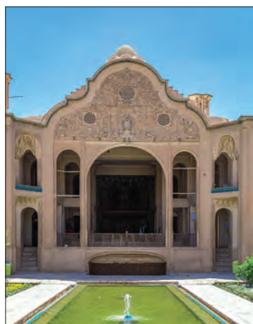
خانهٔ بروجردی‌ها - کاشان

سنت معماری ایرانی اسلامی که در دوران سلجوقی، تیموری و صفویان درخشش بی‌نظیری داشت، در عصر قاجار با توجه به شرایط اقلیمی و آب و هوایی و نوع مصالح ساختمانی تداوم یافت. پس از اختراع دوربین عکاسی، مسافرانی که در عصر ناصری به اروپا می‌رفتند، تصاویر زیادی از بناهای آن سرزمین با خود به ایران آوردند. بسیاری از معماران به سفارش دربار و ثروتمندان با استفاده از برخی از عناصر معماری فرنگی و تلفیق آن با معماری ایرانی، سبکی از معماری را به وجود آوردند که در آن عناصر و ویژگی‌های معماری ایرانی و اروپایی ترکیب شده بود. این بناها که به بناهای «کارت پستالی» معروف شد، بیشتر به تقلید از بناهای اروپایی ساخته می‌شدند. یکی از این بناهای معروف، کاخ شمس‌العماره واقع در مجموعهٔ کاخ گلستان است که به دستور ناصرالدین‌شاه ساخته