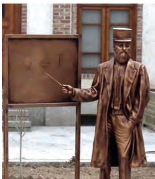
تندیس میرزا حسن رشديه

میرزا حسن رشديه یکی از شخصیت های فرهنگی عصر قاجار بود که برای تأسیس مدرسه های جدید به ویژه در دوره تحصیلی ابتدایی در شهرهای مختلف ایران بسیار تلاش کرد و در این راه رنج ها و سختی های فراوانی کشید. هدف رشديه از برپایی مراکز آموزشی جدید، فراهم آوردن شرایط برای سوادآموزی به فرزندان تمام قشرهای مختلف جامعه بود.