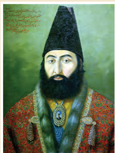
نگاره امیر کبیر اثر محمد ابراهیم نقاش باشی

به دنبال سقوط صفویان، هنر نگارگری نیز در سایه جنگ‌های داخلی رو به افول نهاد. نقاشی در عصر قاجاریه به دنبال وحدت سیاسی و استقرار امنیت و در سایه حمایت پادشاهان و دربار از یک سو و ارتباط با غرب از سوی دیگر، دچار تحولی اساسی شد. فتحعلی‌شاه برجسته‌ترین هنرمندان نقاش را در تهران گرد آورد و آنها را به کشیدن پرده‌های بزرگ برای نصب در کاخ‌ها تشویق کرد.