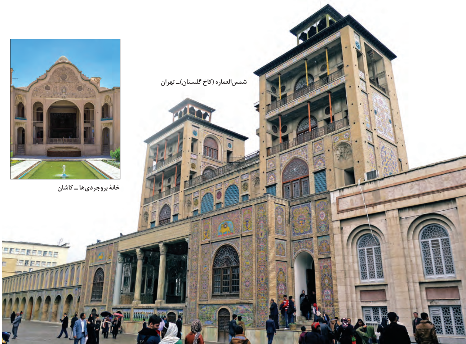
شمس‌العماره (کاخ گلستان) - تهران