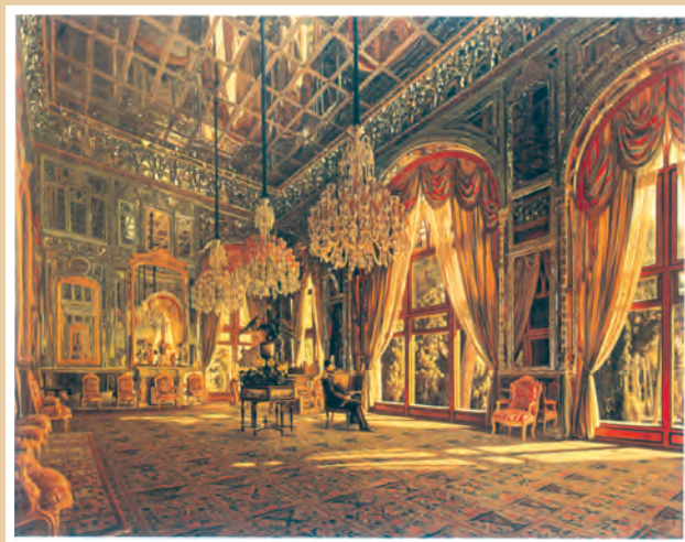
تابلوی تالار آینه اثر کمال‌الملک، نقاش عصر قاجار و پهلوی

در دوره ناصرالدین‌شاه، سنت نگارگری ایرانی تحت تأثیر هنر نقاشی مدرن اروپایی قرار گرفت. سبک نوینی در نقاشی به وجود آمد و نقاشان بزرگی مانند محمد غفاری معروف به کمال‌الملک، پا به عرصه نهادند.