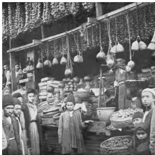
بازار و تجارت در دوره قاجار