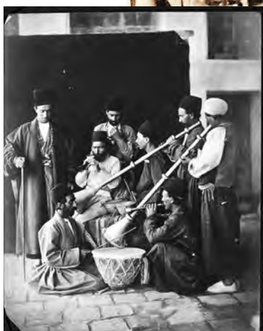
مراسم تعزیه خوانی در تکیه دولت - تهران