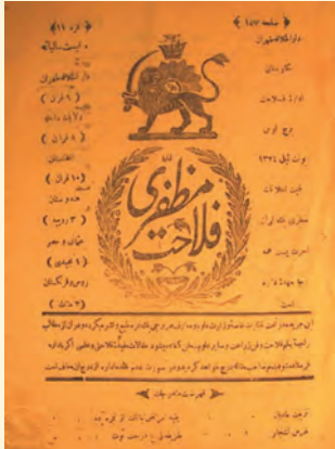
روزنامه فلاح مظفری

متن زیر را بخوانید و به پرسش‌های مربوط به آن پاسخ دهید.