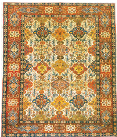
قالیچه بافته شده در آذربایجان - دوره قاجار

طلا و نقره برای تأمین مالی واردات کالا از اروپا و سایر کشورها نیز تأثیر بسزایی بر رونق صادرات فرش به عنوان کالای جایگزین داشت. شهرهای تبریز، کاشان، همدان، اصفهان، کرمان، اراک و ولایت‌های کردستان و آذربایجان از مهم‌ترین مراکز قالی‌بافی در دوره قاجار بودند. تجار داخلی و سرمایه‌گذاران خارجی در شهرهای تبریز و اراک کارگاه‌های کوچک و بزرگ فرش دایر کرده بودند.