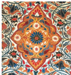
نمونه‌ای از پارچه‌های دوره قاجار

در وضعیت مطلوبی بودند. با پایان یافتن جنگ در اروپا و سرازیر شدن سیل کالاهای اروپایی، صنایع دستی ایران به تدریج رو به انحطاط رفت. بسیاری از اروپاییان که در این زمان از ایران دیدن کرده‌اند، از نابودی و ضعف مراکز قدیمی و پررونق صنایع دستی ایران مثل کاشان، اصفهان، شیراز، کرمان و یزد خبر داده‌اند. کالاهای اروپایی، به ویژه محصولات صنعتی انگلستان، صدمه شدیدی به صنایع ایران وارد آورد. در دوره صدارت امیرکبیر تلاش‌های زیادی برای احیای صنایع دستی ایران صورت گرفت اما با کشته‌شدن او این تلاش‌ها پیگیری نشد. حکومت‌های بی‌تدبیر و وابسته در ایران اجازه دادند تا شرکت‌ها، مستشاران و محصولات اروپایی به صورت بی‌برنامه وارد کشور شوند و در نتیجه پایه‌های تولید داخلی ضعیف شد. تداوم این نگاه از