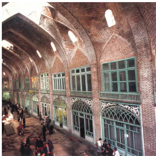
تیمچه مظفریه - تبریز

یکی از گروه‌های اجتماعی عصر قاجار، که در شهرها و روستاها زندگی می‌کردند، روحانیون بودند. آنان از دیرباز به دلیل بافت و ساختار مذهبی جامعه سنتی ایران در میان اقشار مختلف مردم نفوذ فراوانی داشتند و متکفل امور دینی بودند. روحانیون به سبب نظارت بر موقوفات و دریافت وجوهات شرعی از نظر مالی مستقل از حکومت بودند. معمولاً این قشر به دلیل عدم وابستگی به حکومت و آموزه‌های دینی، در مقاطعی از تاریخ معاصر ایران در برابر قدرت‌های خارجی ایستادگی کردند و اقدامات شاهان و درباریان قاجار را به چالش کشیدند.