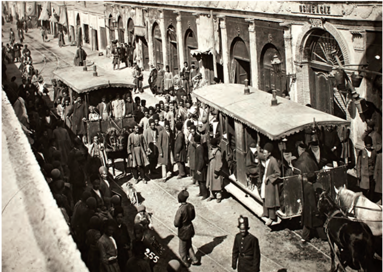
خیابان چراغ گاز (امیرکبیر کنونی) تهران - دوره قاجار

آشنایی با اوضاع اجتماعی، تحولات اقتصادی و جنبه‌های مختلف حیات علمی و فرهنگی ایران دوره قاجار نظیر هنر و معماری، از مباحث مهم و کلیدی در مطالعات تاریخی این دوره محسوب می‌شود. شما در این درس با استفاده از شواهد و مدارک تاریخی، برخی از وجوه زندگی اجتماعی، اقتصادی و فرهنگی عصر قاجار را بررسی و تحلیل خواهید کرد.