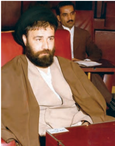
حاج سید احمد آقا خمینی

حجت‌الاسلام سید احمد خمینی در ۲۴ اسفند ۱۳۲۴ در قم به دنیا آمد. تحصیلات دوره ابتدایی و متوسطه را در زادگاهش گذراند و از دبیرستان حکیم نظامی قم در رشته طبیعی (علوم تجربی) دیپلم گرفت. هم‌زمان با تحصیل در دبیرستان، ورزش فوتبال را نیز با جدیت دنبال کرد. ایشان پس از اخذ دیپلم، تحصیلات حوزوی را پی گرفت. قیام ۱۵ خرداد ۱۳۴۲، علاقه‌اش به سیاست و عزمش را به مبارزه با حکومت پهلوی بیش از گذشته آشکار ساخت. حاج سید احمد آقا از سال ۱۳۴۳ و به دنبال دستگیری و تبعید رهبر نهضت اسلامی، امام خمینی، و برادر بزرگش، حاج آقا مصطفی خمینی، به ترکیه و سپس عراق، مسئولیت‌های سنگینی را در خانواده حضرت امام و نیز در عرصه مبارزه با حکومت ستم‌شاهی بر عهده گرفت. به همین دلیل ساواک فعالیت‌هایش را زیر نظر گرفته بود. با این حال، او با تیزبینی و درایت دستورات امام را انجام می‌داد.