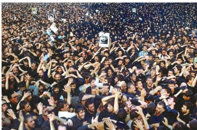
نمایی از تشییع جنازه میلیونی امام خمینی علیه‌السلام

امام خمینی در شامگاه ۱۳ خرداد ۱۳۶۸ بعد از یک دوره بیماری در ۸۷ سالگی از دنیا رفتند. خبر ارتحال حضرت امام را یادگار گرامی ایشان حجت‌الاسلام سید احمد خمینی صبح روز بعد به اطلاع مردم ایران و جهان رساند. دو روز بعد، پیکر مطهر امام شهیدان در میان حزن و اندوه میلیون‌ها نفر از تشییع‌کنندگان در بهشت زهراي تهران به خاک سپرده شد. بلافاصله پس از رحلت بنیان‌گذار جمهوری اسلامی ایران، مجلس خبرگان رهبری تشکیل جلسه داد و با اکثریت قریب به اتفاق آرا، حضرت آیت‌الله سید علی خامنه‌ای را به دلیل داشتن شرایط و ویژگی‌های مندرج در اصل یکصد و نهم قانون اساسی ۱ به مقام رهبری برگزید (۱۴ خرداد ۱۳۶۸).