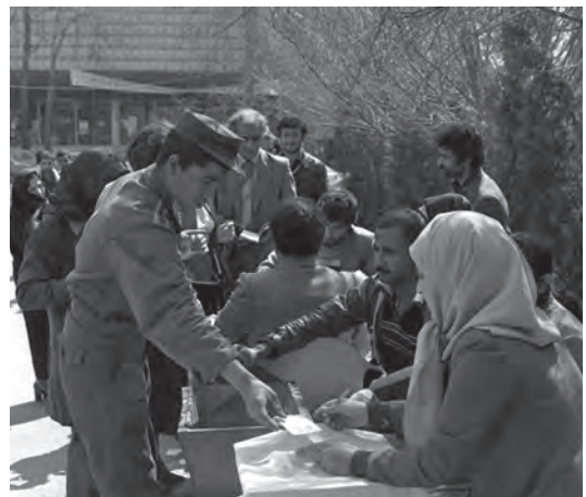
همه‌پرسی جمهوری اسلامی ۱۰ و ۱۱ فروردین ۱۳۵۸