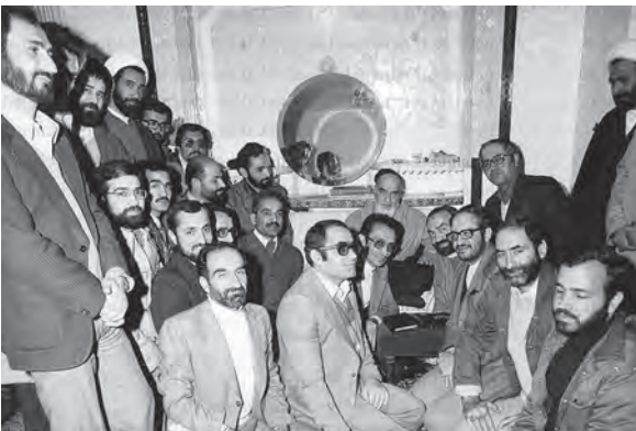
اعضای هیئت دولت شهید محمدعلی رجایی در دیدار با حضرت امام خمینی

پس از شروع به کار مجلس شورای اسلامی، ابتدا محمدعلی رجایی به عنوان نخست‌وزیر معرفی گردید و سپس وزرای معرفی شده توسط او از مجلس شورای اسلامی رأی اعتماد گرفتند؛ دولت دائم بر سر کار آمد و مدیریت امور کشور را از شورای انقلاب تحویل گرفت.