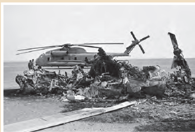
بقایای لاشه هواپیماها و بالگردهای آمریکایی در طیس