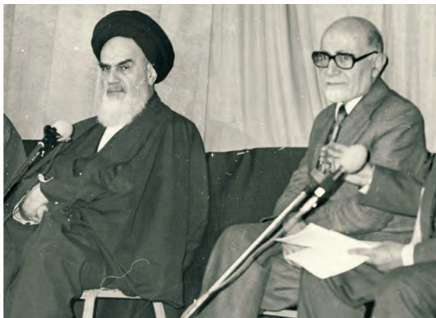
مهندس مهدی بازرگان، رئیس دولت موقت انقلاب، در کنار امام خمینی ره

این همه‌پرسی روزهای ۱۰ و ۱۱ فروردین ۱۳۵۸ برگزار شد و نتیجه آن که در ۱۲ فروردین اعلام شد، نشان داد که بیش از ۹۸ درصد شرکت‌کنندگان به جمهوری اسلامی رأی مثبت داده‌اند. به همین دلیل، ۱۲ فروردین در تقویم به عنوان روز جمهوری اسلامی نام‌گذاری شده است.