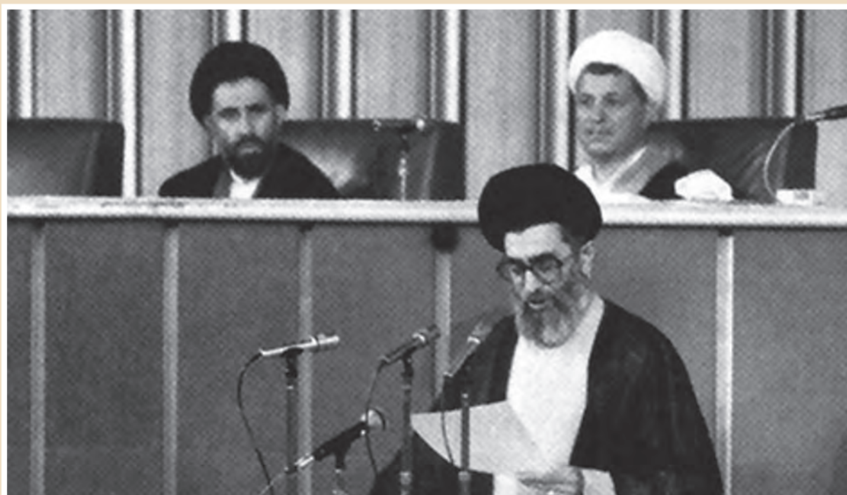
حضرت آیت‌الله خامنه‌ای هنگام خواندن وصیت‌نامه حضرت امام در مجلس خبرگان ۱۴ خرداد ۱۳۶۸

و مسئولیت‌های خطیری را عهده‌دار شدند که از جمله آنها دو دوره ریاست جمهوری است. معظم‌له در تیر ۱۳۶۰، هدف حمله تروریستی مجاهدین خلق قرار گرفتند که به شدت جراحت برداشتند و به شرف جانبازی انقلاب اسلامی نایل آمدند. خبرگان ملت بر اساس چنین ویژگی‌ها و سوابقی، ایشان را برای رهبری انقلاب اسلامی، صالح، شایسته و لایق تشخیص دادند.