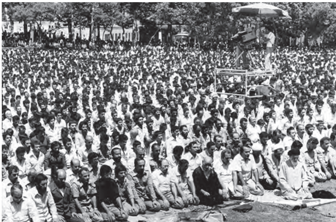
اقامه نخستین نماز جمعه تهران به امامت آیت‌الله طالقانی در دانشگاه تهران

در بُعد آیینی و مناسکی نیز اولین نماز جمعه به امامت آیت‌الله طالقانی (۵ مرداد ۱۳۵۸) در تهران و سپس به تدریج در سایر شهرستان‌ها اقامه گردید.