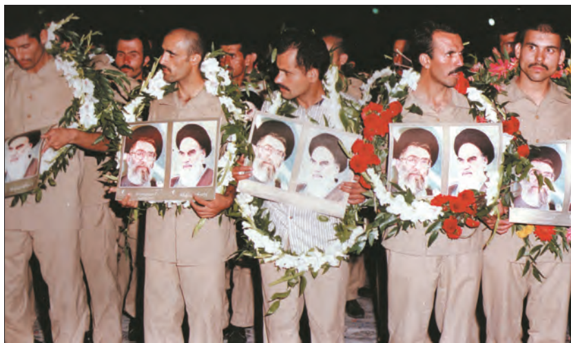
ورود گروهی از آزادگان (اسرا) به میهن عزیز

پس از برقراری آتش بس و دو سال مذاکره میان وزرای خارجه ایران و عراق، صدام در نامه‌ای به حجت‌الاسلام والمسلمین اکبر هاشمی رفسنجانی، رئیس جمهوری وقت ایران، قرارداد الجزایر را بار دیگر به رسمیت شناخت و اظهار داشت که شما به هر آنچه که می‌خواستید، رسیدید. پس از آن، آزادگان عزیز با استقبال گرم مردم ایران به آغوش میهن اسلامی بازگشتند. در سال ۱۳۷۰ نیز سازمان ملل متحد رسماً رژیم بعثی عراق را به‌عنوان متجاوز و آغازکننده جنگ معرفی کرد. به این ترتیب، جنگ هشت‌ساله‌ای که صدام با حمایت آمریکا با هدف سرنگونی جمهوری اسلامی و تصرف بخشی از خاک ایران آغاز کرده بود، با شکست خود او به پایان رسید و برای اولین بار در دو‌یست سال اخیر، دشمنان در جداسازی حتی یک وجب از خاک ایران ناکام ماندند.