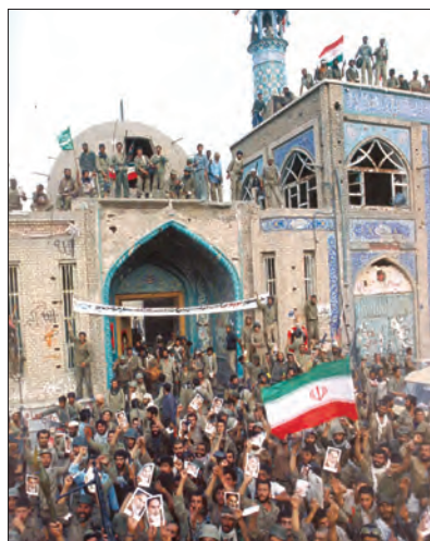
خرمشهر پس از آزادی - سوم خرداد ۱۳۶۱

پس از آنکه بنی صدر از مقام فرماندهی کل قوا و ریاست جمهوری عزل شد و اوضاع سیاسی کشور ثبات و آرامش یافت، رزمندگان اسلام با شجاعت و صلابت عزم خود را برای بیرون راندن دشمن متجاوز از خاک میهن عزیزمان جزم کردند. نخست، امام خمینی رهبر به عنوان فرمانده کل قوا، فرمان شکستن محاصره آبادان را صادر کردند؛ پس از آن رزمندگان ارتش، سپاه و بسیج در عملیاتی برق آسا، آبادان را از محاصره نیروهای متجاوز صدام نجات دادند. ۱ دلاورمردان ایران زمین سپس در چندین رشته عملیات غرورآفرین که مهم ترین آنها فتح المبین ۲ و بیت المقدس بودند، صدها کیلومتر مربع از خاک ایران را از اشغال ارتش بعثی آزاد کردند. اوج حماسه دفاع مقدس ملت ایران در عملیات بیت المقدس (سوم خرداد ۱۳۶۱) و با آزادی خونین شهر (خرمشهر) از اسارت دشمن بعثی رقم خورد و برگ زرینی در دفاع از ایران در تاریخ معاصر ثبت شد.