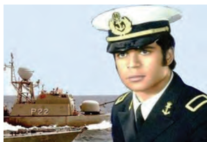
شهید محمدابراهیم همتی فرماندهٔ ناوچهٔ پیکان که در عملیات مروارید به شهادت رسید.

در پایتخت عراق، آمادهٔ عملیات شدند. یکی از این خلبانان شهید عباس دوران بود که در دو سال نخست جنگ، بیش از ۱۲۰ عملیات هوایی موفقیت‌آمیز علیه دشمن بعثی انجام داده بود. هواپیمای دوران در جریان این عملیات و پس از بمباران پالایشگاه بغداد، هدف اصابت موشک پدافند هوایی نیروهای بعثی قرار گرفت. این خلبان رشید با وجود اینکه می‌توانست با استفاده از چتر نجات سالم فرود آید، هواپیمای در حال سقوط را صاعقه‌وار به مکانی نزدیک محل برگزاری نشست سران عدم تعهد کوبید و رؤیای صدام را برای تشکیل آن نشست در بغداد و ریاست بر آن به باد داد.