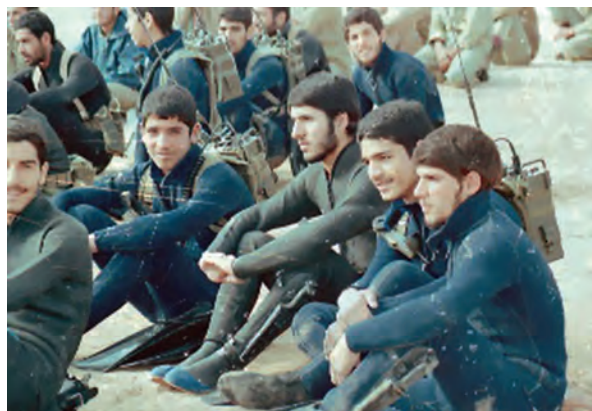
نوجوانان غواص ساعتی قبل از عملیات

معلمان و دانش‌آموزان نیز نقش چشمگیر و تأثیرگذاری در هشت سال دفاع مقدس داشتند. در آن سال‌ها جبهه‌های جنگ شاهد حضور صدها هزار دانش‌آموز و معلم ایرانی بود که برای دفاع از کیان نظام اسلامی و سرزمین مادری به جبهه رفتند و در سنگرها نیز از درس و مشق غافل نماندند. در طول دفاع مقدس حدود ۲۵۰۰ معلم و نزدیک به ۳۶۰۰۰ دانش‌آموز به شهادت رسیدند و هزاران نفر هم جانباز، اسیر و جاویدالاثرا شدند.