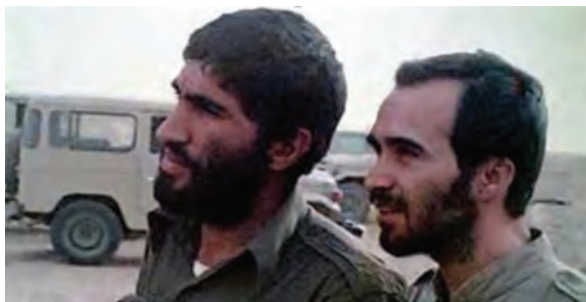
سردار شهید حسین خرازی، فرمانده لشکر ۱۴ امام حسین علیه السلام (شهادت: ۸ اسفند ۱۳۶۵ - شلمچه) و سردار شهید احمد کاظمی، فرمانده لشکر ۸ نجف‌اشرف (شهادت: دی ۱۳۸۴ - سانحه هوایی)

امام خمینی علیه السلام از ابتدای جنگ تحمیلی به صراحت اعلام کردند: «ما بر اساس اعتقاد و باور دینی خود اجازه نداریم به کشور دیگری تعدی کنیم و میل داریم در همه جای دنیا صلح و صفا باشد اما اگر کشوری به ما تعدی کرد، توی دهش می‌زنیم». ۱ بر اساس همین منطق نیز با شروع تجاوز نظامی رژیم بعثی عراق از همه قشرهای ملت خواستند که برای دفاع از ایران به سوی جبهه‌های نبرد بشتابند. همچنین به مسئولان توصیه کردند که جنگ را مسئله اصلی کشور بدانند و برای پیشبرد آن تا پیروزی نهایی بر دشمن، به رزمندگان و مردم یاری برسانند. اهتمام فراوان حضرت امام خمینی علیه السلام بر تقویت بنیه دفاعی و حمایت‌های ایشان برای بالا بردن کیفیت و کمیت امکانات و تجهیزات نظامی و تأمین بودجه‌های جنگ نیز از جمله تدابیر رهبری ایشان در طول دفاع مقدس بود که تا روزهای پایانی جنگ ادامه داشت، اما مهم‌ترین اقدام ایشان ایجاد تحول در روح و روان جوانان ایرانی بود. امام خمینی علیه السلام با تمسک به مفاهیم جهاد و شهادت و یادآوری حماسه عاشورا، میدان نبرد را به صحنه نمایش رشادت و شجاعت جوانان ایرانی تبدیل کردند. آنان در سایه ایمان و اعتقاد و خلاقیت خاص خویش همه محاسبات نظامی رایج در دنیا را بر هم زدند و با طراحی و انجام دادن عملیات‌های خارق العاده زمینی، هوایی و دریایی، افسران نظامی جهان را به شگفتی واداشتند. در نتیجه رهبری امام خمینی علیه السلام جلوه‌های زیبایی از ایثار و فداکاری در راه دین و میهن و همچنین تقویت انگیزه جهاد و روحیه شهادت‌طلبی در میان جوانان ایرانی به نمایش گذاشته شد. برخی از فرماندهان جوان دوران دفاع مقدس، امروز به نماد رشادت و مقاومت مردم سوریه و عراق علیه گروه‌های تکفیری و داعشی تبدیل شده‌اند.