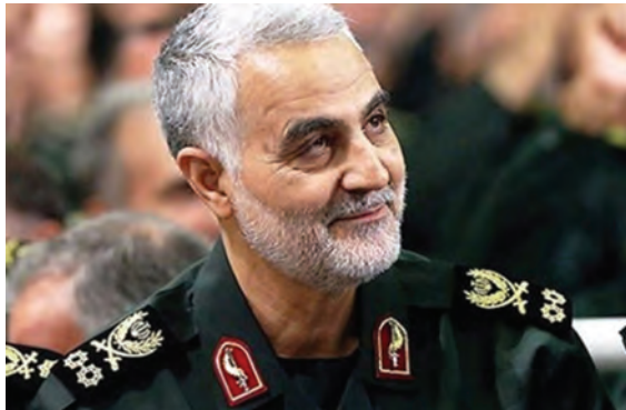
شهید سپهبد حاج قاسم سلیمانی (شهادت: ۱۳۹۸- ترور به دست نیروهای آمریکایی پس از حضور در عراق به دعوت رسمی این کشور)

در میان ملت ایران و در واقع همه ملت‌های آزاده جهان شناخته شود.