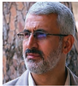
سردار شهید حسن شاطری (شهادت: ۱۳۹۱ - لبنان)