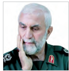
سردار شهید حسین همدانی (شهادت: ۱۳۹۶ - حلب سوریه)