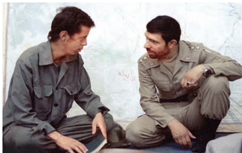
شهیدان سپهبد علی صیادشیرازی و سردار حسن باقری