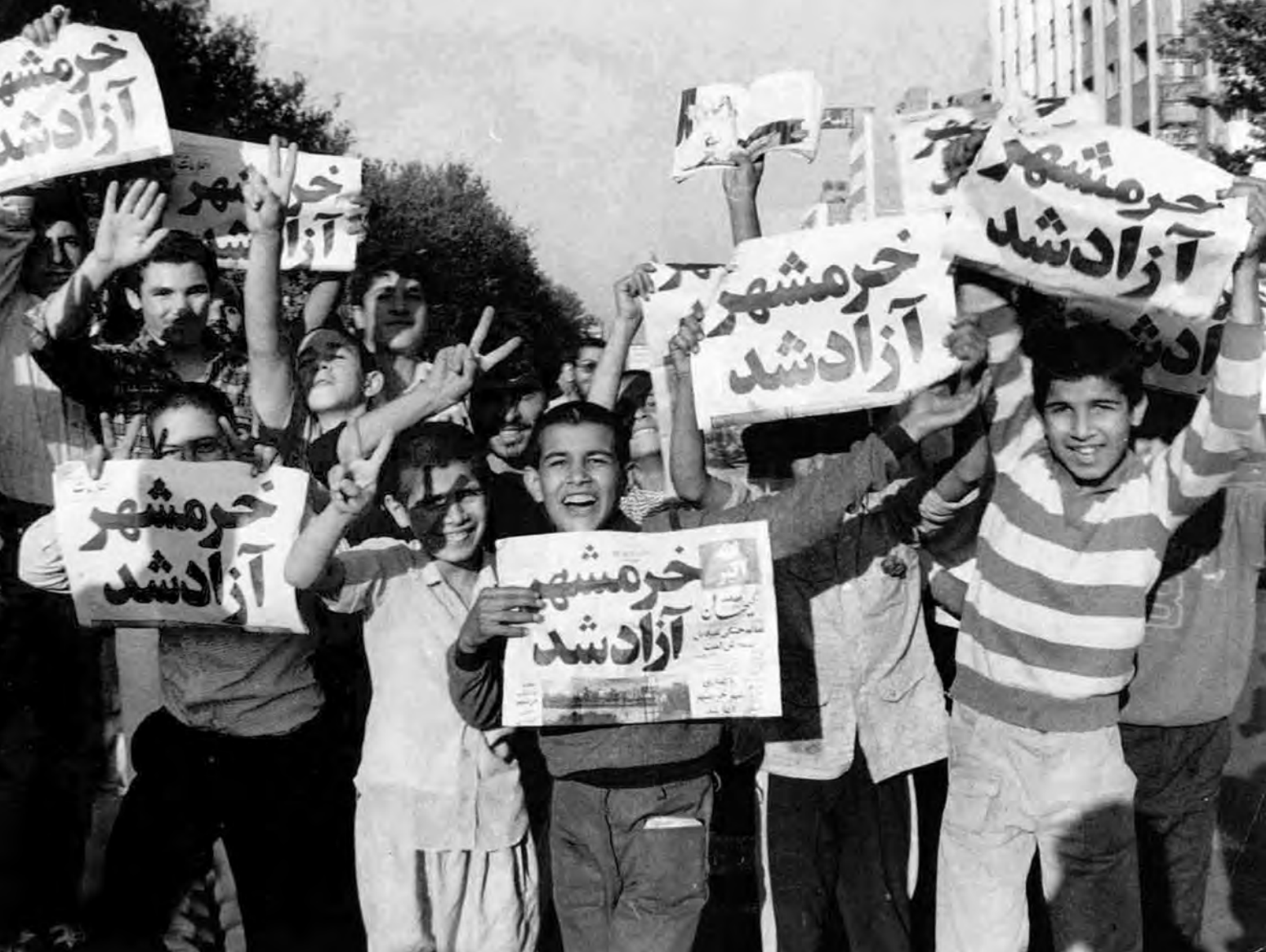
شادی دانش آموزان پس از آزادی خرمشهر

پس از آزادسازی خرمشهر، جنگ وارد مرحله تازه‌ای شد؛ از یک سو موفقیت‌های نظامی رزمندگان ایرانی ادامه یافت و از سوی دیگر، حامیان خارجی صدام برای جلوگیری از سقوط رژیم بعثی عراق، انواع تجهیزات نظامی پیشرفته از قبیل: هواپیماهای جنگی، موشک‌های دوربرد و سلاح‌های میکروبی و شیمیایی را در اختیار این رژیم گذاشتند. به دنبال باز پس‌گیری خرمشهر، جمهوری اسلامی ایران برای پایان دادن به جنگ و خون‌ریزی و رسیدن به حقوق خود، شروطی ۱ را مطرح کرد که مورد بی‌اعتنایی مجامع بین‌المللی و دیکتاتور عراق واقع شد. صدام پس از آن با حمایت بیشتر قدرت‌های بزرگ به بمباران و موشک باران شهرها و استفاده از بمب‌های شیمیایی روی آورد که در قوانین و عرف بین‌الملل ممنوع بود. بمباران شیمیایی شهر سردشت در استان آذربایجان غربی، روستای زرده از توابع شهرستان دالاهو در استان کرمانشاه و شهر حلبچه در کردستان عراق، از جمله جنایت‌های جنگی حکومت بعثی عراق به‌شمار می‌رود.