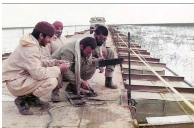
ساخت پل شناور خیبر بر روی هور العظیم یکی از شاهکارهای مهندسی رزمی جهادگران در دوران دفاع مقدس بود.

حضور داوطلبانه گروه‌ها و قشرهای مختلف مردم از سرتاسر ایران در جبهه‌های نبرد، کمک فراوانی به پیشبرد جنگ و کسب پیروزی کرد. علاوه بر نیروهای بسیجی، جهادگران جهاد سازندگی نیز داوطلبانه به جبهه رفتند. آنان که به سنگرسازان بی‌سنگر معروف بودند، مسئولیت مهم «مهندسی رزمی» را در دفاع مقدس به عهده گرفتند و به ایجاد خاکریز، پل‌ها و جاده‌ها و ساختن سنگر برای رزمندگان پرداختند.