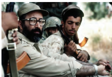
شهید مصطفی چمران

نیروی هوایی ارتش جمهوری اسلامی از نخستین ساعات‌های شروع جنگ وارد عمل شد و با رشادت و شجاعت تمام، ضربهٔ مهلکی به رژیم صدام وارد آورد. ۱ در جبههٔ زمینی نیز رزمندگان ارتش، سپاه پاسداران و ژاندارمری به همراه مردم شهرها و