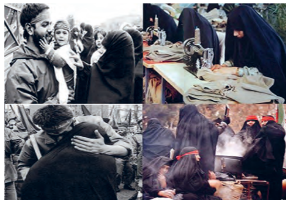
مشارکت مؤثر در دفاع مقدس