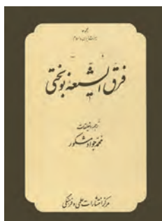
فروق الشیعه نوشته حسن بن موسی نوبختی، متکلم و فیلسوف شیعی قرن سوم و چهارم قمری است که علاوه بر فرقه‌های شیعه، دیگر فرقه‌های اسلامی را هم معرفی کرده است. نوبختی در عصر غیبت صغرا می‌زیسته است.

همان‌طور که گفته شد، اصول اعتقادی تشیع که زیربنای فکری مردم ایران را ساخته است، در سه علم کلام، فلسفه و عرفان مورد بررسی قرار می‌گیرد. این علوم گرچه در آغاز مدون و ممتاز از یکدیگر نبودند، اما هم‌زمان با گسترش و توسعه مباحث دینی، هر یک چهره‌ای ممتاز یافتند. فرقه‌های کلامی اولین گروه‌های فکری بودند که در جامعه اسلامی آشکارا شکل گرفتند. تشیع به دلیل اعتباری که به عقل می‌بخشید، افزون بر آنکه کلام خود را بر اساس روش برهانی و استدلالی بنیان نهاد و متکلمان عقل‌گرای برجسته‌ای مانند شیخ مفید، سید مرتضی، شیخ طوسی، خواجه نصیرالدین طوسی و علامه حلی را به جهان معرفت عرضه داشت، زمینه بسط علوم فلسفی را نیز فراهم آورد. به همین دلیل، حرکت‌ها و مکتب‌های فلسفی اسلامی همواره در مهد تشیع رشد یافته است. فارابی، ابن‌سینا، سهروردی، خواجه نصیرالدین طوسی، میرداماد و ملاصدرا از نام‌آوران فلسفی شیعی هستند که بی‌گمان تاریخ فلسفه اسلامی با نام آنها گره خورده است.