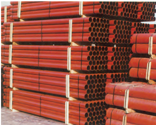
شکل ۱-۲- لوله ی چدنی بدون سرکاسه