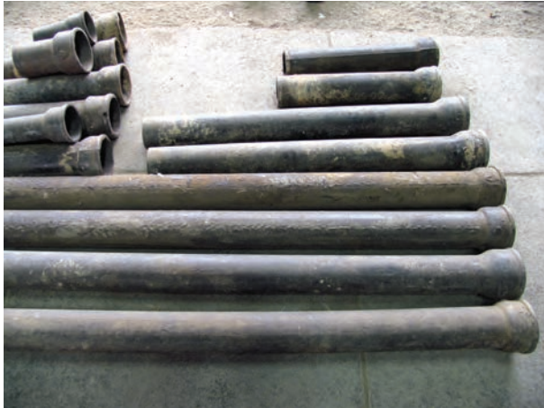
شکل ۱-۱- لوله ی چدنی سرکاسه دار