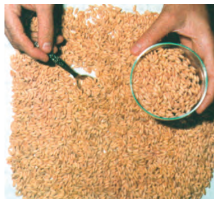
شکل ۲۰-۳- بذور عاری از علف هرز

الف) استفاده از بذور عاری از بذور علف هرز (شکل ۲۰-۳):