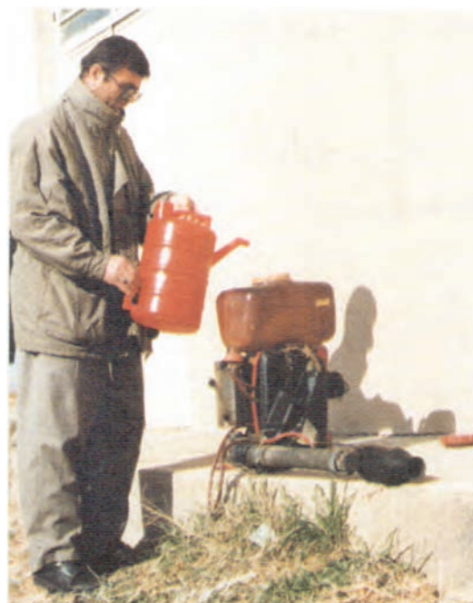
شکل ۲۴-۳- پر کردن مخزن شعله افکن