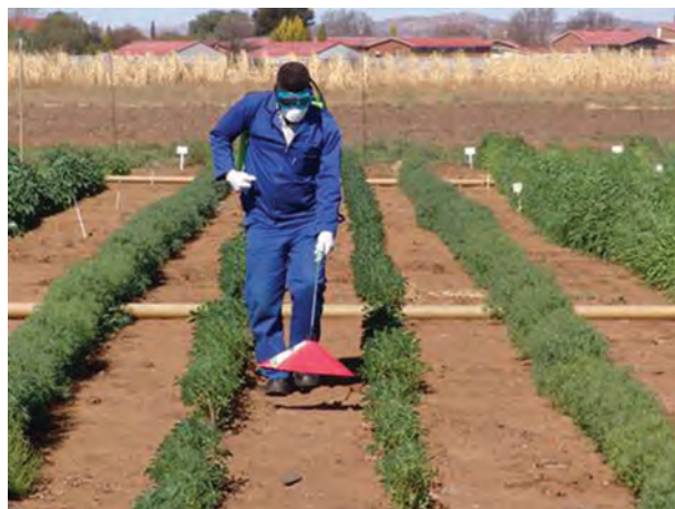
شکل ۲۳-۳- کنترل علف های هرز با استفاده از گرما

کنترل فیزیکی علف های هرز از گرما و آتش استفاده می شود. (شکل ۲۳-۳).