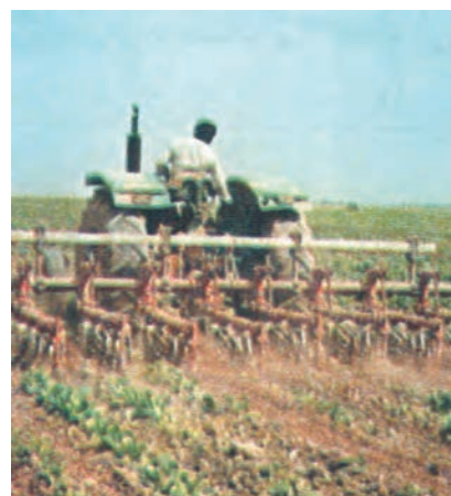
شکل ۲۲-۳- وجین علف های هرز با استفاده از ماشین مرکب سله شکنی و وجین کن

۳- تراکتور را طوری وارد مزرعه کنید که چرخ های آن در بین ردیف ها قرار گیرد و به گیاه اصلی صدمه وارد نسازد. تراکتور را به طور اصولی و صحیح و با سرعت مناسب، در مزرعه به حرکت در آورید تا عمل سله شکنی و وجین انجام شود (شکل ۲۲-۳). گزارش کار این فعالیت ها را به مربی خود تحویل دهید.