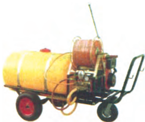
شکل ۳۰-۳- سم‌پاش فرغونی

فشار در این سم‌پاش‌ها زیاد و تعداد نازل کم و معمولاً یک عدد است و شیلنگ و لانس بر سر آن نصب می‌شود. برای سم‌پاشی علف‌های هرز مزارع، سم‌پاش را در بیرون مزرعه قرار می‌دهند و حدود ۵۰ تا ۱۰۰ متر شیلنگ را به آن اضافه می‌نمایند. سپس به همراه ۲ تا ۳ نفر، این شیلنگ‌ها را به داخل مزرعه برده و سم‌پاشی را انجام دهید (شکل ۳۰-۳).