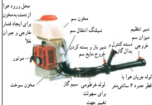
شکل ۲۹-۳- سم‌پاش موتوری پشتی اتومایزر

لحاظ قدرت کاری، شبیه سم‌پاش استوانه‌ای ساده است؛ با این تفاوت که به‌جای تلمبه زدن از یک موتور کوچک و یک پمپ ساترِفِوژ استفاده می‌شود. بنابراین کار با آن آسان است و زحمت کمتری دارد. حجم مخزن آن ۲۰ لیتر است و می‌توانید فشار در این سم‌پاش را از ۱ تا ۵ بار تغییر دهید، اما برای سم‌پاشی لازم است آن را بین ۲ تا ۳ بار تنظیم نمایید (شکل ۲۸-۳).