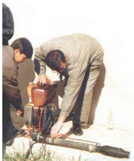
شکل ۲۵-۳- آماده سازی و روشن کردن شعله افکن