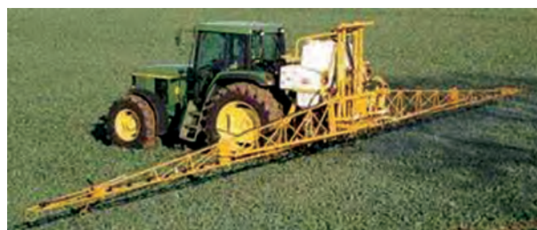
شکل ۳۱-۳- سم پاش پشت تراکتوری بوم دار

لازم است سالیانه حداقل یک بار سم پاش را، چنان که توضیح داده شد، برای تنظیم میزان خروجی، کالیبره نمایید. از این نوع سم پاش در ایران برای مبارزه با علف های هرز مزارع بزرگ استفاده می شود (شکل ۳۱-۳).