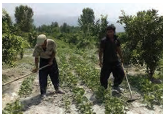
شکل ۲۱-۳ وجین علف های هرز با استفاده از وسایل دستی

۴- علف های هرز را از محصول اصلی تشخیص دهید و آنها را با استفاده از ابزار، از خاک خارج کنید (شکل ۲۱-۳).