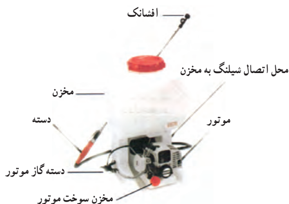
شکل ۲۸-۳- سم‌پاش موتوری پشتی لانس‌دار