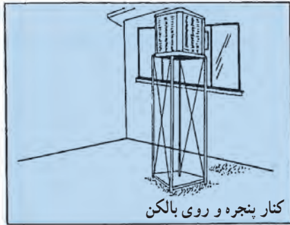
کنار پنجره و روی بالکن