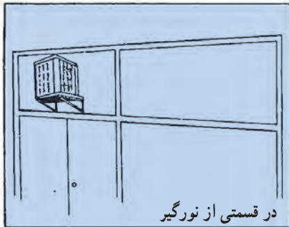
در قسمتی از نورگیر