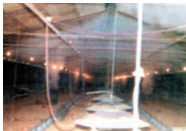
مادرهای گازی آویز