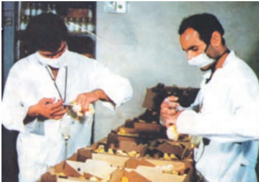
واکسیناسیون جوجه یکروزه در مؤسسات جوجه کشی