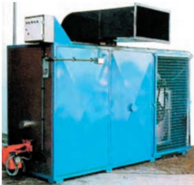
نمونه یک نوع هیتر

۲- مادر مصنوعی زمینی: مادرهای مصنوعی در این نوع، برعکس مادرهای آویز که حرارت از بالای سر جوجه توزیع می‌شود، منبع حرارتی در زمین قرار دارد و جوجه را گرم می‌کند. بدین ترتیب که از منبع حرارتی، گرما به وسیله آب گرم و یا هوای گرم، به کمک لوله‌هایی به داخل جایگاه فرستاده می‌شود. هیتر: امروزه در بسیاری از مرغداریها برای گرم کردن جایگاه از هیتر استفاده می‌شود. در این روش دستگاه تولیدکننده گرما در خارج از جایگاه قرار دارد و هوای گرم به واسطه کانال به داخل جایگاه فرستاده می‌شود و درجه حرارت داخل جایگاه با ترموستاتی کنترل می‌گردد.