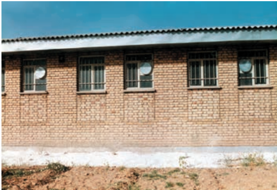
تصویر نمای خارجی یک جایگاه پنجره‌دار

تهویه در این روش بستگی به جهت قرار گرفتن جایگاه و پنجره‌های آن دارد.