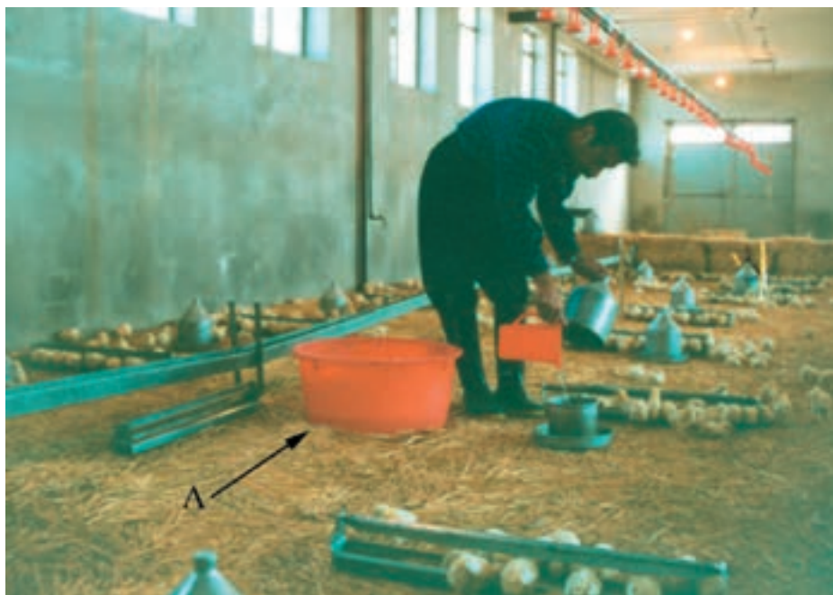
تقسیم واکسن آشامیدنی آماده شده در بین آبخوریهای دستی A: ظرف حاوی محلول واکسن تهیه شده

۱- روش آشامیدنی: این روش یکی از ساده ترین شیوه های واکسینه کردن است. در این روش باید به مقدار مجاز