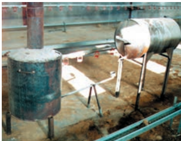
تصویر نوعی بخاری داخل جایگاه که کنترل حرارت به وسیله آن مشکل است و احتمال آتش‌سوزی در آن زیاد است.