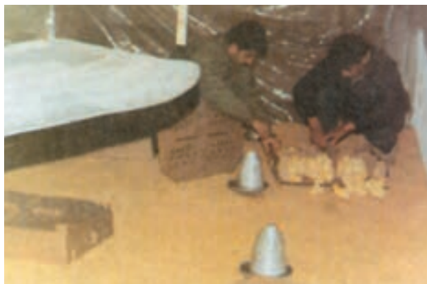
نوعی مادر مصنوعی