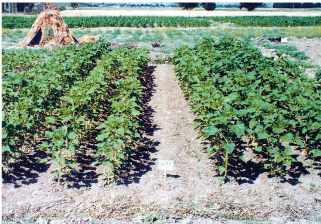
شکل ۹-۵- مزرعهای که عملیات داشت، به‌درستی و به موقع در آن صورت گرفته است.

علفهای هرز زراعت آفتابگردان را شناسایی کنید: در مناطق مختلف و در یک منطقه در زراعتهای مختلف، علفهای هرز متفاوتی وجود دارند. به بیان دیگر، یک علف هرز در همه شرایط از نظر تعداد، تنوع و خسارت یکسان عمل نمی‌کند. بنابراین، کار درست آن است که علفهای هرز مهم منطقه را شناسایی نموده، آنها را از نظر درجه اهمیت و خسارت برای محصول مورد کاشت درجه‌بندی کنید. تحقیق کنید: با مراجعه به مزارع اطراف محل سکونت خود: