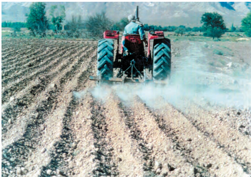
شکل ۴-۷- ایجاد جویچه‌های آبیاری پس از بذرکاری دستی