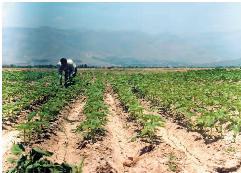
شکل ۵-۵- مزرعه‌ای که عملیات واکاری و تنک به موقع صورت گرفته و تراکم مطلوب ایجاد شده است.

اگر در انتخاب بذر، آماده‌سازی، تنظیم ماشین کارنده و آبیاری اول به دقت و ظرافت عمل کرده باشید معمولاً نیازی به این عملیات نخواهد بود.