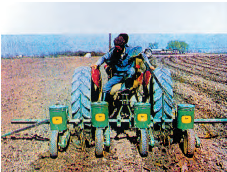
شکل ۴-۵- کاشت با استفاده از ردیفکار مکانیکی

زارعین منطقه شما، آفتابگردان را با چه وسیله‌ای می‌کارند؟ دلیل آنها چیست؟