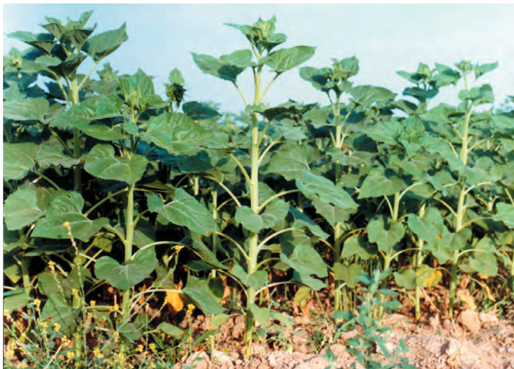
شکل ۱۰-۵- پس از کامل شدن پوشش گیاهی، آفتابگردان بر علفهای هرز غلبه پیدا می‌کند.