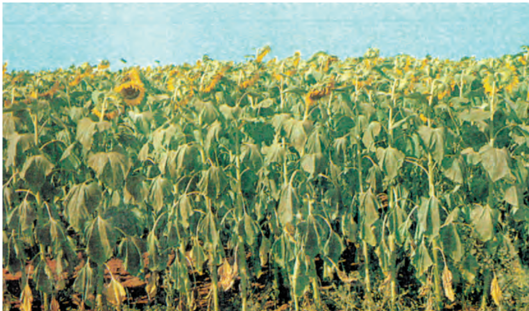
شکل ۴-۵- اثر تنش رطوبتی در آفتابگردان