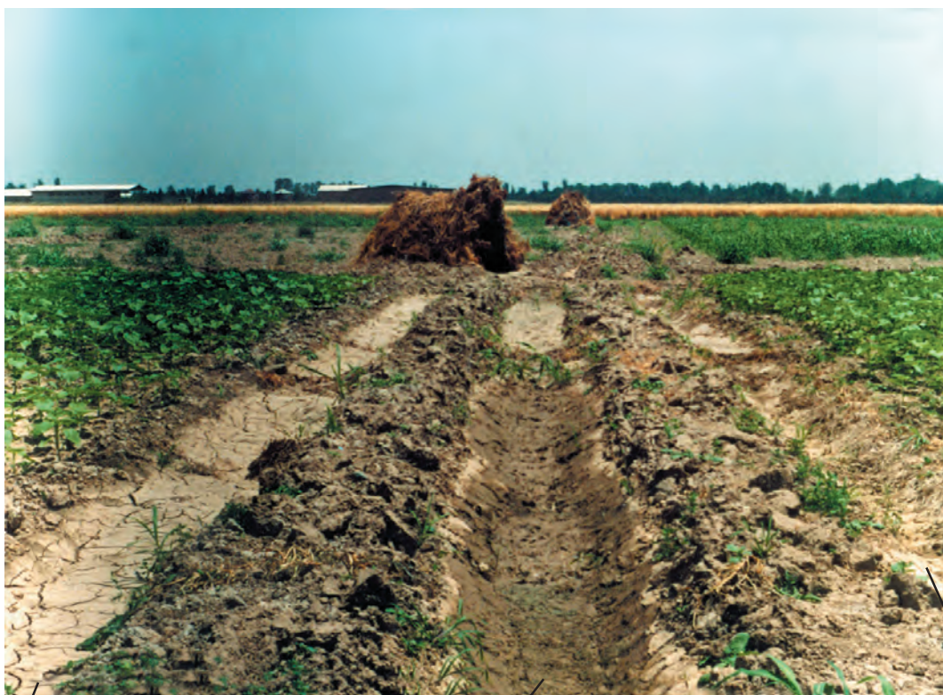
نهر فرعی آبیاری قطعه دوم