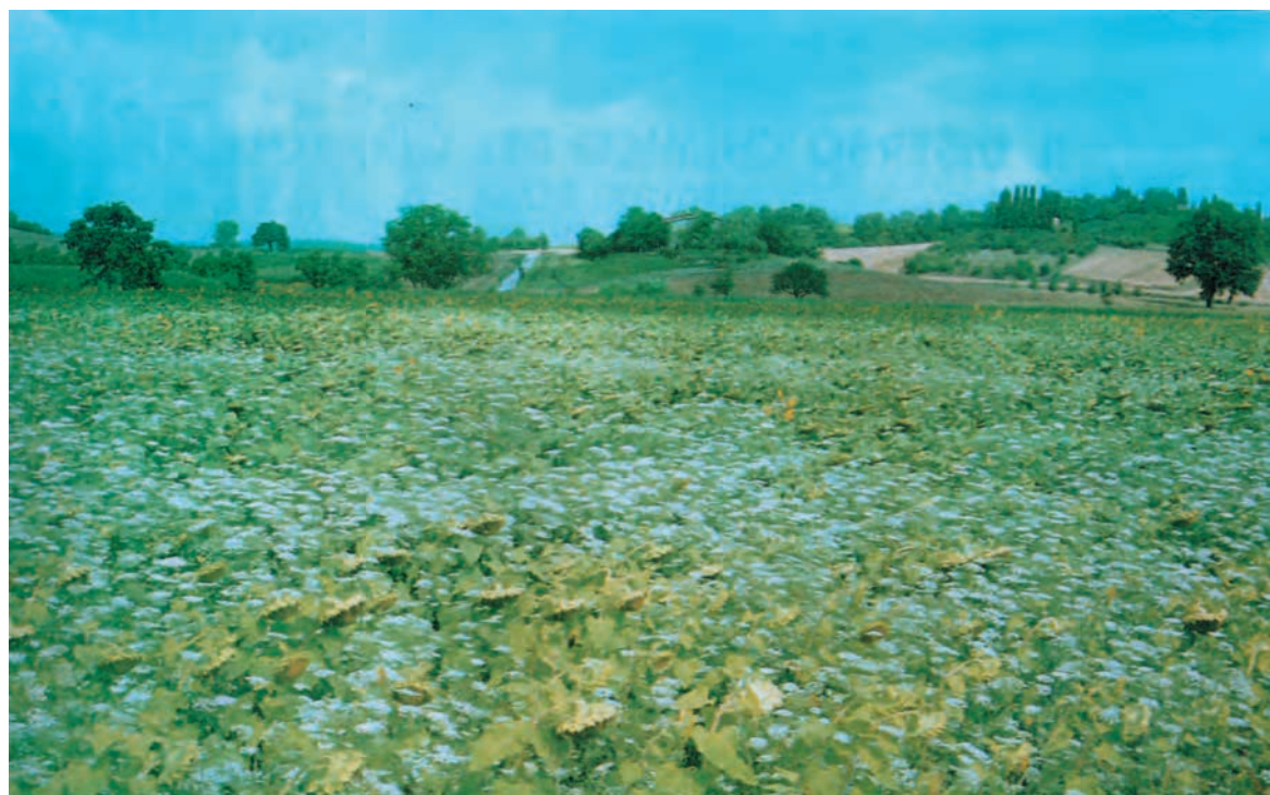
شکل ۷-۵ مزارع آفتابگردان که علفهای هرز آن کنترل نشده است.