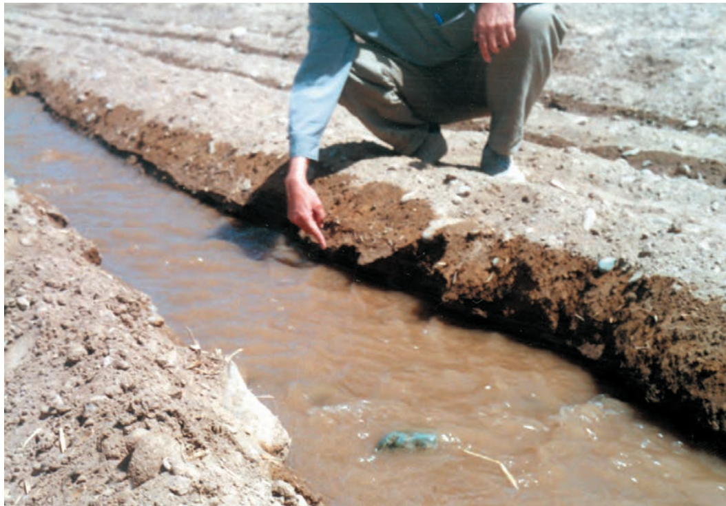
شکل ۱-۵– نهر اصلی آبیاری مزرعه در بالا دست زمین

۲۱– آبیاریهای بعدی را با توجه به نظام حق آبه و عرف منطقه انجام دهید.