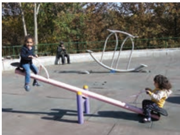
شکل ۲- انواع ارتباط کودک