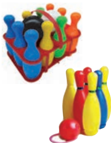
شکل ۵- میخ‌های بازی

میخ‌های بازی: در این بازی، میخ‌هایی به شکل سه گوش در انتهای اتاق قرار داده و از کودک خواسته می‌شود در قسمت روبه‌روی انتهای اتاق بایستد و توپ را به سوی میخ‌ها پرتاب کند. هدف، انداختن تمام میخ‌هاست. اگر کودکی در پرتاب کردن یا نشانه گرفتن مشکل داشته باشد، می‌توان فاصله‌ها را کوتاه‌تر کرد. (شکل ۵) ابزارهای گوناگونی مانند بطری‌ها و یا لیوان‌های پلاستیکی جایگزین مناسبی برای میخ‌های بازی هستند.