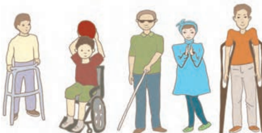
شکل ۳- کودکان دارای نیاز ویژه