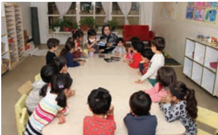
شکل ۱- ارتباط بین بزرگسالان و کودک

فعالیت ۱: با توجه به تصویر بالا، ضرورت ارتباط بین بزرگسالان و کودک را چگونه ارزیابی می‌کنید؟ آیا نوع واکنش و برخورد بزرگ‌ترها در یادگیری مهارت‌های اجتماعی کودکان مؤثر است؟