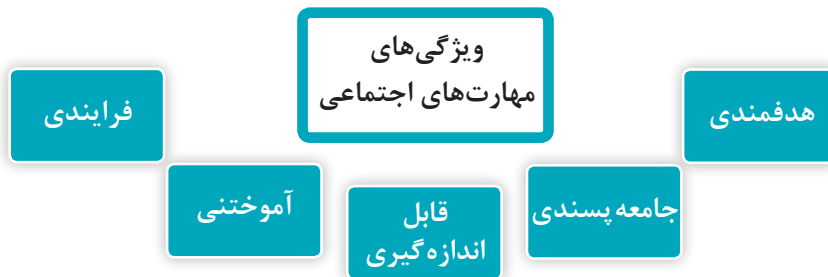
نمودار ۱ - ویژگی‌های مهارت‌های اجتماعی

مهم‌ترین مهارت‌های اجتماعی مورد نیاز کودکان شامل مهارت‌های اجتماعی مربوط به شناخت خود، محیط و مهارت‌های اجتماعی بین فردی است.