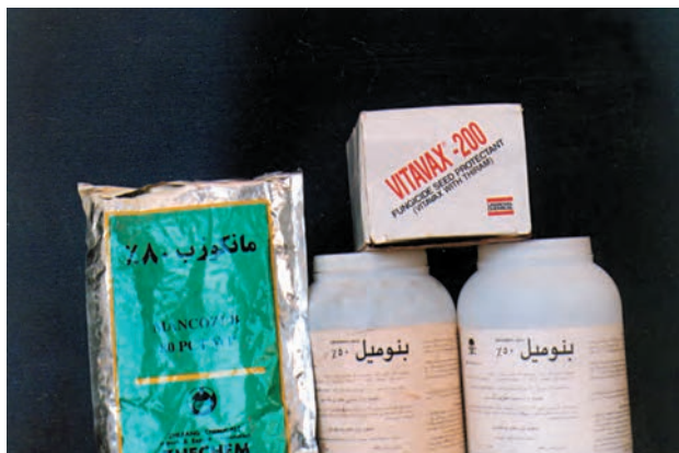
شکل ۱-۵۹- انواع سموم ضدعفونی کننده گندم

مهارت: کشت گندم و جو شمارۀ شناسایی: ۱۱-۱-۷۴/ک