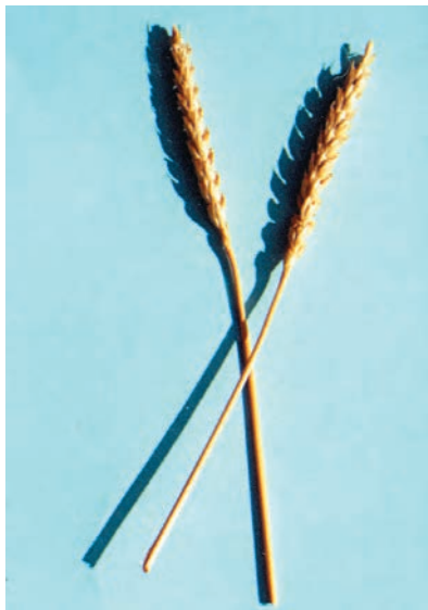
شکل ۱-۳۴ - بزوستایا

گندم بزوستایا: اصل آن از کشور شوروی سابق است. سنبله آن ریشک دار گلوم بدون کرک و سفیدرنگ است. ارتفاع بوته متوسط، رنگ دانه قرمز می باشد. گندمی است پاییزه، متوسطرس، مقاوم در برابر خوابیدگی، ریزش، سرما، زنگ زرد و شوری. خاصیت نانوایی این گندم خوب، پروتئین آن بالا و از نوع مرغوب است (شکل ۱-۳۴).