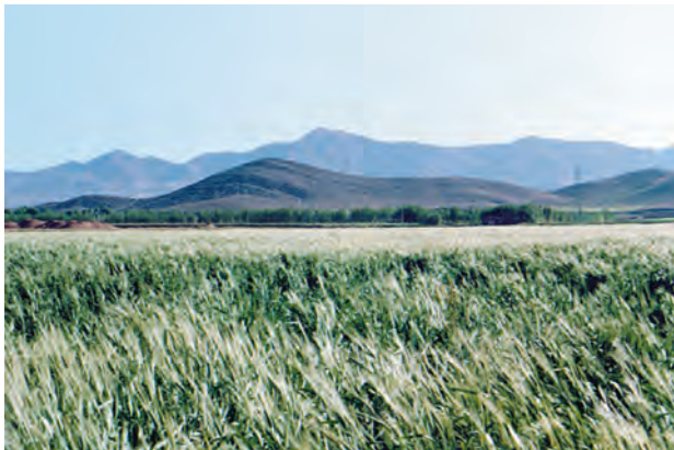
شکل ۱-۵۲- خوابیدگی در گندم