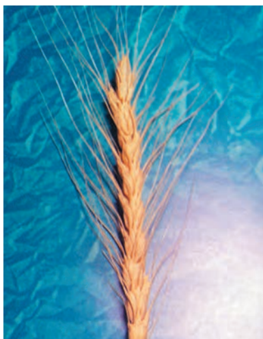
شکل ۱-۳۵ - گندم اینیا ۶۶

پیمانۀ مهارتی: انتخاب ارقام مناسب گندم و جو برای کشت شماره شناسایی: ۱۱-۱-۷۴/ک