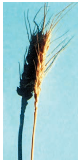
شکل ۴۸-۱- کرج ۲