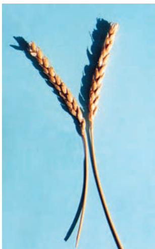
شکل ۳۰-۱- سفیدک