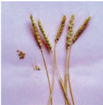
شکل ۱-۳۱ - گندم بکراس - روشن

پیمانۀ مهارتی: انتخاب ارقام مناسب گندم و جو برای کشت شماره شناسایی: ۱۱-۱-۷۴/ک