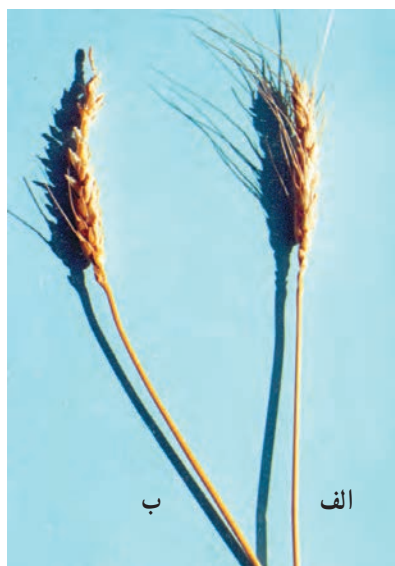
شکل ۱-۵۳- الف- گندم مقاوم در برابر ریزش، ب- گندم حساس نسبت به ریزش