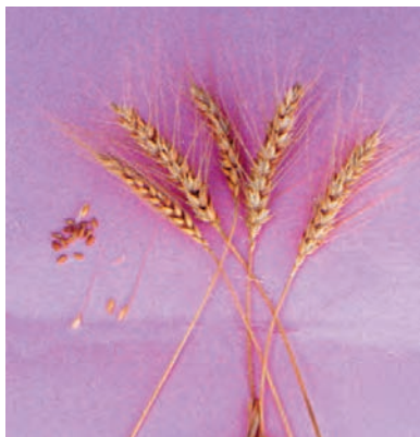
شکل ۴۹-۱- گندم C-73-20