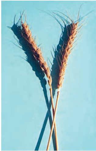
شکل ۲۹-۱- شاه پسند

گندم شاه پسند: سنبله ریشک دار، اندازه بوته بلند، رنگ دانه سفید مایل به قرمز، گندمی پاییزه، دیررس، مقاوم در برابر ریزش و خوابیدگی و نسبت به زنگها و سیاهکها و خشکی حساس است. ارزش نانوایی آن خوب نیست. (شکل ۲۹-۱)