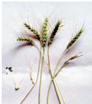
شکل ۵۰-۱- گندم گلینسون

مهارت: کشت گندم و جو شمارۀ شناسایی: ۱۱-۱-۷۴/ک