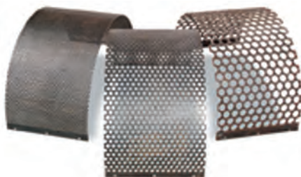
شکل ۳-۳ انواع غربال (توری)