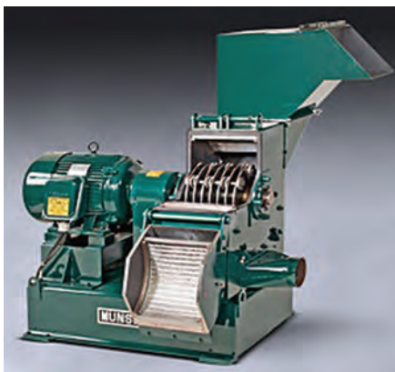
شکل ۲-۳ آسیاب چکشی