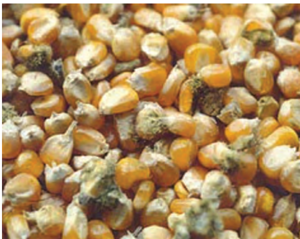
شکل ۴-۷- دانه های ذرت آلوده

۲-۴-۵- درجه بندی مواد اولیه : مواد اولیه ای که در دان طیور استفاده می کنید باید از مواد خوراکی درجه یک باشد و هیچ گونه آلودگی قارچی نداشته باشد. هم چنین این مواد باید سالم و بدون شکستگی باشد، زیرا شکسته بودن این مواد زمینه آلوده شدن به قارچ ها را فراهم می کند. مواد اولیه شکسته ایجاد خاک می کند و جزء مواد درجه پایین است.