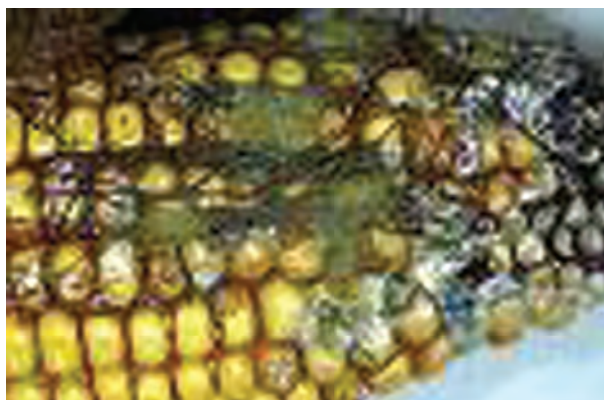
شکل ۴-۶- بلال کپک زده

۱-۴-۶- قارچ کش ها و روش های استفاده از آنها : جداسازی و تمیز کردن، اولین اقدام برای کنترل مواد آلوده به شمار می رود. در مرحله بعد و در صورت وجود آلودگی از قارچ کش ها استفاده نمایید.