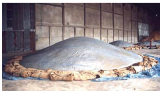
شکل ۲-۴- نحوه نگه‌داری مواد در انبار