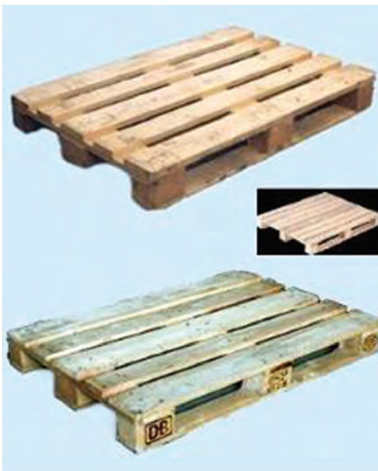
شکل ۱-۴- پالت چوبی