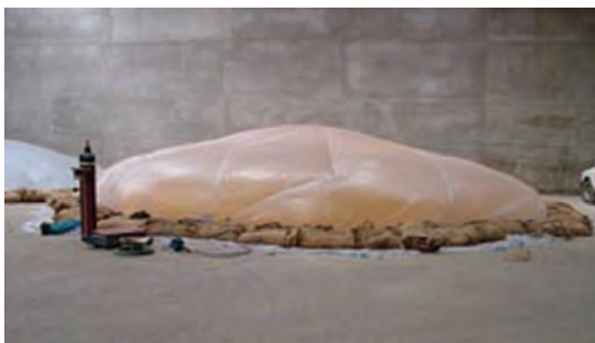
شکل ۳-۴- هوادهی مواد خوراکی

تا آلوده نبودن آن به حشرات، کنه‌ها و آفات محرز گردد. علاوه بر این حداقل هر هفته یک بار محتوی انبار را از نظر وجود احتمالی آفات و امراض بازرسی کنید و در صورت لزوم نمونه‌هایی از آن را برای آزمایش به آزمایشگاه بفرستید.