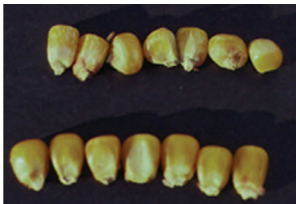
شکل ۴-۴- شناسایی ظاهری مواد خوراکی