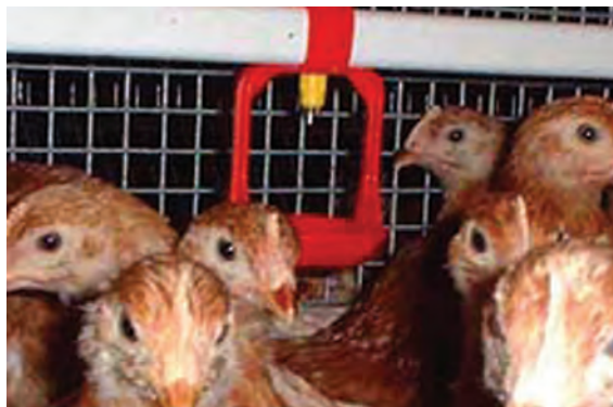
تصویر ۱۰-۴- انواع آب خوری چکه ای

توجه داشته باشید که، علاوه بر راحت و مناسب بودن برای مرغ، تلفات دان را نیز به حداقل برساند.