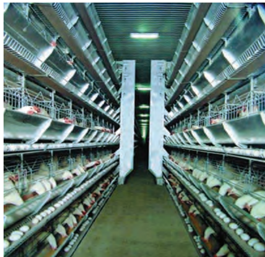
تصویر ۸-۴- جمع‌آوری تخم‌مرغ به روش خودکار