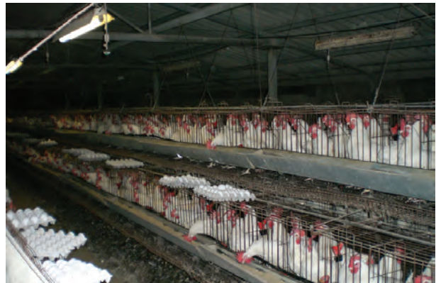
تصویر ۷-۴- جمع‌آوری تخم‌مرغ به روش دستی