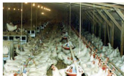
تصویر ۱۱-۴- انواع لانه تخم گذاری