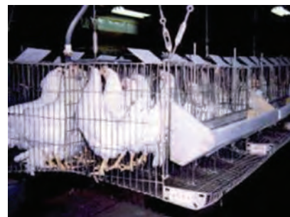
تصویر ۴-۲- قفس مرغ تخم گذار