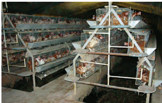
تصویر ۴-۶ - قفس پله ای