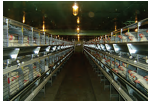
تصویر ۴-۴ - انواع قفس باتری