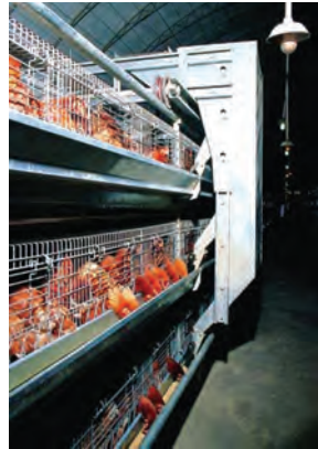
تصویر ۹-۴- دان خوری خودکار