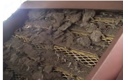
تصویر ۳-۷ کود در حال تخلیه از ماشین‌آلات مکانیکی

نوار نقاله: در قفس‌های دارای نوار نقاله، کود در زیر قفس بر روی صفحه‌ای از جنس پلاستیک ضخیم یا برزنت می‌ریزد. صفحه به صورت نوار بی‌انتهایی است که روزانه یک بار به حرکت درمی‌آید. در انتهای سالن روی هر نوار یک تیغه به صورت ثابت نصب شده است. تیغه کود را می‌تراشد و در چاله می‌ریزد.