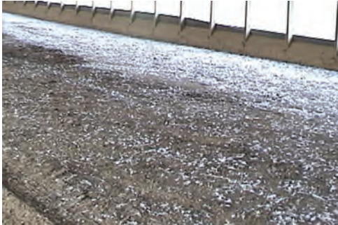
تصویر ۱-۷ کود ناخالص در پایان دوره‌ی پرورش

یکی از مسائل صنعت طیور چگونگی حذف مواد زائد از سالن‌های مرغداری است. کود به علت داشتن عوامل بیماری‌زا، افزایش رطوبت بستر، تولید بوی نامطلوب و نیز ازدیاد حشرات مشکلات زیادی در واحدها ایجاد می‌کند. با توجه به این مسائل جمع‌آوری مناسب کود، به‌ویژه در واحدهای مرغ تخم‌گذار که دوران پرورش طولانی‌تری دارند، اهمیت زیادی دارد.