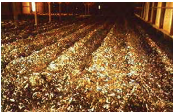
تصویر ۱۰-۷- جمع‌آوری کود در روش گودال عمیق

۳- هرگاه تیغه را بر روی ۵ متر تنظیم نمایید، تیغه از انتهای سالن حرکت می‌کند و تا ۵ متر جلو می‌آید، سپس در نقطه‌ی ۵ متر متوقف می‌شود و به عقب باز می‌گردد و تمام کودهای این فاصله را به داخل کانالی در عرض سالن می‌ریزد.