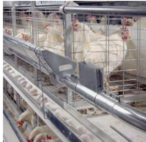
تصویر ۷-۸- انتهای نوار نقاله در سالن