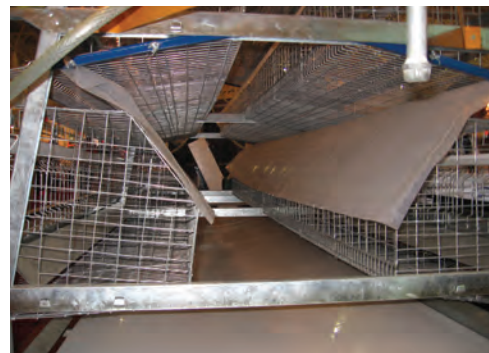
تصویر ۵-۷ صفحات مایل در زیر قفس