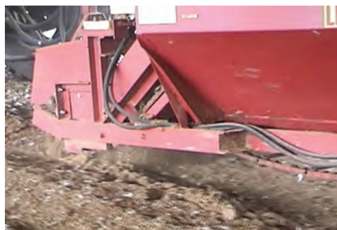
تصویر ۲-۷ جمع‌آوری کود با ماشین‌آلات مکانیکی