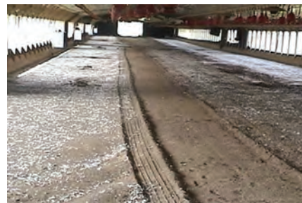
تصویر ۴-۷ تخلیه‌ی قسمتی از کود سالن پرورش به روش مکانیکی