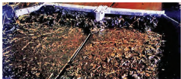
تصویر ۹-۷- تیغه‌ی جمع‌آوری کود