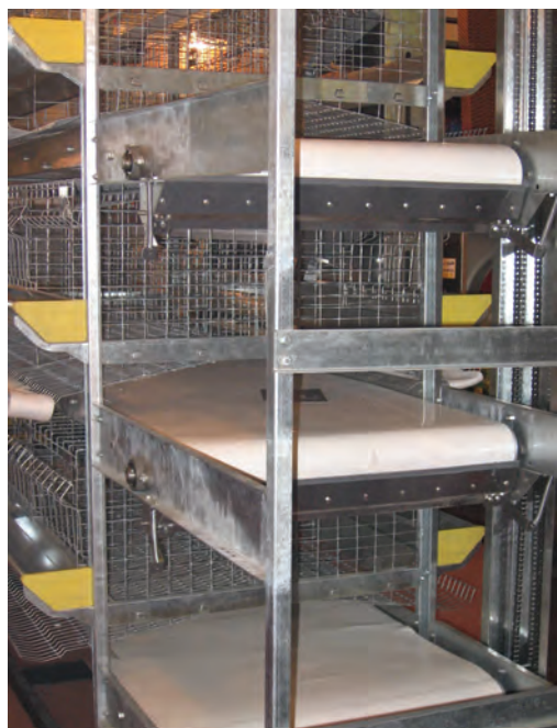
تصویر ۶-۷ انواع نوار نقاله

در سیستم قفس روش‌های متفاوتی وجود دارد اما دو روش اصلی جمع‌آوری کود به صورت دستی و خودکار است. ۱- دستی: در روش دستی از صفحات مایلی در زیر قفس استفاده می‌کنند. این صفحات سبب می‌شوند کود به راهروی بین قفس‌ها بریزد و سپس کارگران زیر قفس‌ها را با وسایل ابتدایی تخلیه می‌کنند.