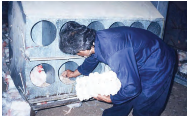
تصویر ۳-۶- جمع‌آوری دستی تخم مرغ