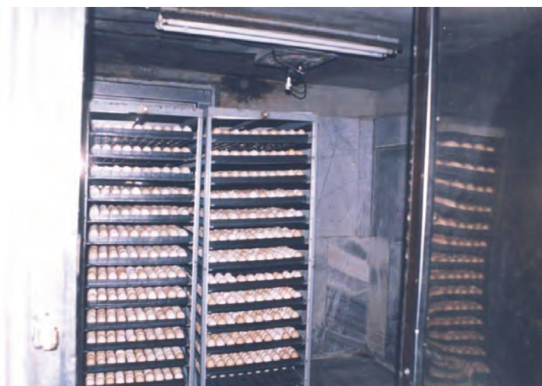
تصویر ۲-۳- تخم‌مرغ‌ها در اتاق دود

مقادیر فرمالین و پرمنگنات پتاسیم ذکر شده در جدول برای ۲/۸ متر مکعب فضاست.