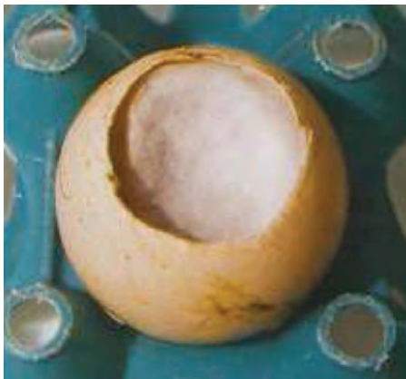
تصویر ۱-۳- آلودگی قارچی

بیماری‌ها و تلفات در چند روز اول، بعد از خروج جوجه از تخم مرغ، نیز اغلب با فساد باکتریایی ارتباط دارند. هم‌چنین فساد باکتریایی سبب کاهش میزان جوجه درآوری است. بنابراین، تخم مرغ‌های جوجه‌کشی که به شدت به میکرب‌ها آلوده‌اند، مشکلات زیادی در واحدهای جوجه‌کشی ایجاد می‌نمایند. از این رو لازم است در ابتدای ورود تخم مرغ‌ها به واحد جوجه‌کشی به اتاق‌های گاز انتقال یابند و ضدعفونی شوند.