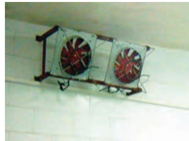
تصویر ۳-۵- ایجاد جریان هوا در اتاق دود