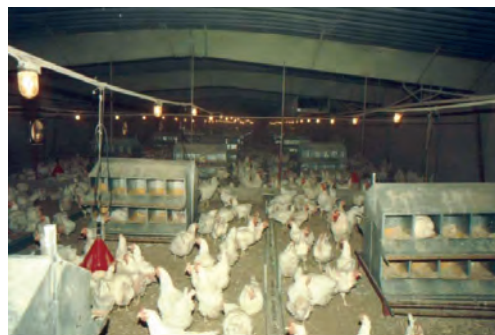
تصویر ۸-۳- استفاده از لانه‌ی مرغداری به تعداد کافی

این افراد برای ورود باید لباس خود را تعویض کنند و پس از گرفتن دوش و پوشیدن لباس کار، با چکمه‌های خود از داخل ماده‌ی ضدعفونی‌کننده عبور نمایند. کارکنان واحد جوجه‌کشی نباید در مرغداری‌ها شاغل باشند و یا در خانه‌ی خود از پرندنگه‌داری کنند. هم‌چنین برای رعایت بهداشت فردی باید به‌طور منظم به پزشک مراجعه کنند.