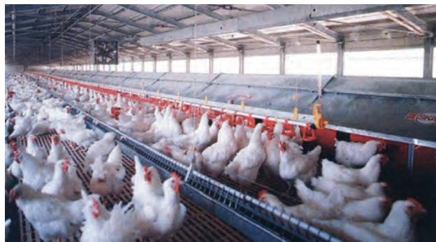
تصویر ۳-۷- لانه‌ی تخم‌گذاری اتوماتیک