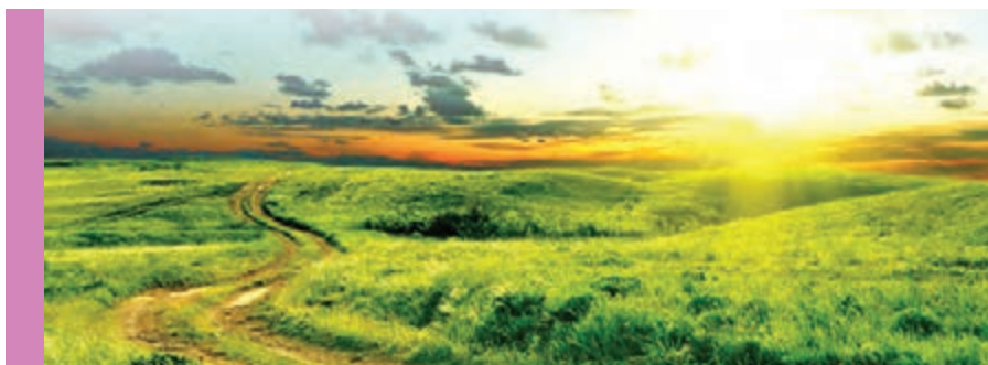
۱. سوره فاطر/ آیه ۴۱.

۲. در نتیجه اعتقاد فوق، انسان خداشناس می‌داند که زندگی در جهانی قانونمند که پشتوانه آن علم و قدرت خداست، به وی امکان حرکت و فعالیت می‌دهد. زیرا او می‌تواند قوانین حاکم بر جهان خلقت را بشناسد و برای رفع نیازهای خود از قوانین استفاده کند و به هدف‌های خود برسد. به عبارت دیگر، او در جهانی زندگی می‌کند که «قضا و قدر الهی» بر آن حاکم است.